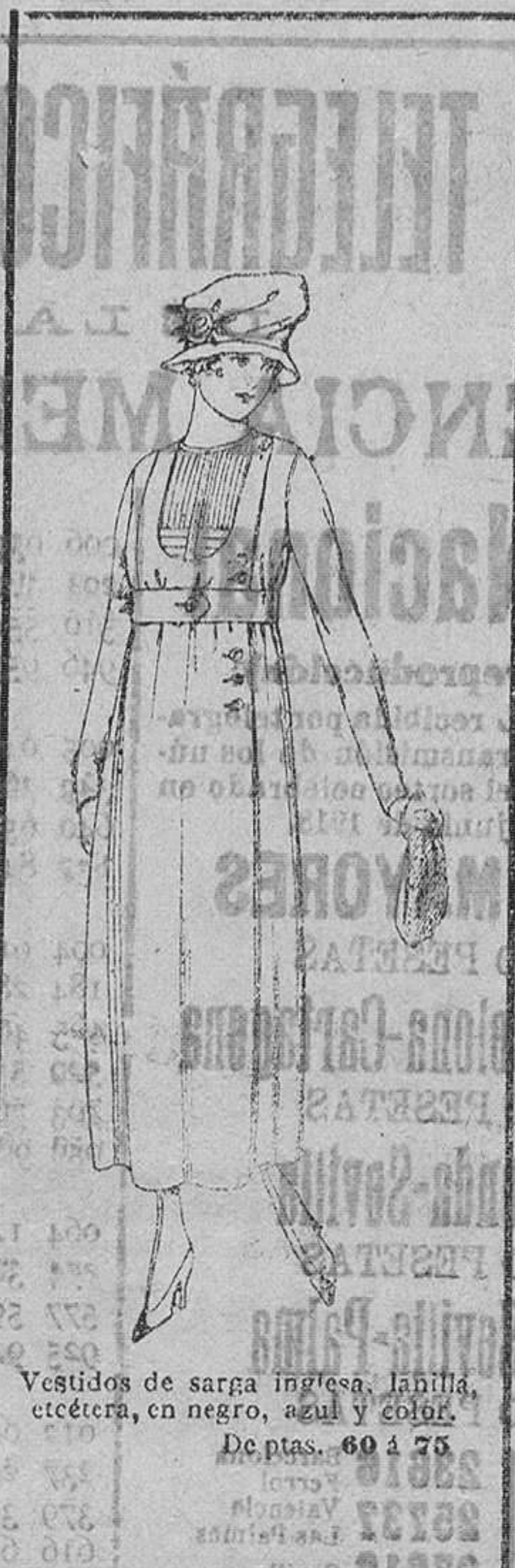
Vestidos de sarga inglesa, lanilla, etcétera, en negro, azul ó color. De ptas. 60 á 75.

Camisoria, Géneros de punto, Corbatería, Guantería, Sombrereria, Zapatería, Paraguas, Bastones y Artículos de viaje.