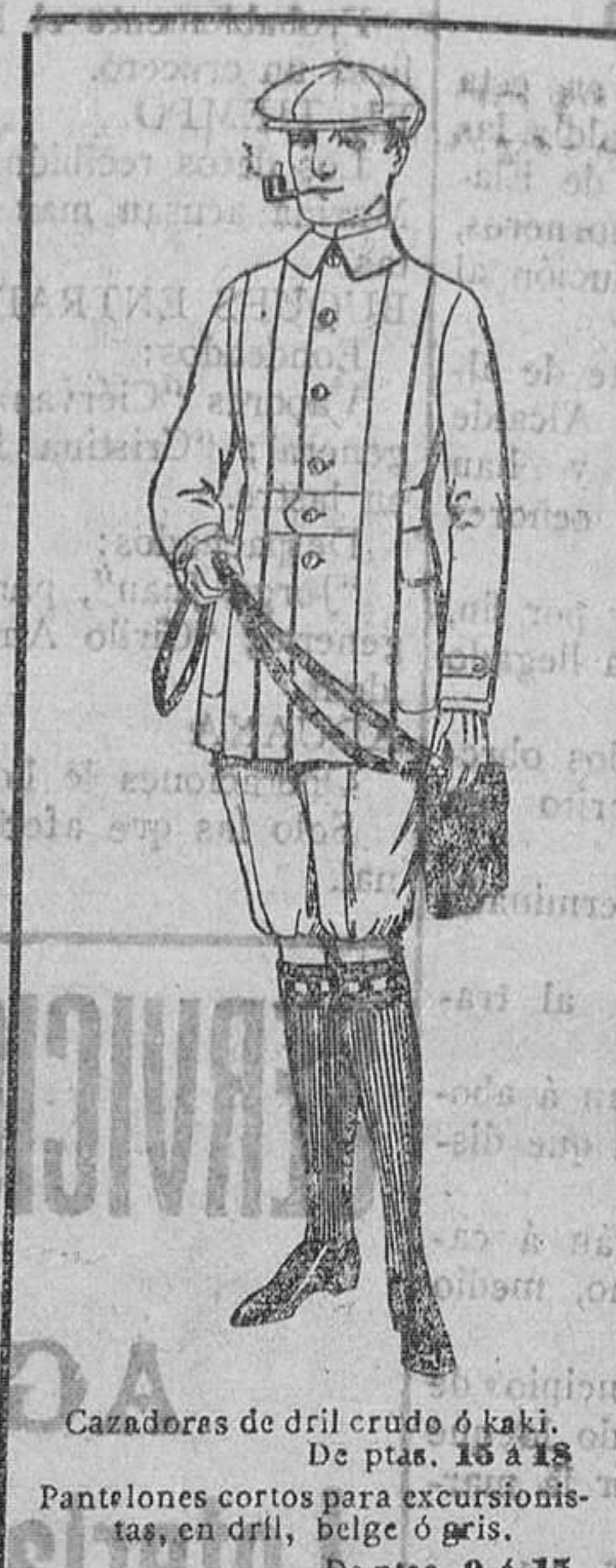
Camiseros de dril crudo ó kaki. De ptas. 15 á 18. Pantalones cortos para excursionistas, en dril, bulge ó gris. De ptas. 14 á 15.