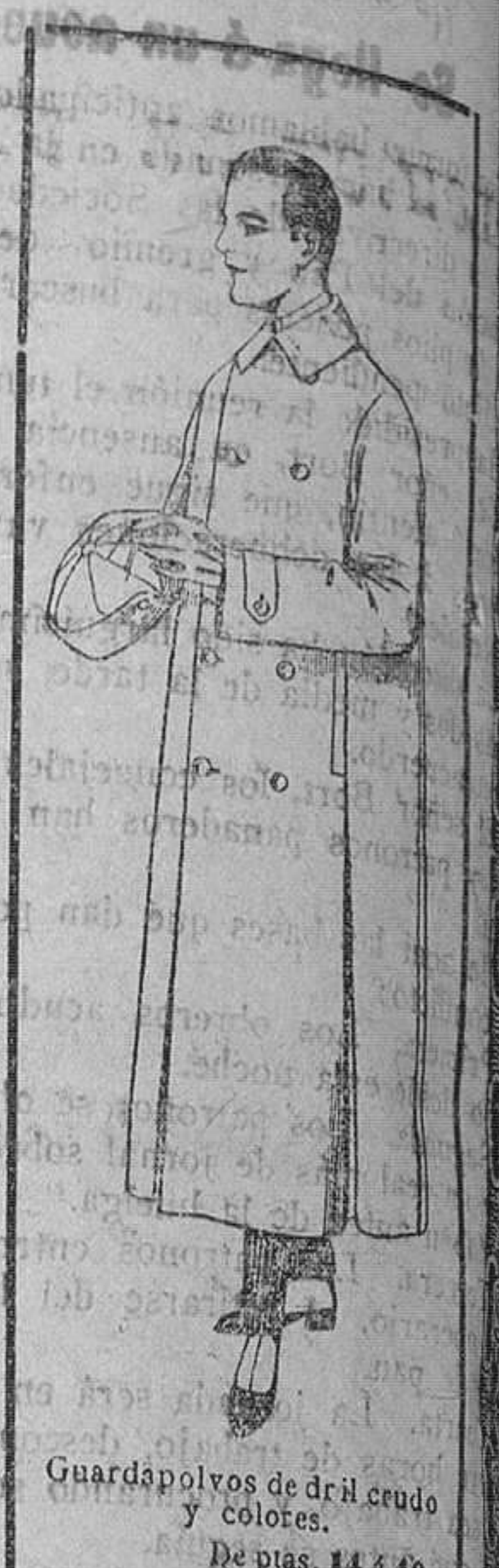
Guardapolvos de dril crudo y colores. De ptas. 14 á 16.