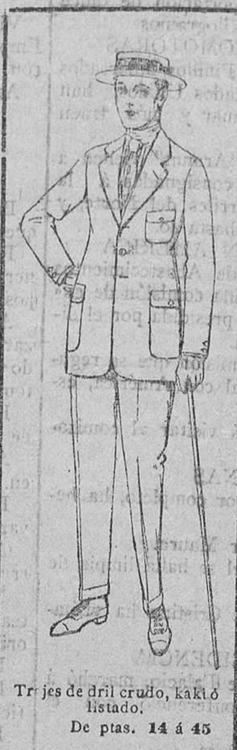
Trajes de dril crudo, kaki ó listado. De ptas. 14 á 45.