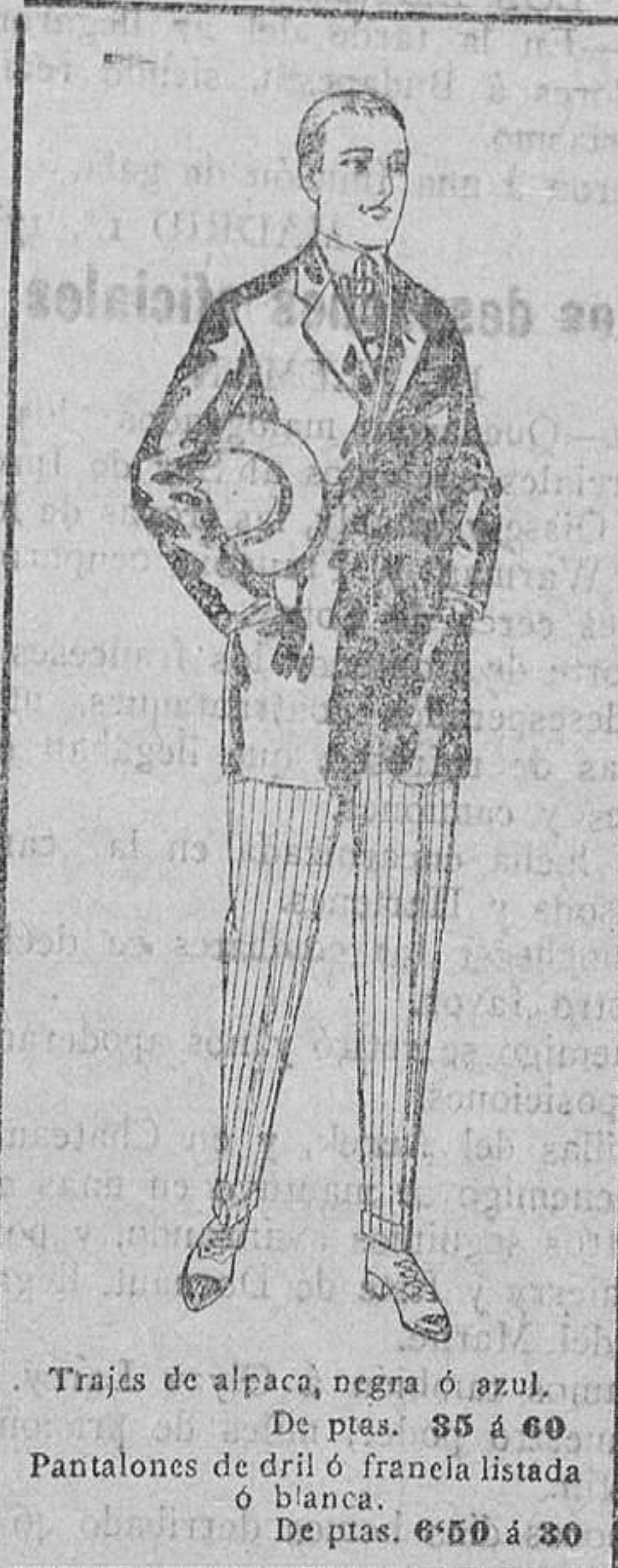
Trajes de alpaca, negra ó azul. De ptas. 35 á 60. Pantalones de dril ó franela listada ó blanca. De ptas. 6.50 á 20.

SUCURSALES: Madrid - Barcelona - Alicante - Almeria - Bilbao - Cadiz - Cartagena - Gijon - Granada - Malaga - Palma de Mallorca - Santander - Sevilla - Valladolid - Zaragoza.