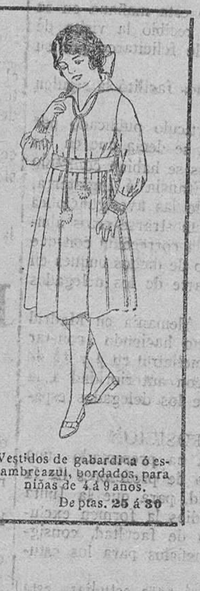
Vestidos de gabardina ó estambre, bordados para niñas de 4 á 9 años. De ptas. 25 á 30.