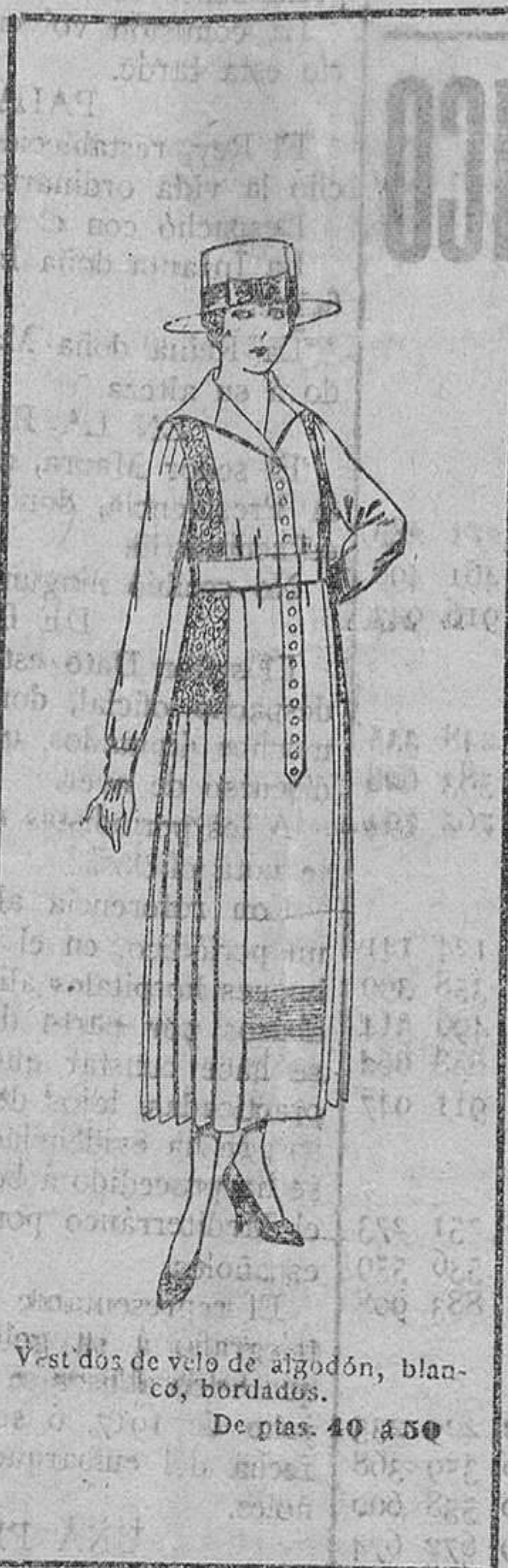
Vestidos de velo de algodón, blancos, bordados. De ptas. 40 á 50.

Ropas confeccionadas para caballero, señora, niño y niña.