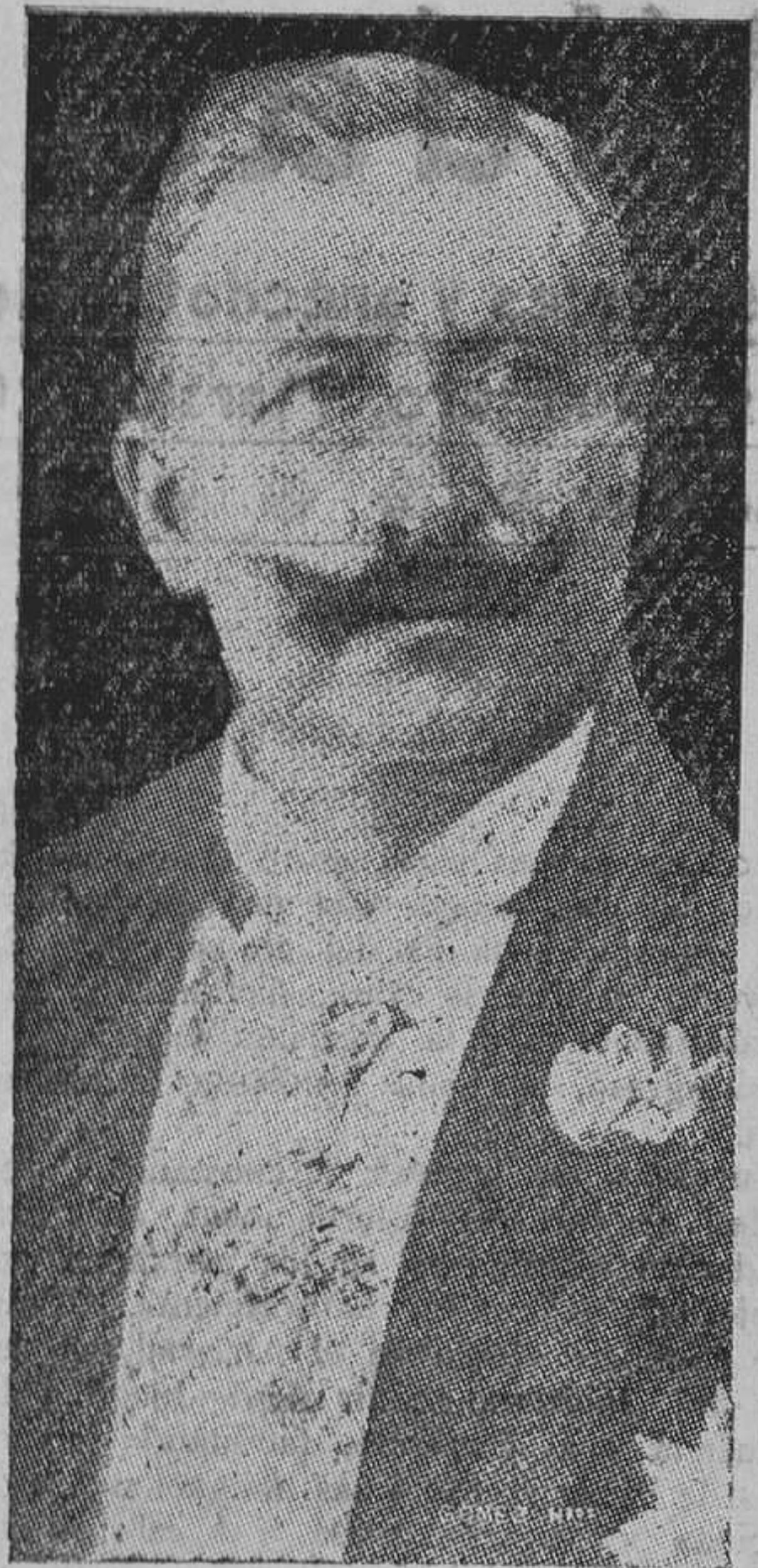
Guillermo II Emperador de Alemania

Han pasado los tiempos en que las naciones luchaban por altos ideales. Hoy, el materialismo se ha enseñoreado de los pueblos, y éstos se arman y se mueven y se pelean, persiguiendo fines de índole distinta, siendo el principal objeto de las guerras la posesión y la defensa de intereses materiales, y por medio de las armas se busca el predominio y la hegemonía para colocar los productos en nuevos mercados, para dar salida al exceso de población, para acaparar riquezas, para conquistar el vellocino de oro.