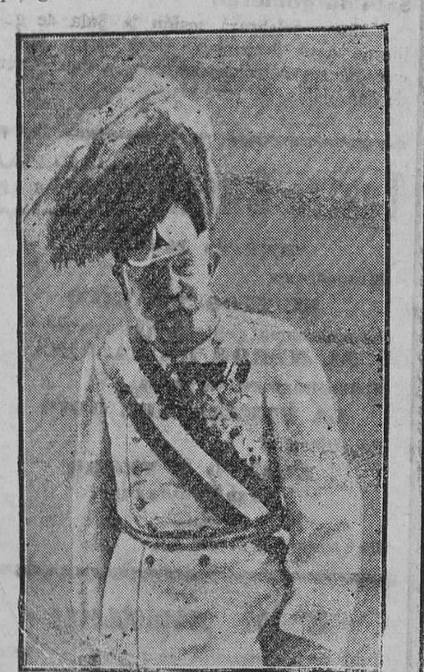
Francisco José I Emperador de Austria-Hungria

Lieja es una ciudad belga situada á 90 kilómetros de Bruselas, en la confluencia de los ríos Meuse y Ourthe. Tiene 170.000 habitantes. Es plaza fuerte y una de las más importantes ciudades industriales de Europa, gracias á las minas de carbón y meta-