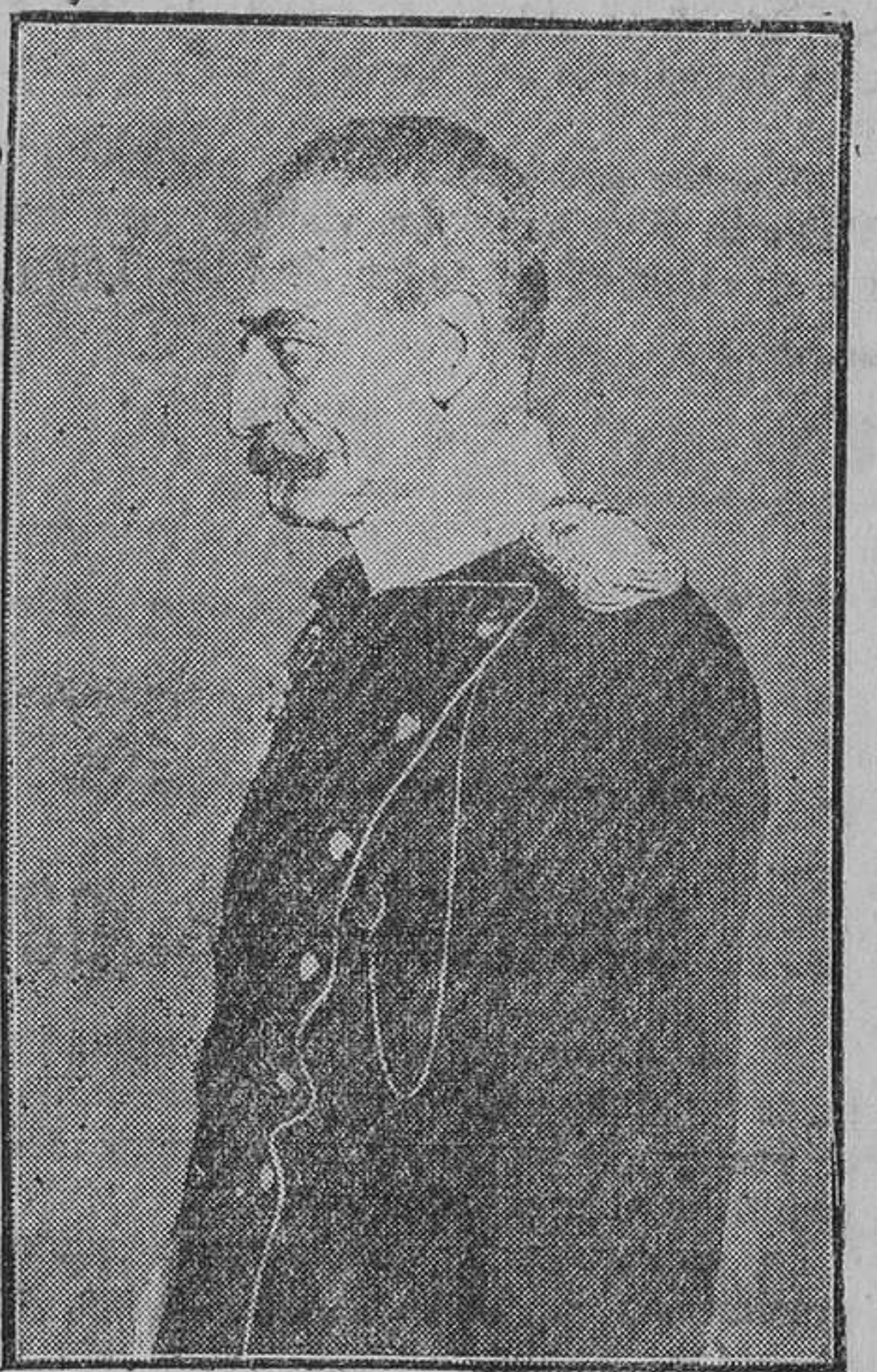
Pedro I Rey de Serbia

A pesar de este fuego granadeo, los alemanes avanzaban, siempre á campo abierto y dando el pecho y batiéndose furiosamente; de nuevo la victoria parecía declararse en su favor.