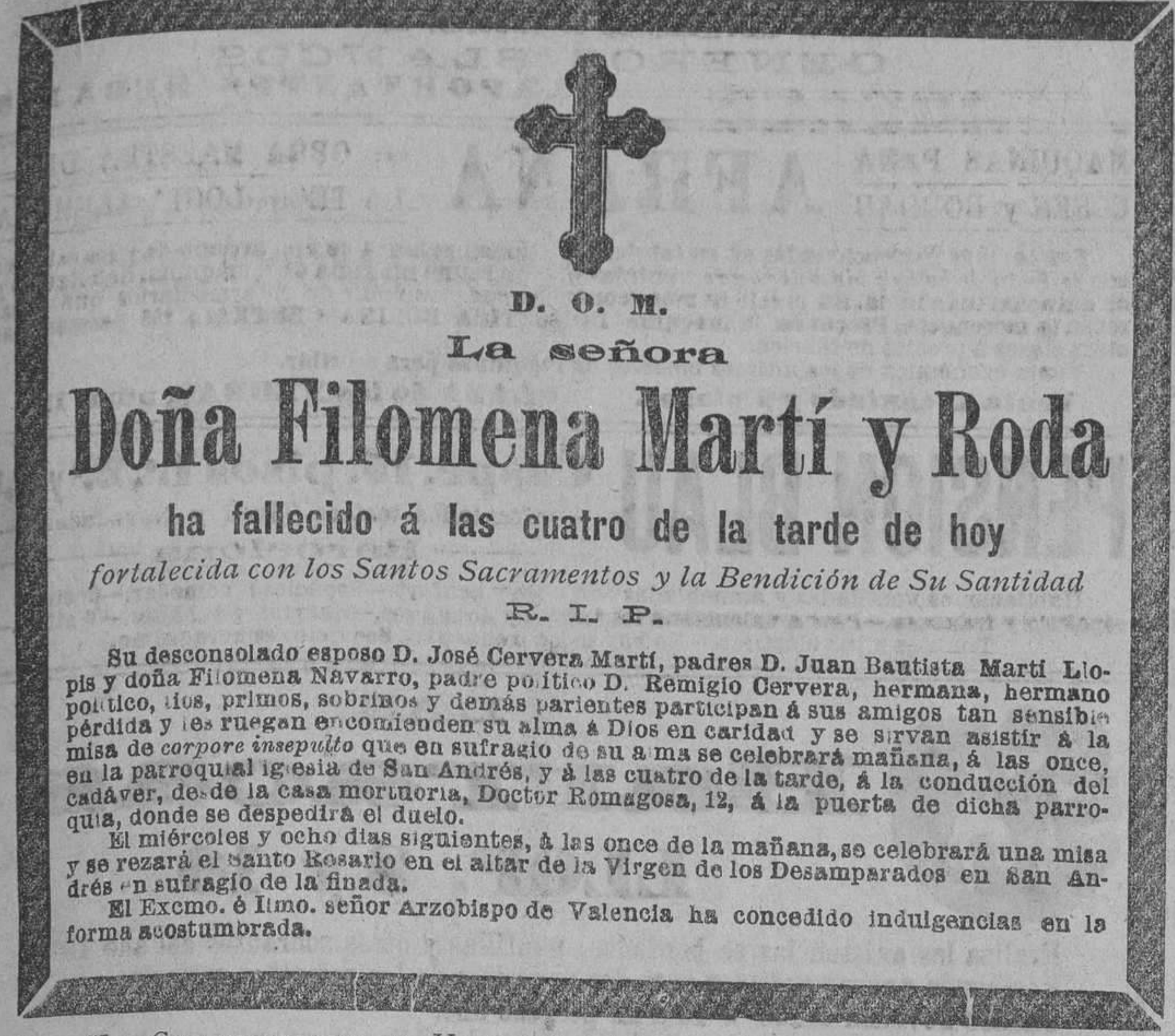
Para "La Correspondencia de Valencia"