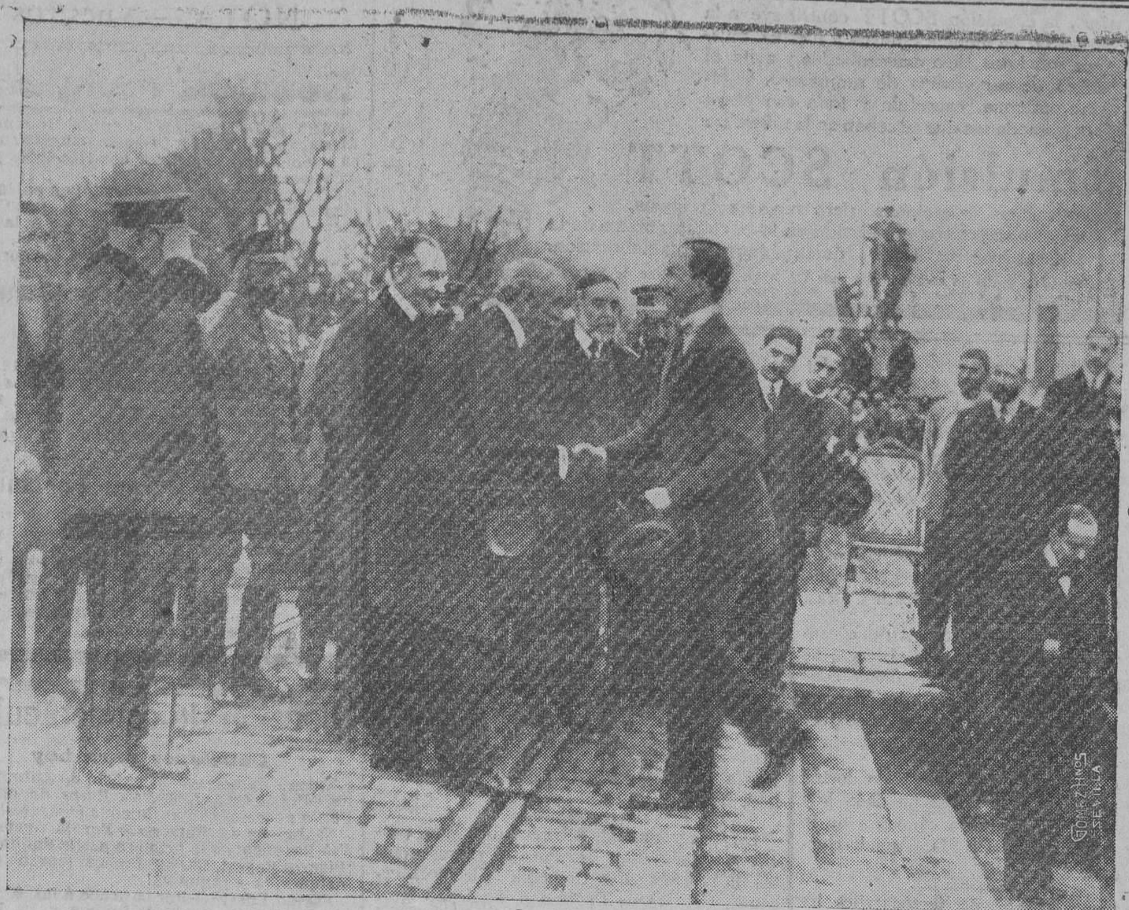
El Rey á su llegada á Sevilla, después de la cacería en el coto Doñana

habiendo recibido los Santos Sacramentos y la Bendición de Su Santidad R. I. P. Su director espiritual, sobrinos, primos y demás parientes ruegan á sus amigos la encomiendan á Dios y se sirvan asistir á funeral que por el eterno descanso de su alma se celebrará mañana, viernes 13, á las once, en la parroquia de San Pedro, de la Metropolitana Basílica, por cuyo favor quedarán agradecidos. El duelo se despidió en la iglesia. El Camarín de la Real Capilla de Nuestra Señora de los Desamparados en sufragio de la finada. Todas las misas que se celebrarán el día 16 de los corrientes en la parroquia iglesia de San Lorenzo de la villa de Alberique y los novenarios de misas y Rosario que en las siete del mismo día en el de las Religiosas Oblatas de la calle de Jardines y el día de siete y Rosario que durante el año se celebrará en el convento de Franciscanas de la calle del Arzobispo Mayoral, serán también á intención de la finada. El Excmo. y Rvdmo. señor Arzobispo de esta archidiócesis se ha dignado conceder indulgencias en la forma acostumbrada.