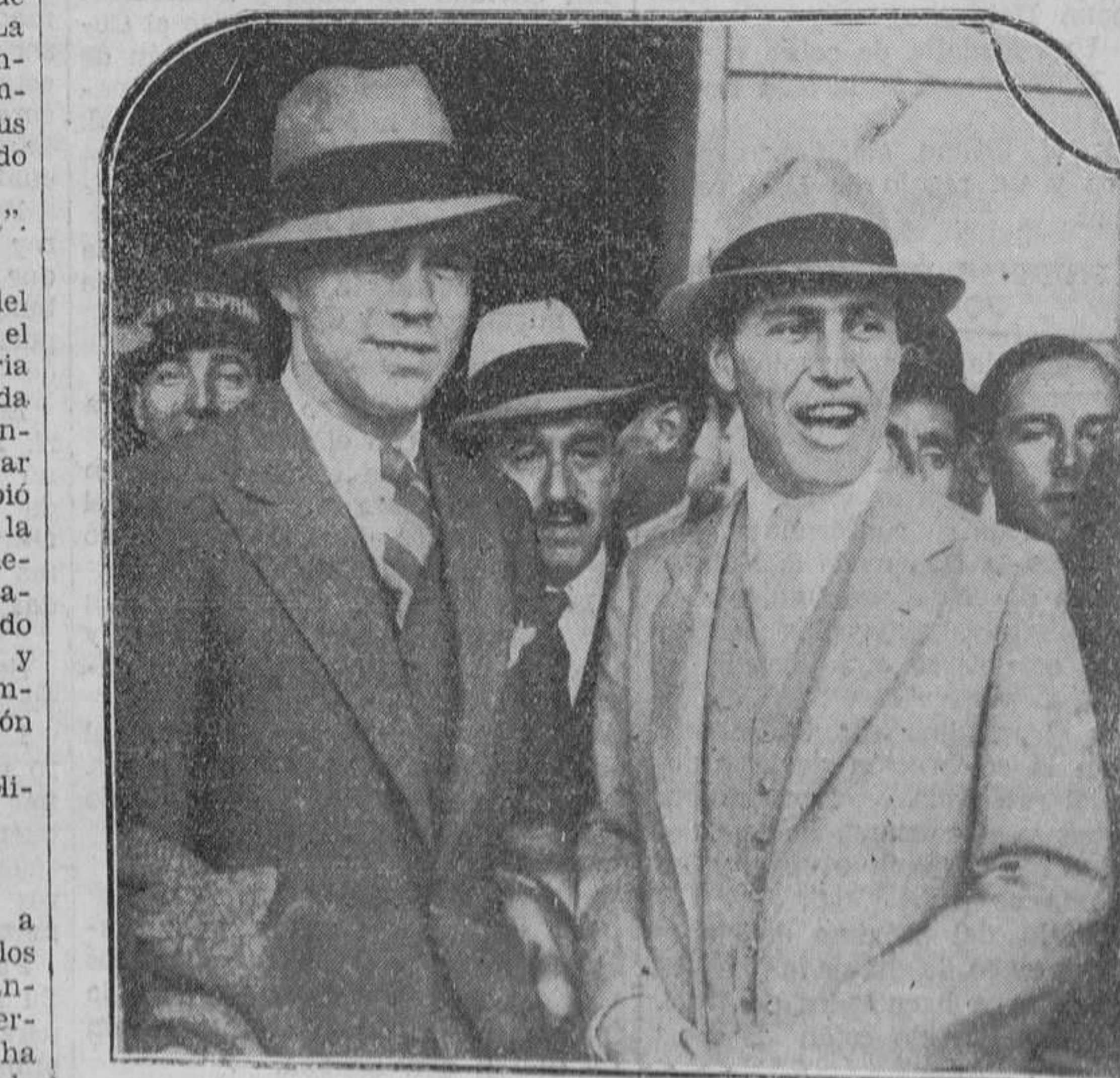
¿A QUE HABRA VENIDO ESTE A BARCELONA?—Este es Schmelling, el teuton, campeón del mundo, al que, por lo visto, interesa el match entre el mastodonte fascista y el "toro de los Pirineos". A su lado, la risa de "comboy" de Dickson, el "vareador" de bolsos americanos.

Bilbao.—El entrenador nacional ha hecho manifestaciones sobre el equi-