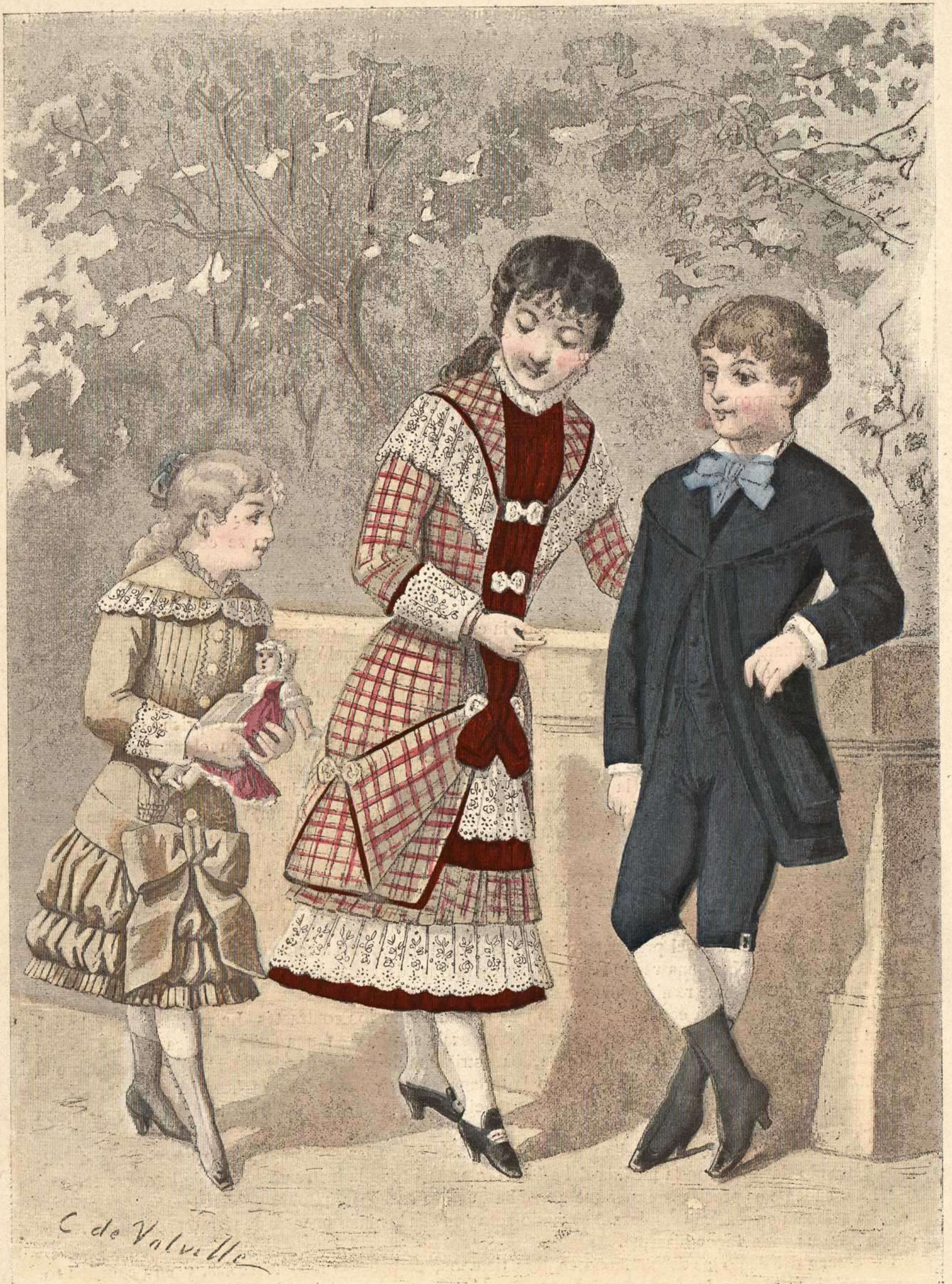
287. Jovencita de 5 á 7 años. — 288. Traje para grande. — 289. Traje para jovencito.