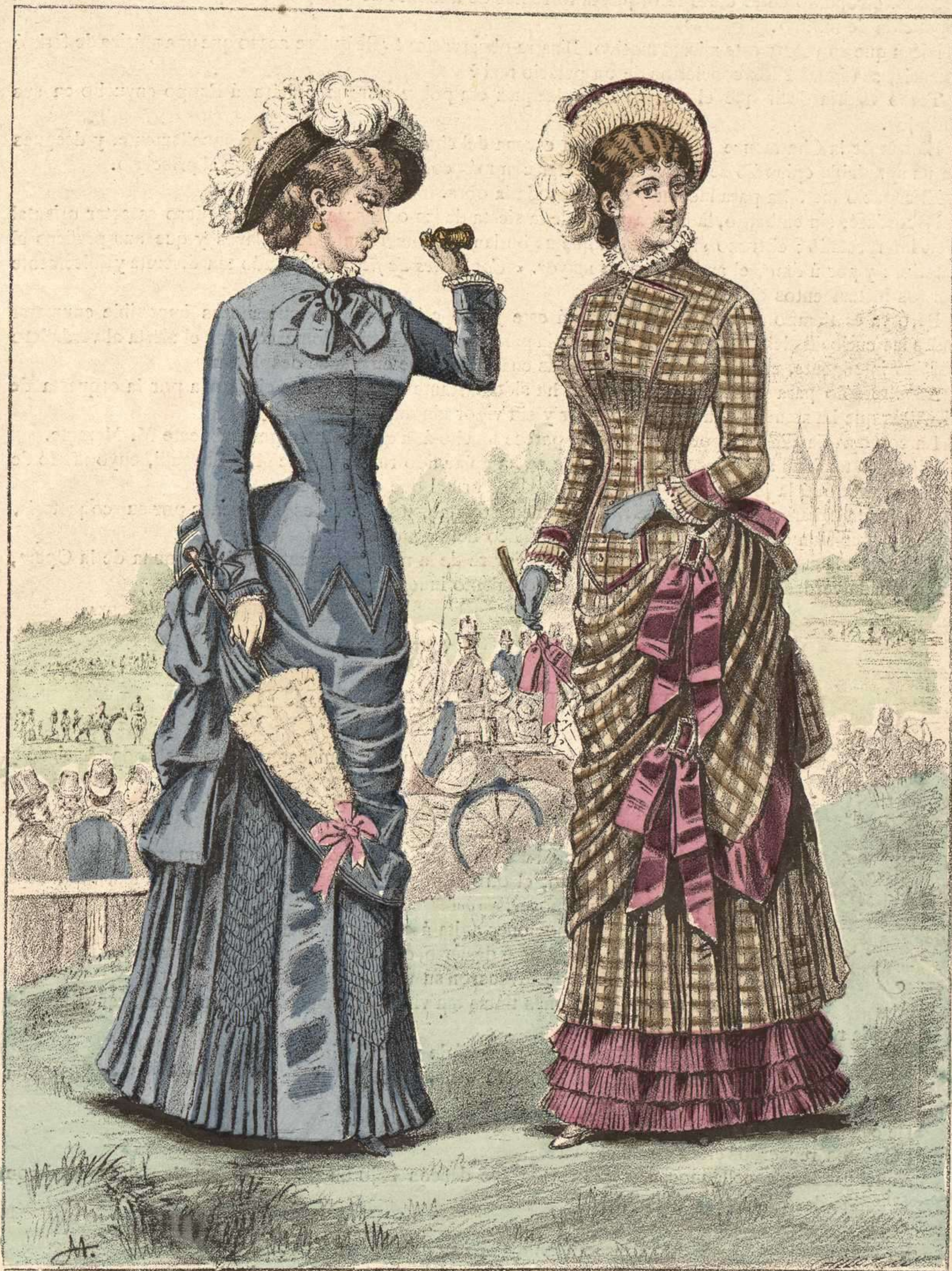
290. Traje para paseo. — 291. Vestido de lana y faya.