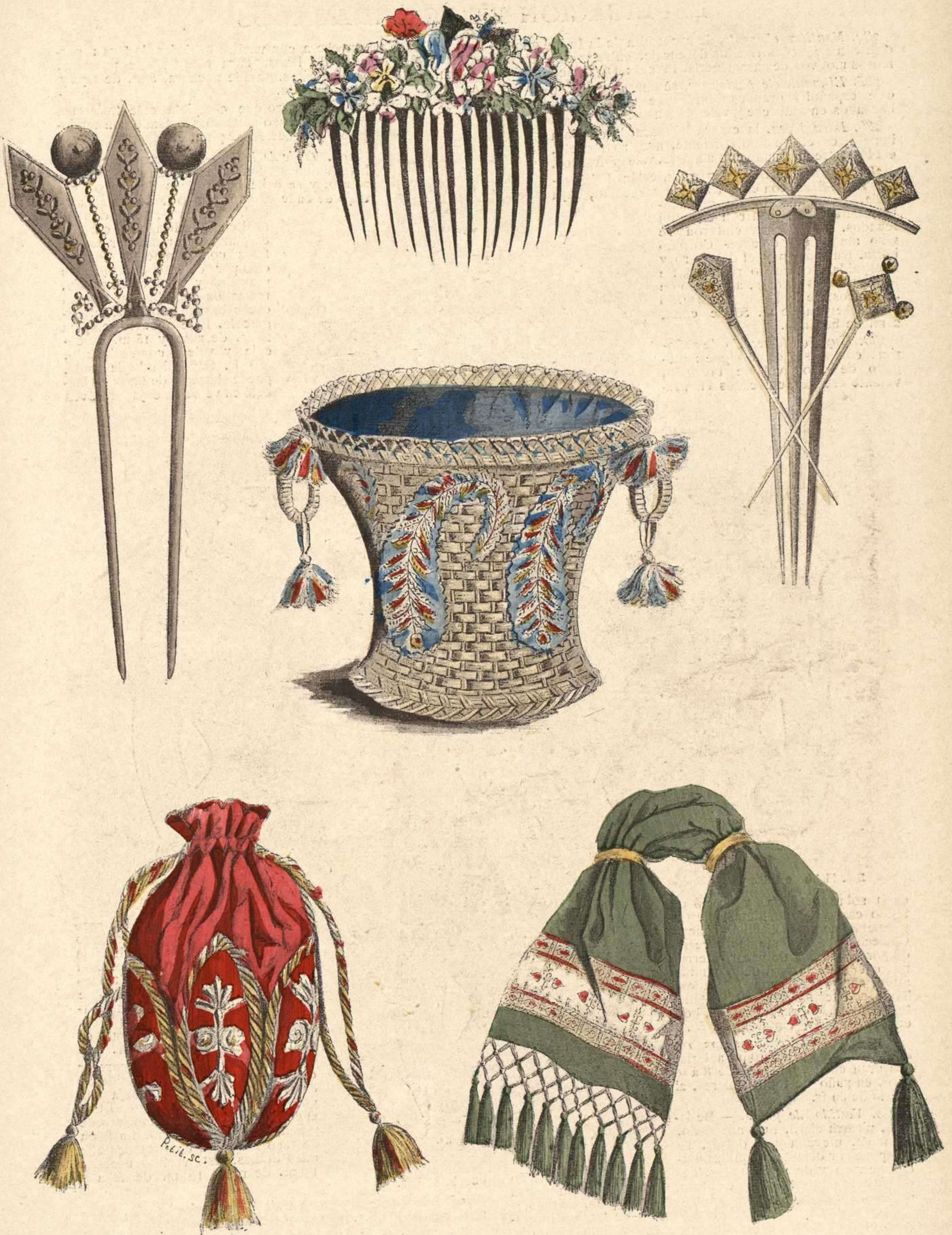
303. Peineta de concha. — 304. Peineta de flores. — 305. Peine y alfileres de plata cincelada. 306. Cestillo para oficina. — 307. Bolsa para el tabaco. — 308. Saco para la labor.