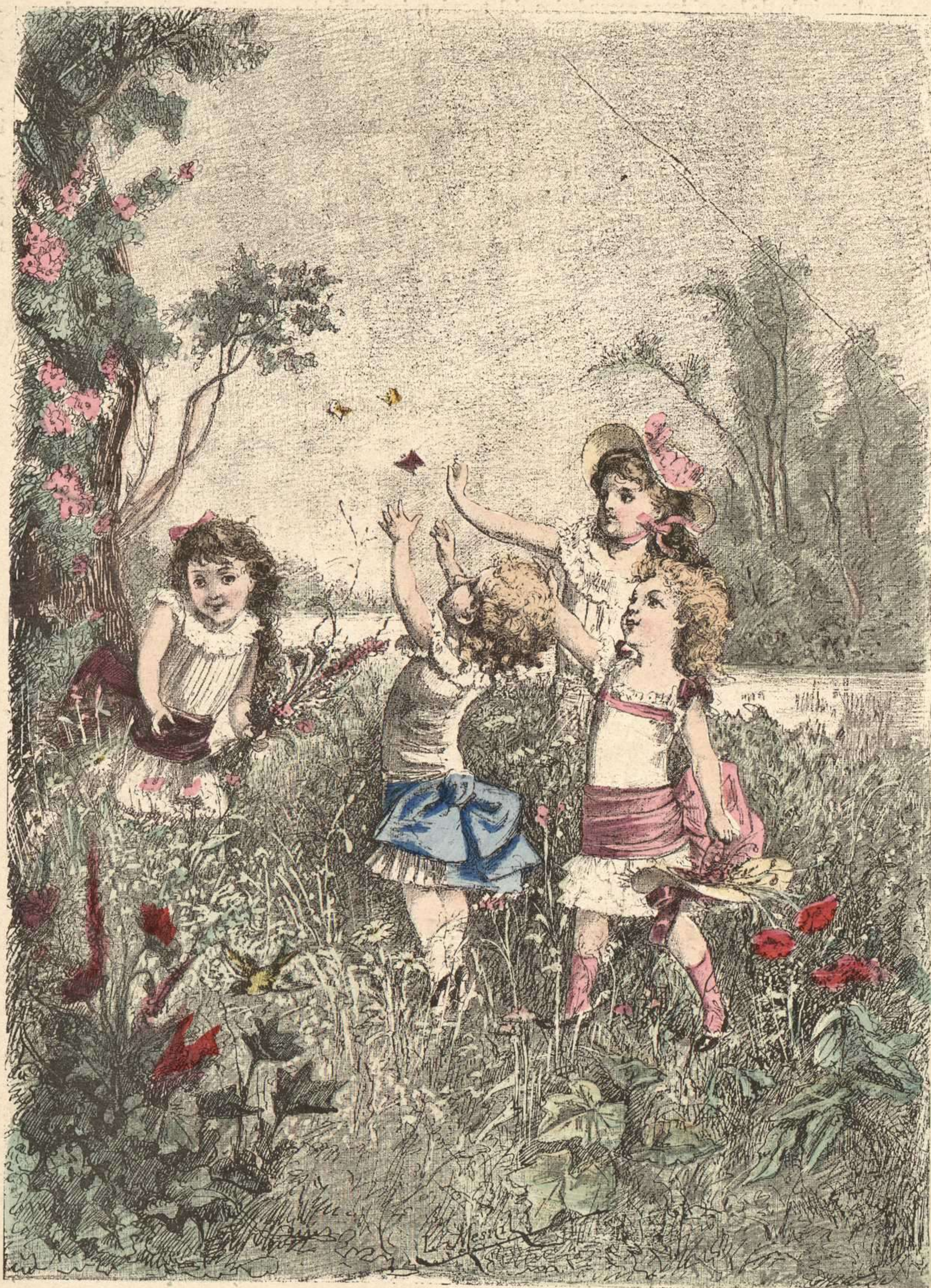
295. Niño de 4 años. — 296. Vestidito de pique. — 297. Vestidito de nansú. 298. Trajecito para jovencita muy niña.