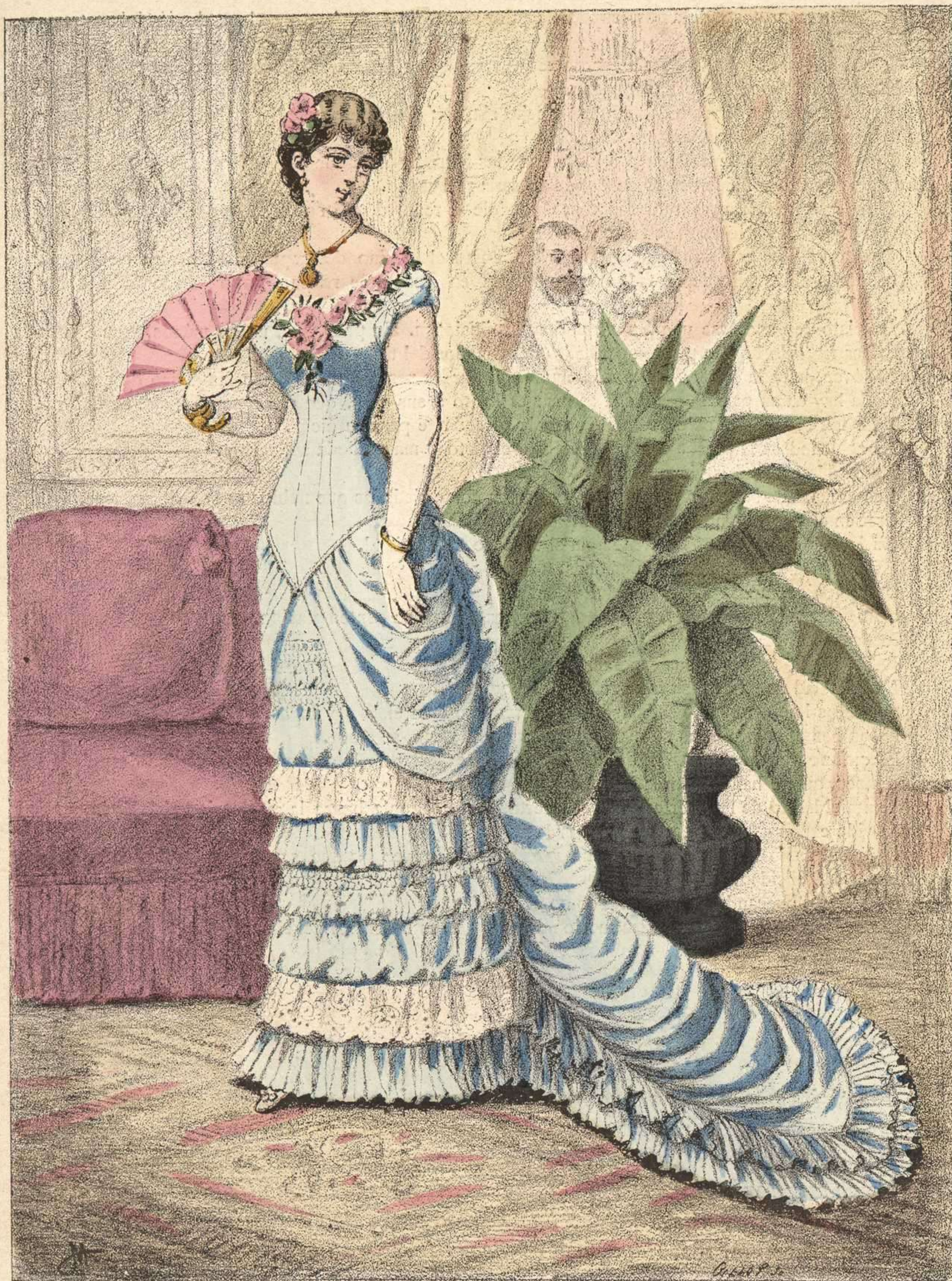
292. Traje para baile.