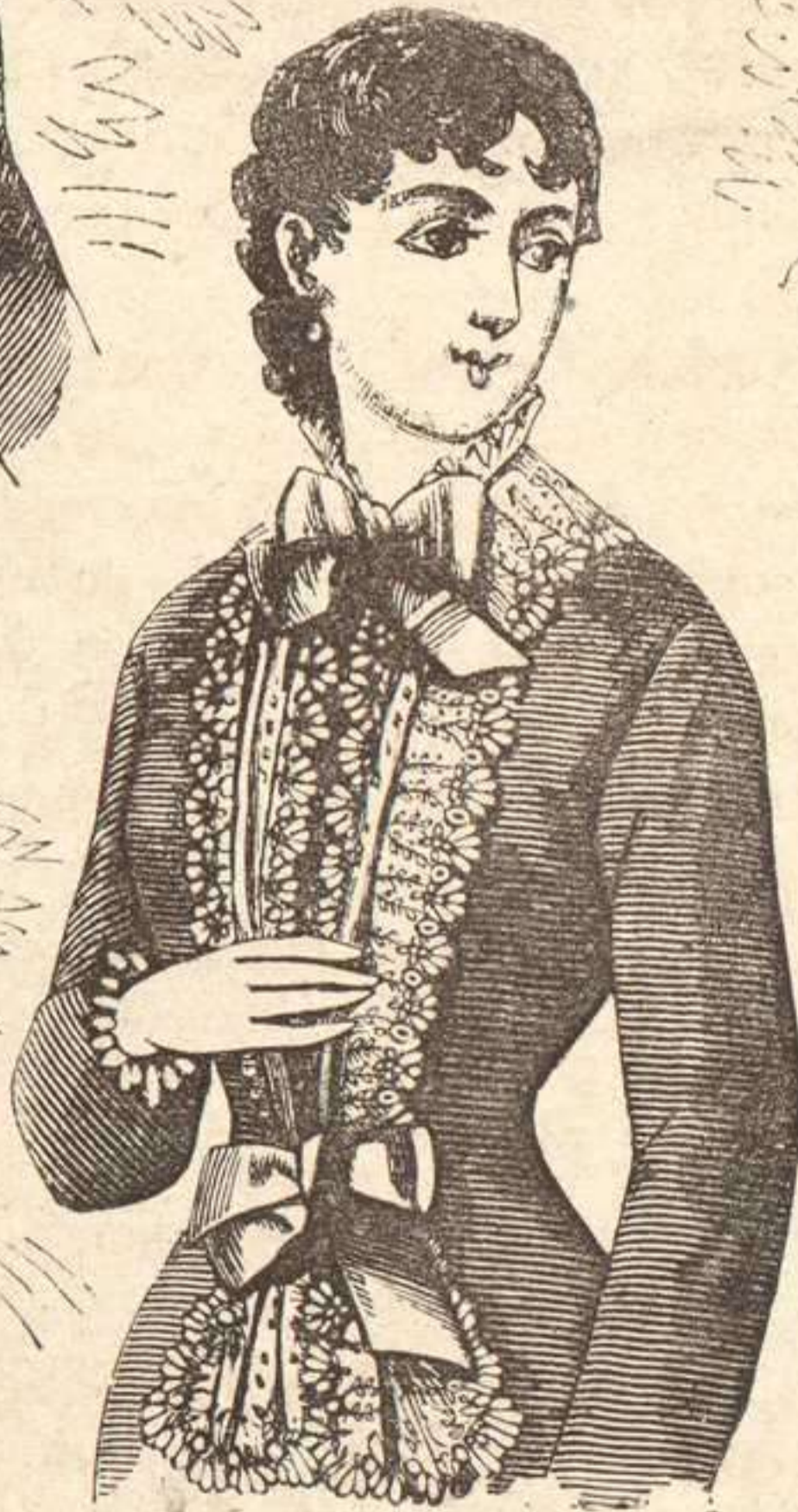
292. Chaleco de encaje Palermo

291. Este lindo vestido de señorita , de lanilla á cuadritos, habana y tostado, se completa con una falda, guarnecida de tres plegados de faya carubié. Grandes lazos de faya con hebillas, apanando la túnica ribeteada con faya. El cuerpo va