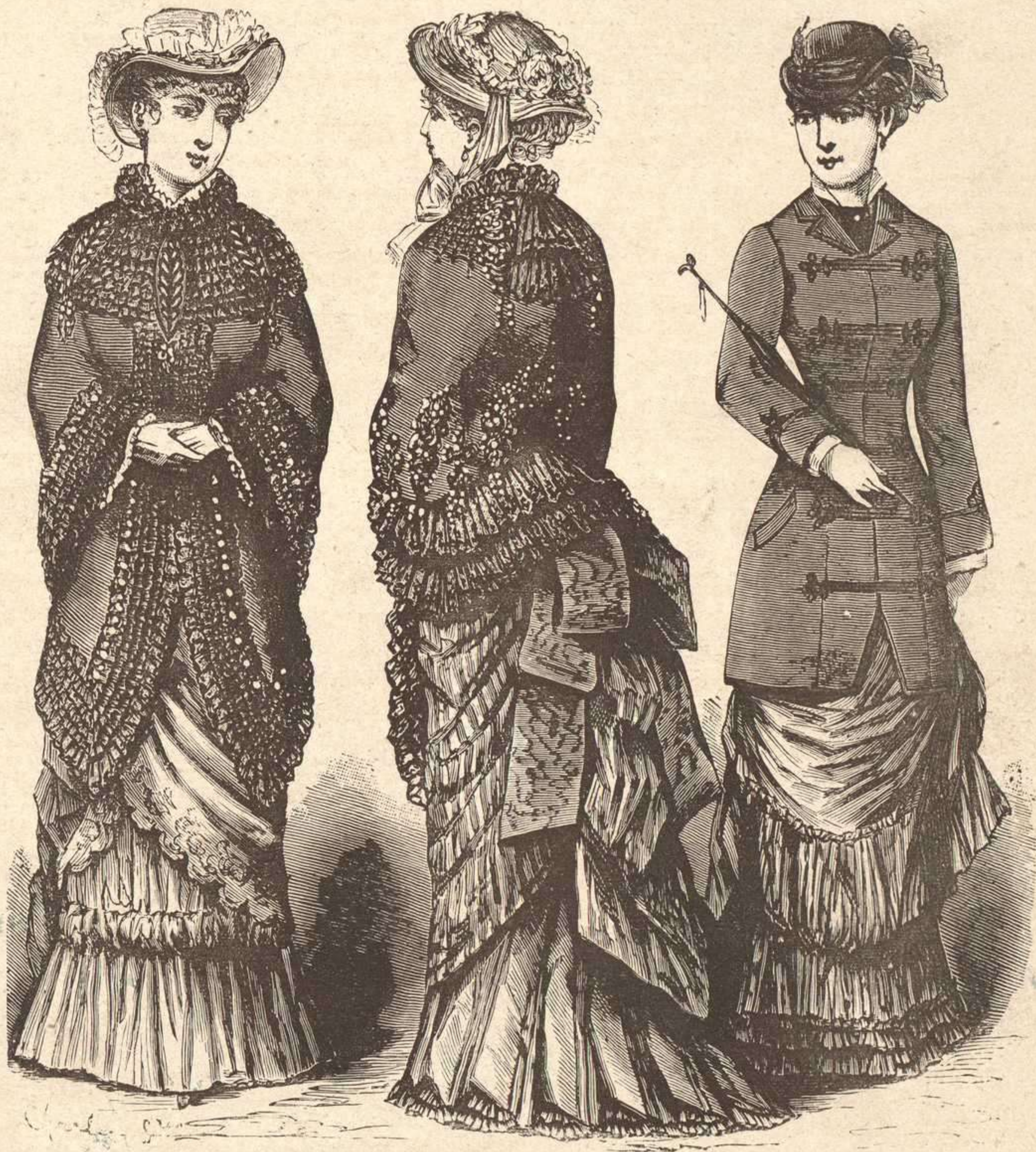
284. Mantilla elegante. — 285. Mantelete Parisien. — 286. Casaca Húngara.

Pasando al calzado debo confirmar la voga sostenida del zapato escotado. Cotorno rayado con lengüetas abiertas sobre el empeine, zapato Molière, copiado sobre los modelos de la época, zapato de cabrito, elegante, muy escotado, ó simple zapato derecho, lazada á la inglesa, todo se lleva, si bien no indiferentemente ; los unos pueden ir con los trages más elegantes ; los otros convienen sólo para las salidas matinales.