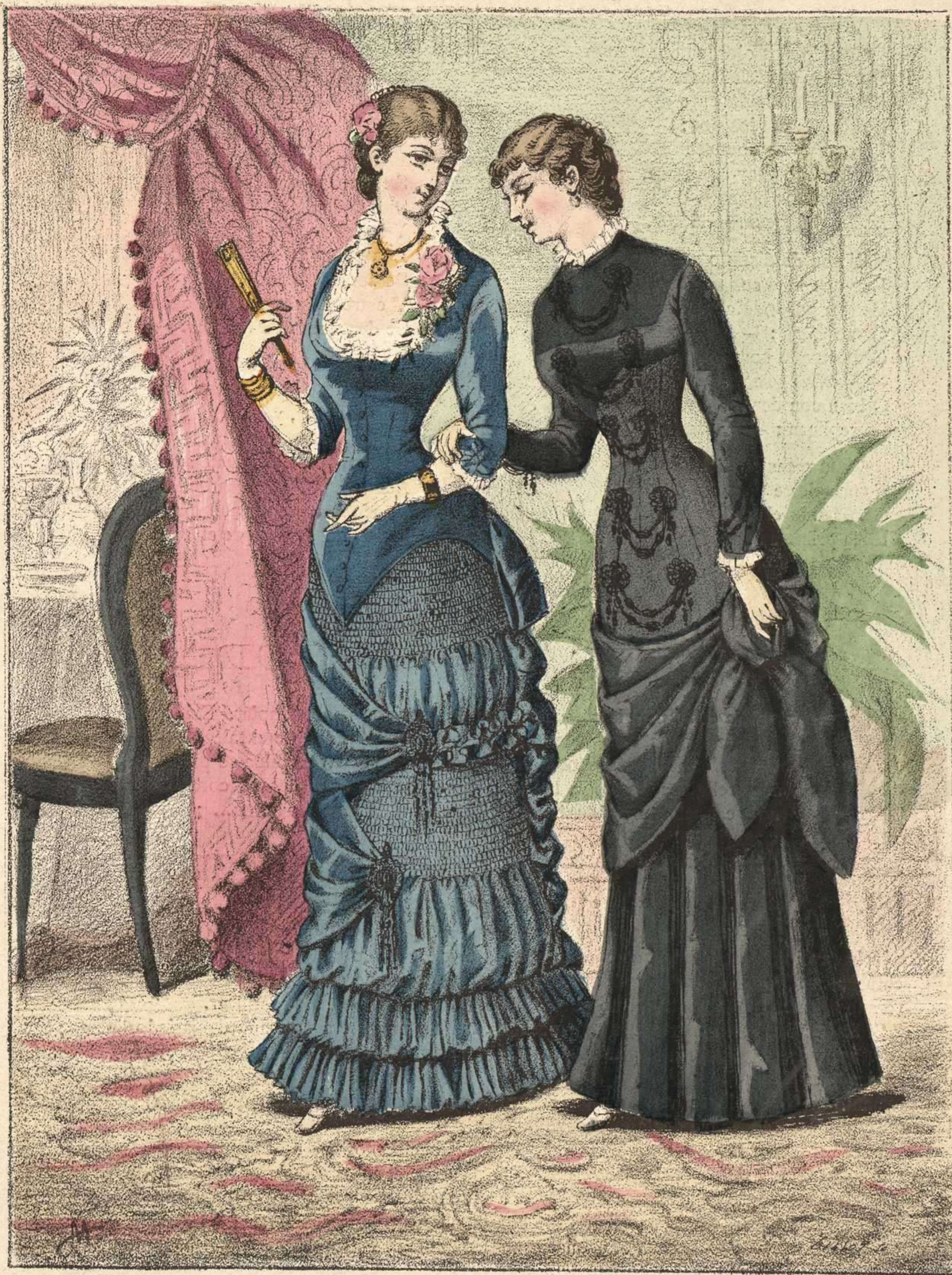
293. Traje para comida. — 294. Traje para casa.