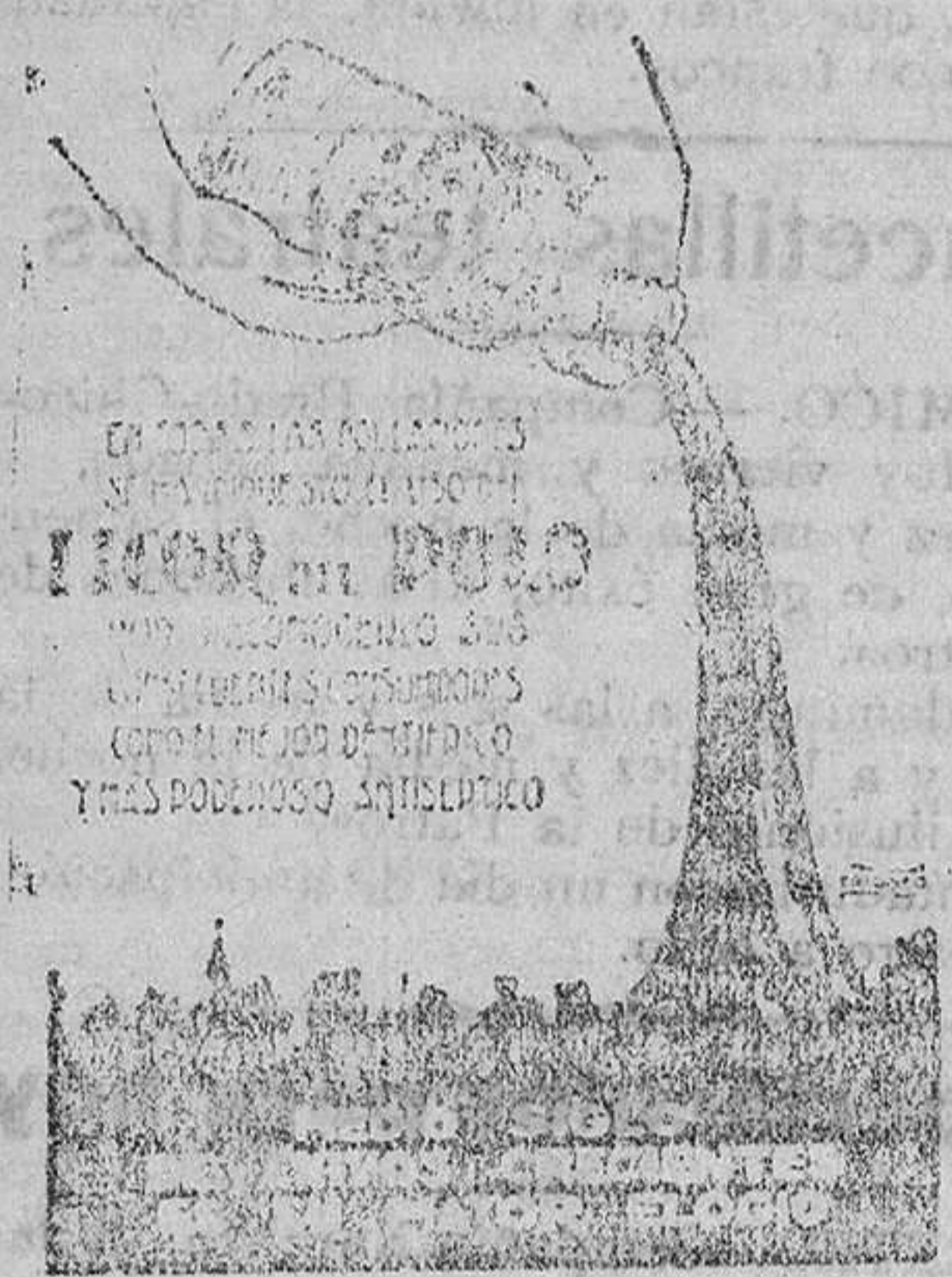
LIQUOR DE PURO CON SU CARACTERÍSTICO SABOR Y SU ESPECIAL CUALIDAD DE PURIFICACIÓN Y SU PODEROSO EFICACIA