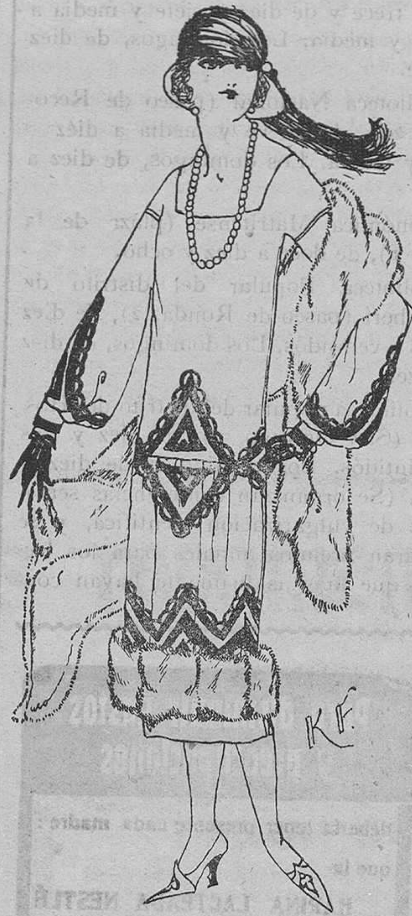
(Dibujo de K. F.)

to y práctico jersey rosa, para obsequio seguramente de algún necesitado.