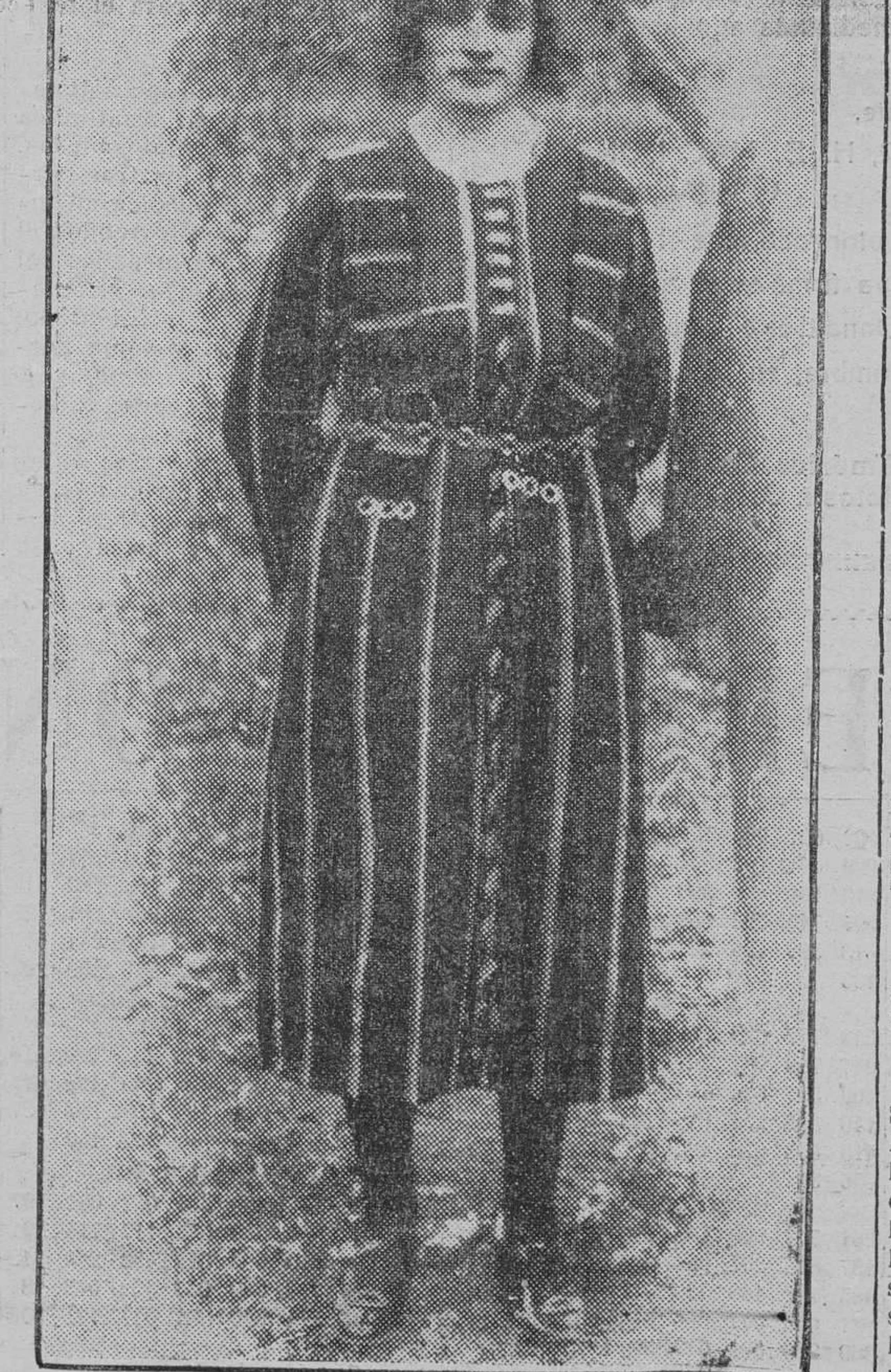
EL SUCESO ESCANDALOSO DE MORON DE LA FRONTERA

Unos vecinos de Morón vieron flotar en la superficie de las aguas del pozo fatídico una co-