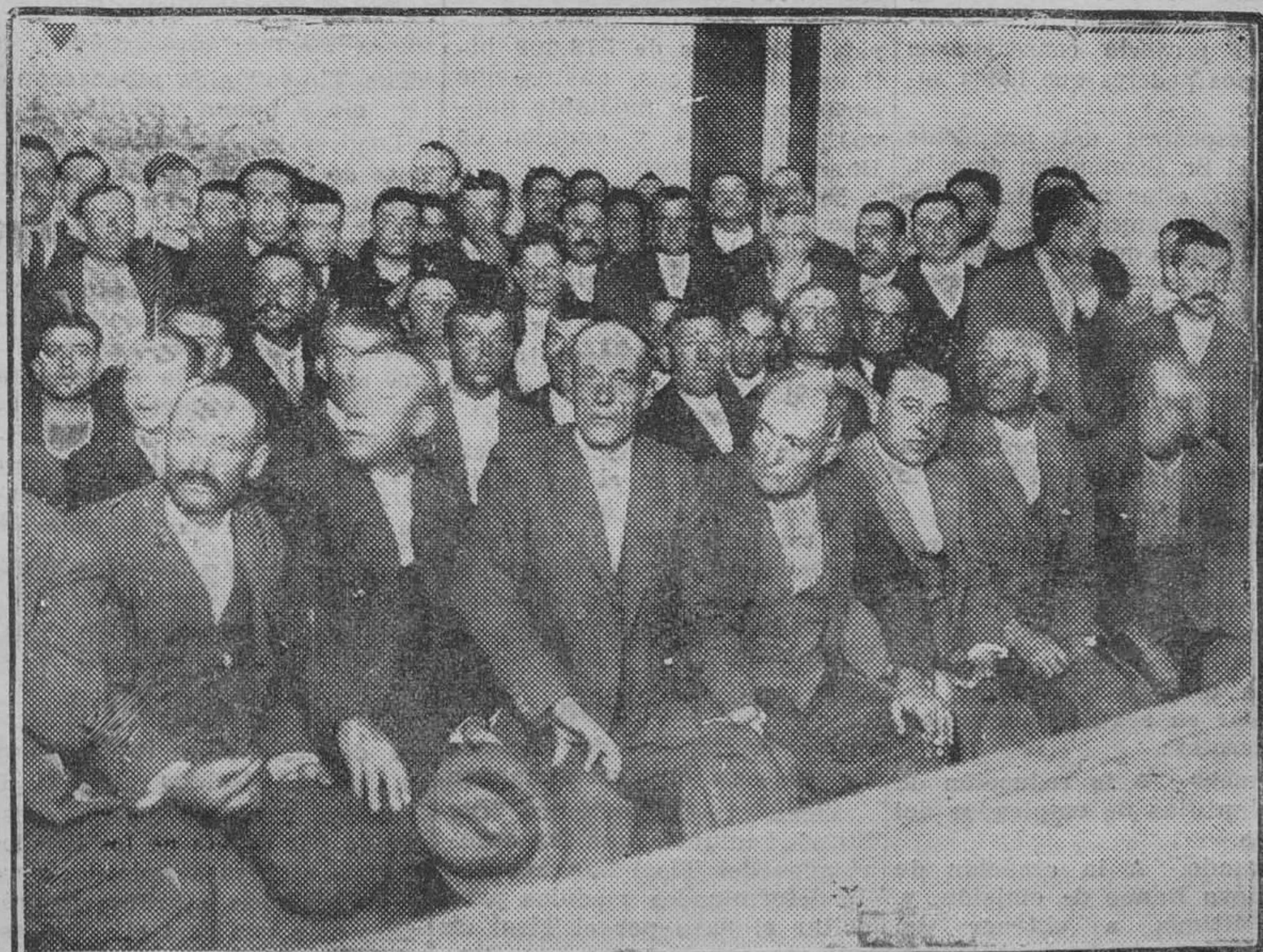
Agricultores y vendedores de la plaza de la Cebada, reunidos en la Tenencia de Alcaldía de La Latina para tratar de la baja de precios