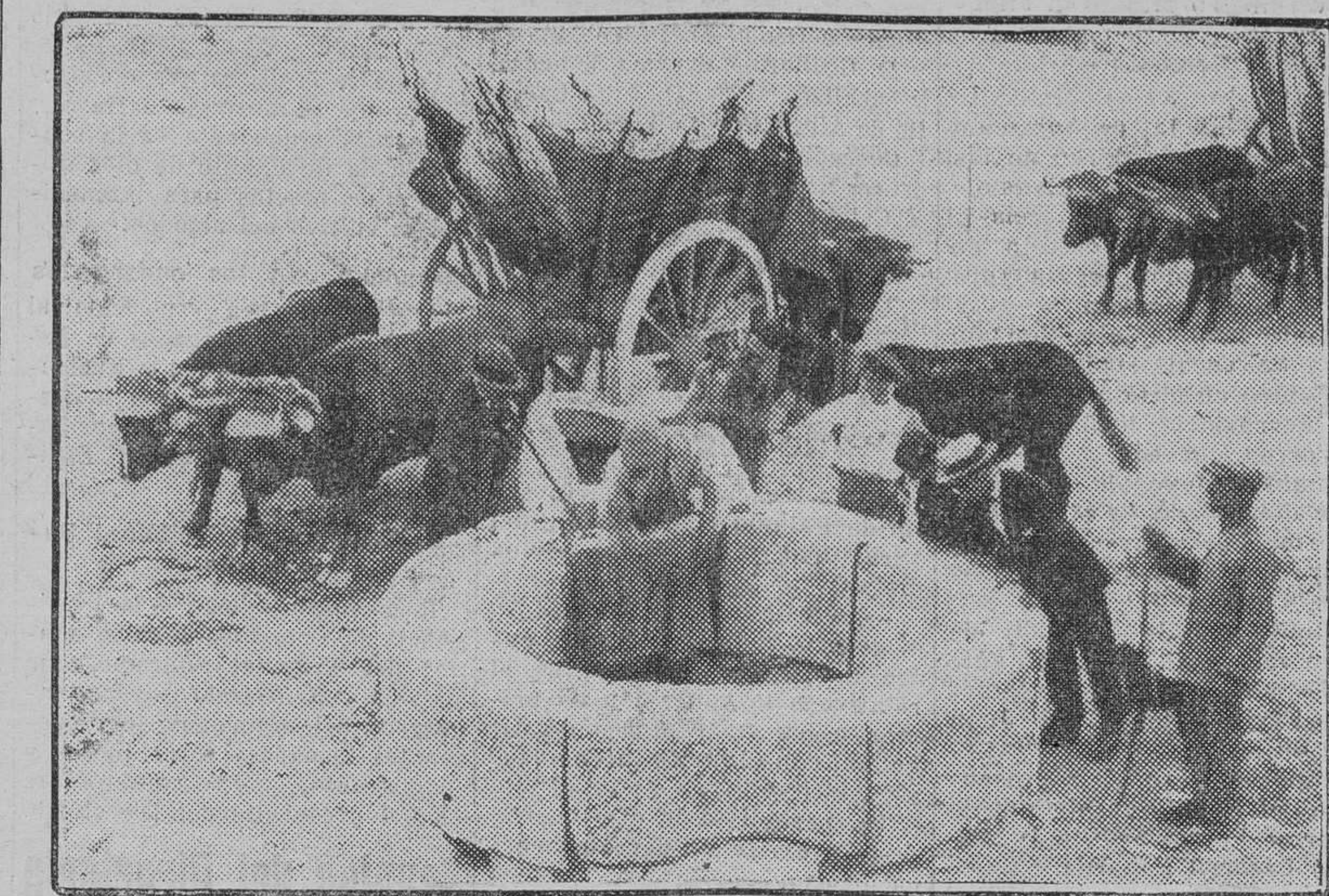
EL SUCESO ESCANDALOSO DE MORON DE LA FRONTERA

"Solidaridad Obrera" dice hoy, refiriéndose a este documento: "Los órganos de relación entre los trabajadores eran los Sindicatos. Al cerrarlos, al