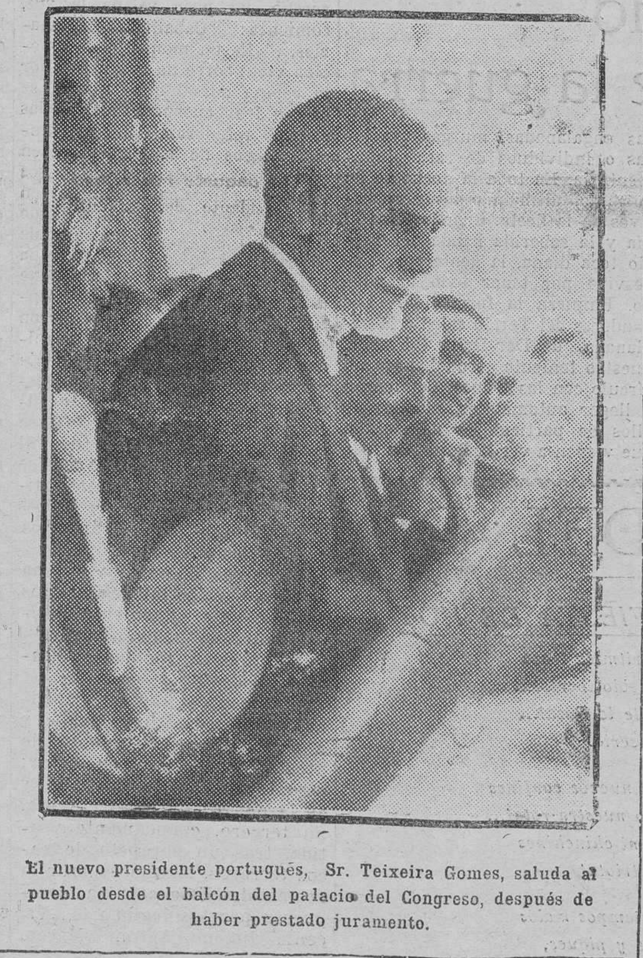
El nuevo presidente portugués, Sr. Teixeira Gomes, saluda al pueblo desde el balcón del palacio del Congreso, después de haber prestado juramento.

Se declara el estado de guerra en Katowitz. Breslau 11.—En la parte polaca de Alta Silesia se han declarado