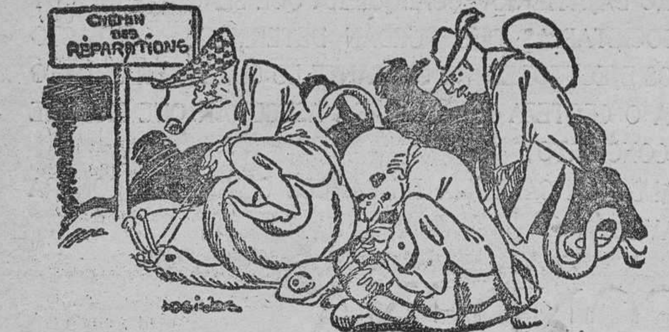
La Gues-ta de las Reparaciones tarda en subirse por la clase de cabalgaduras que unos y otros emplean. (L'Oeuvre, de París.)

No se ha podido aprobar en tercera lectura la ley que concede plenos poderes al Gobierno por la ausencia de los nacionalistas. Berlín 11.—El párrafo primero de la ley que concede plenos poderes al Gobierno ha sido aprobado, en tercera lectura y en vo-