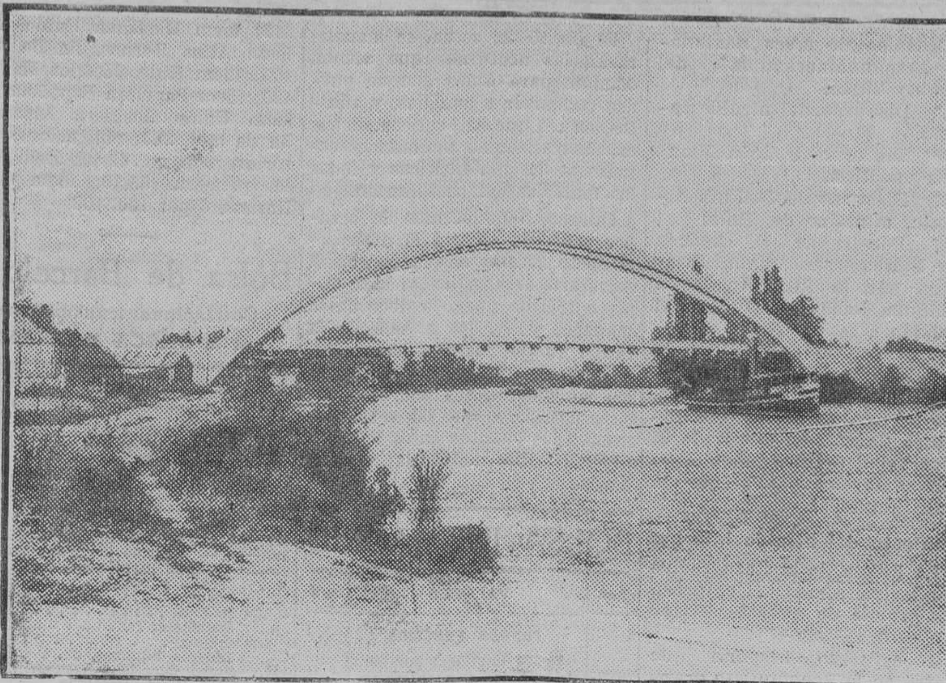
EL PUENTE DE CEMENTO ARMADO MAS GRANDE QUE SE CONOCE. Ha sido construido en Saint Pierre de Venoray (Francia)...