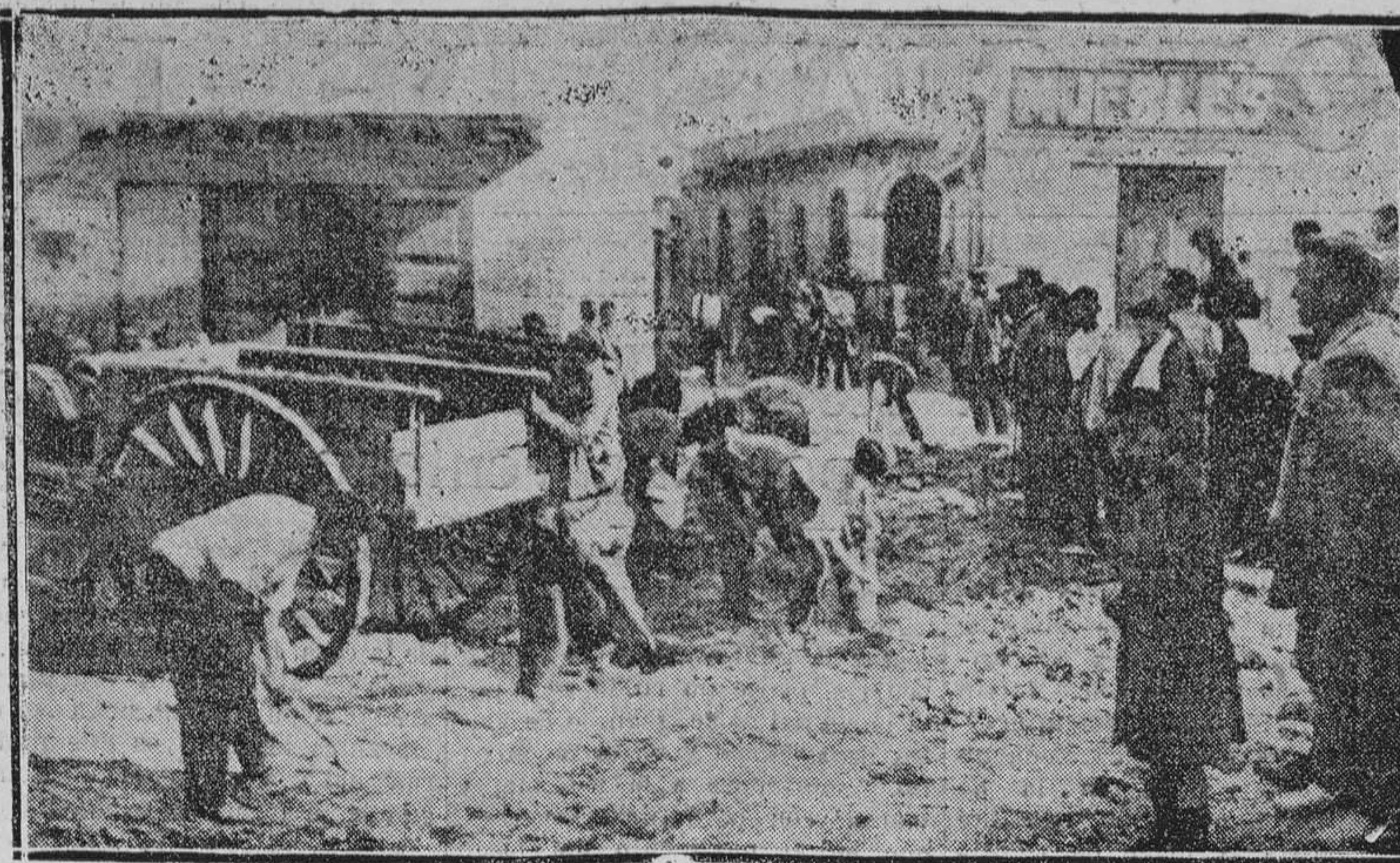
Destrozos causados en Calatayud.

rán plaza y están exentos del pago de derechos de examen."