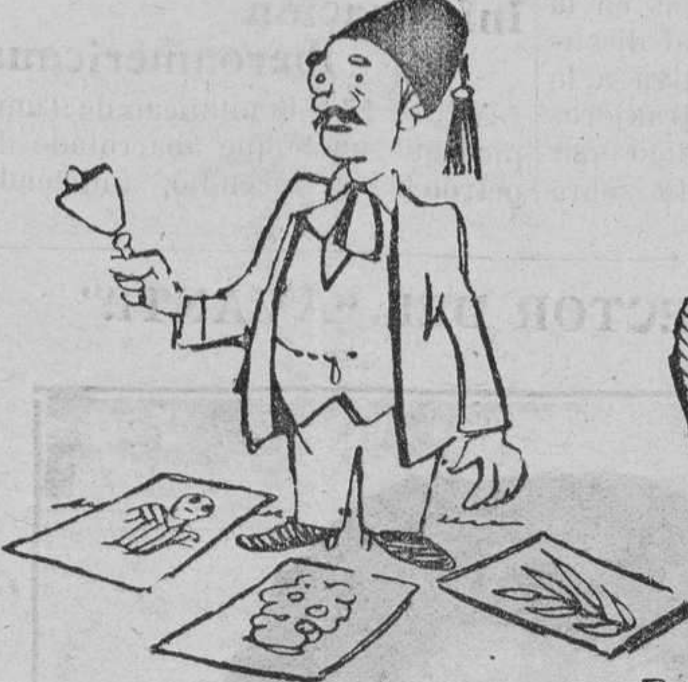
EL SACAMUELLAS.—¡Si sólo son dos minutos, no está mal!