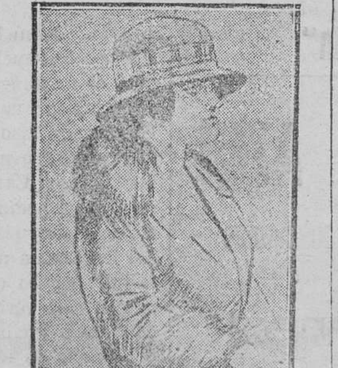
LA SENORA MARGARITA FAHMY. Segunda esposa y asesina del príncipa egipcio Ali bey Fahmy. La Prensa había dado equivocadamente el retrato de la primera esposa del príncipe, la cual se encuentra en Egipto.

Subsidiariamente, con el fin de conciliar los intereses opuestos, la Cámara de Comercio de Beaune propone que los derechos de entrada de los vinos extranjeros en Francia, derechos que figuran actualmente en la tarifa mínima de 24.50 hasta 42 grados, sean elevados a 30 francos por hectolitro hasta el grado 14 inclusive."