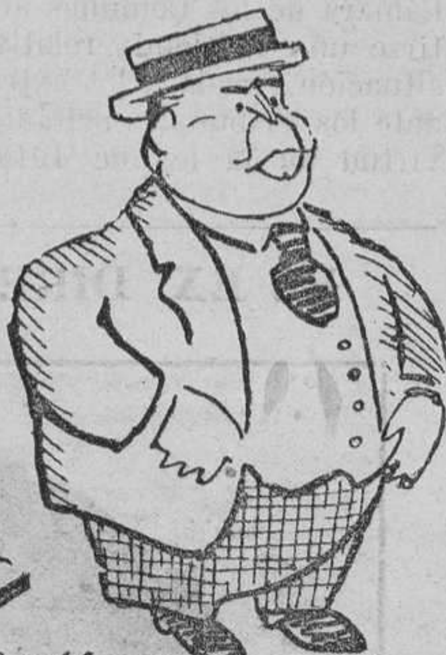
LA CIERVA.—Muy bien! ¡Para dos minutos, no; que no se vuelva a hablar de ellos!

aristócrata; pero no podrán prosperar frente a los del Estado y de la Villa, y malo es que se denuncien así, porque Madrid no sólo vería una injusticia en esa oposición para dejarle sin agua, sino la infracción de una obra de misericordia.