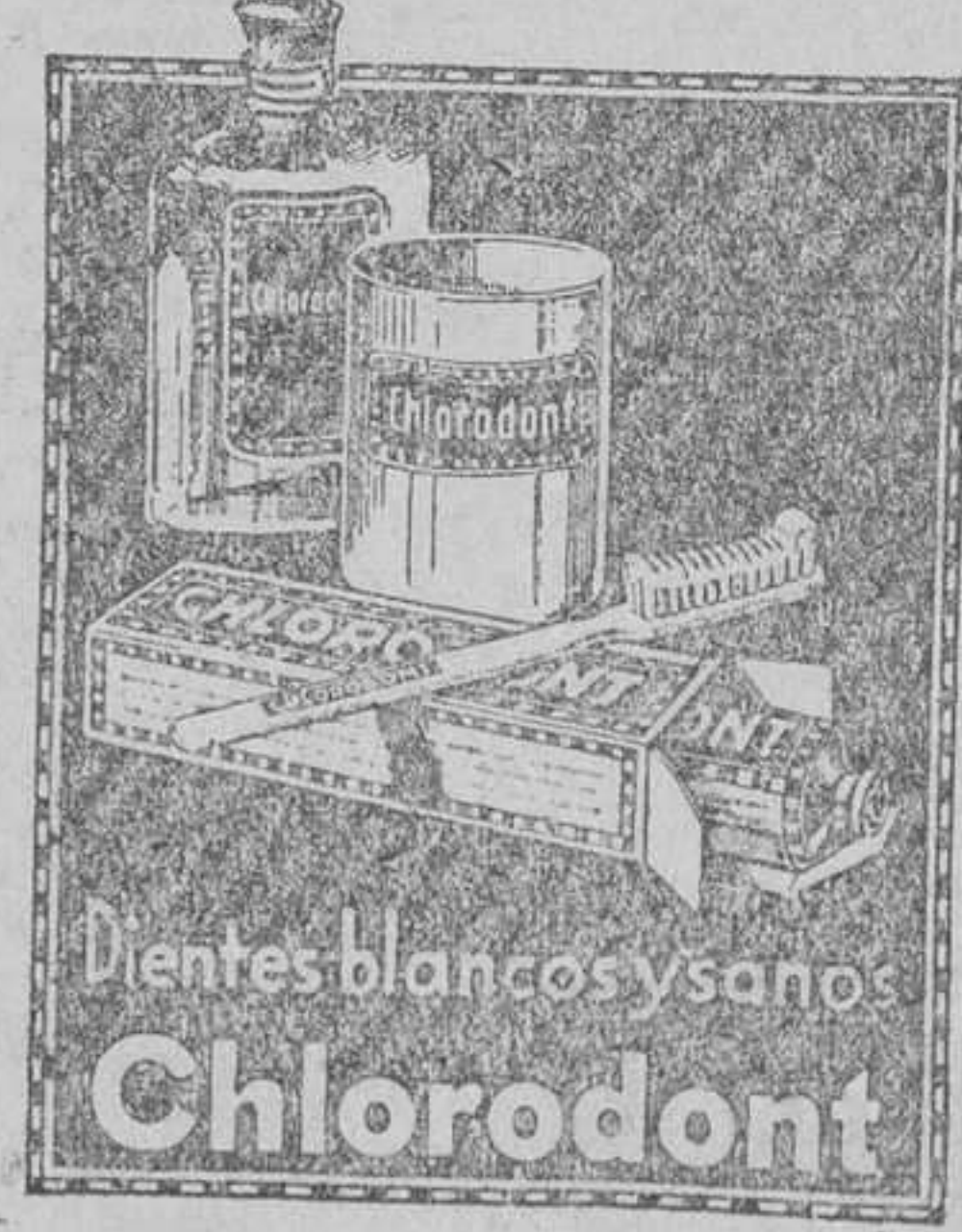
Dientes blancos y sanos Chlorodont

Viuda de Chápuli Alquiler de bocoyes vacíos