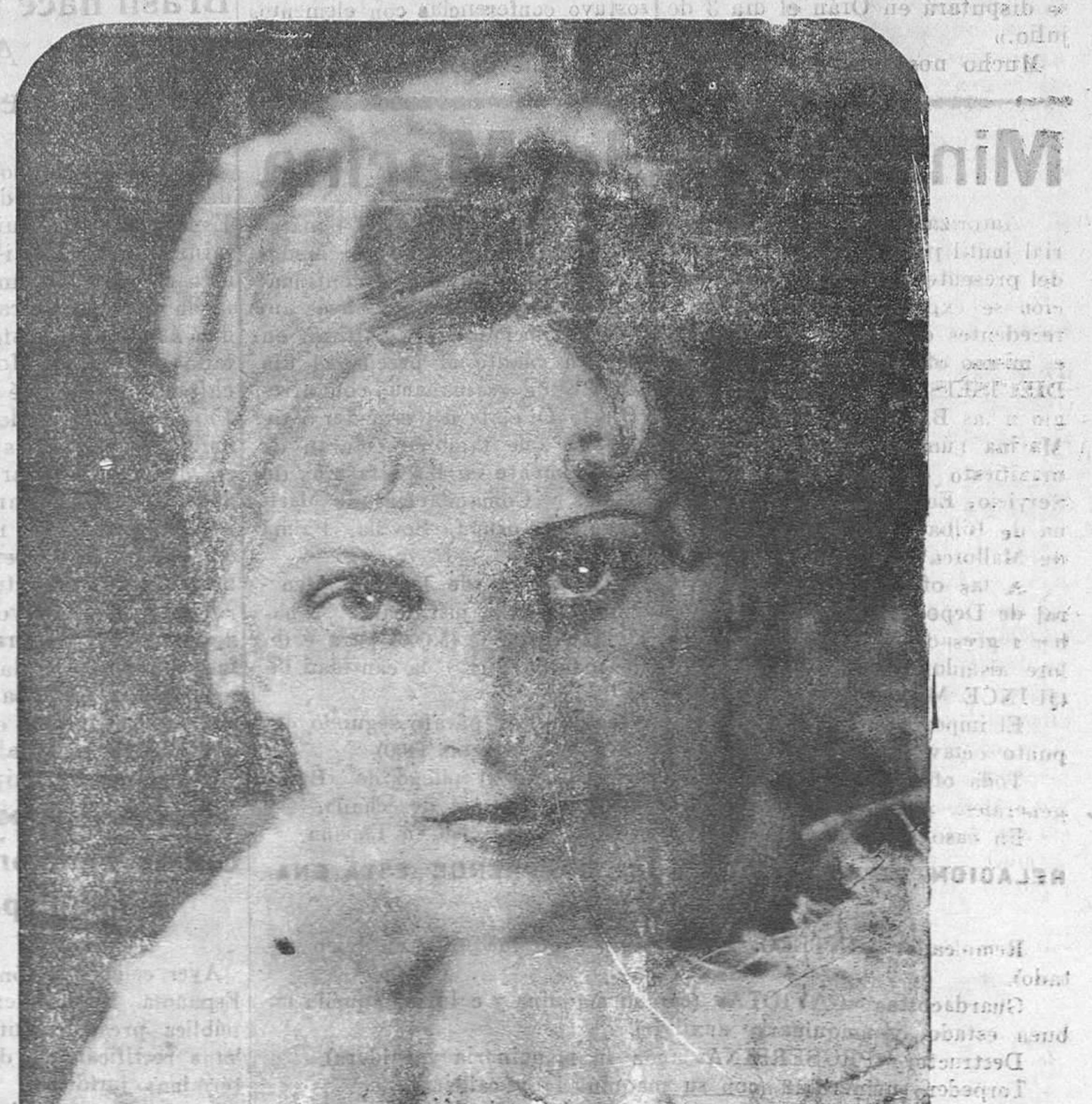
Tolma Todd, gentilísima artista de Hollywood, que en la actualidad filma la interesante película «Horizonte»

Los vocales de la Comisión visitaron al ministro de Hacienda, a fin de solicitar un crédito de tres millones de pesetas para atender a las obras, mientras se aprueba el proyecto de selección de las mismas, que está pendiente de las Cortes.