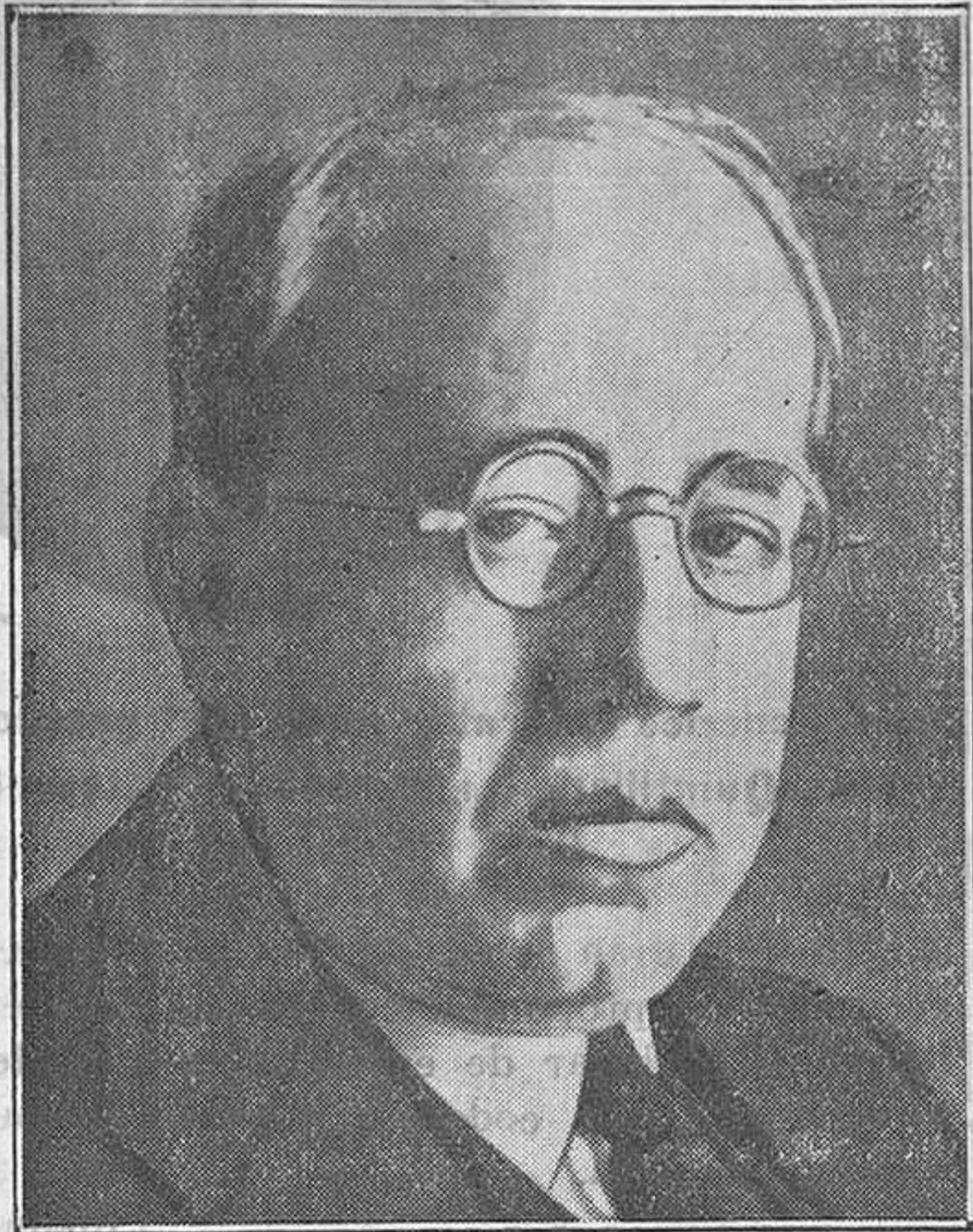
Don Manuel Azaña, el general civil de la República

Perfectamente aclarado lo sucedido aplicadas a los culpables, con vigor ejemplar, las sanciones oportunas, lo que más importa hacer resaltar de este episodio es la lección que, una vez más, ha dado D. Manuel Azaña a todos los políticos de tipo tradicional.