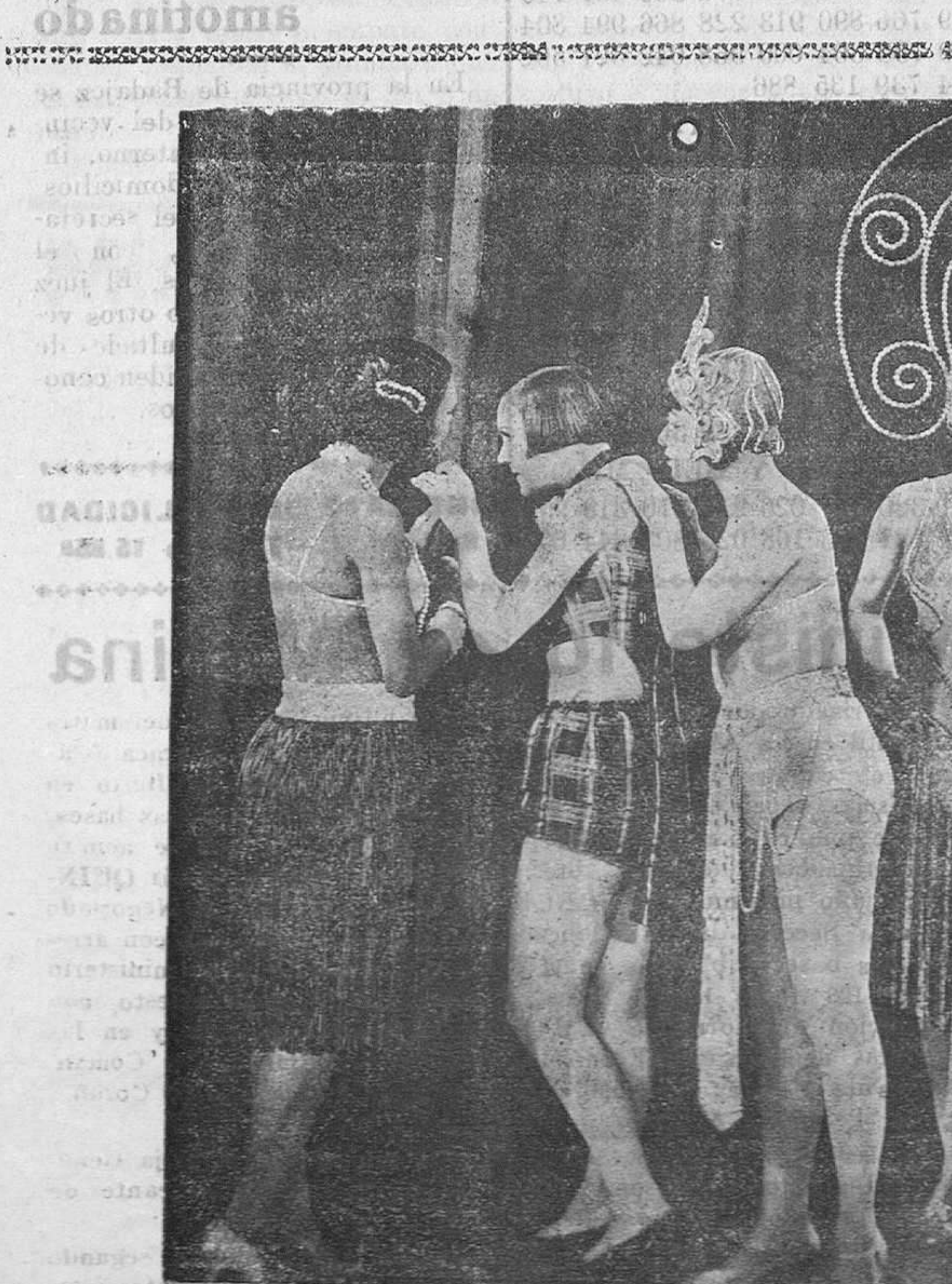
Rápido ferocino, que, para cualquier mortal más o menos sensible, puede constituir un paraíso... Con árbol de la ciencia del bien y todo...