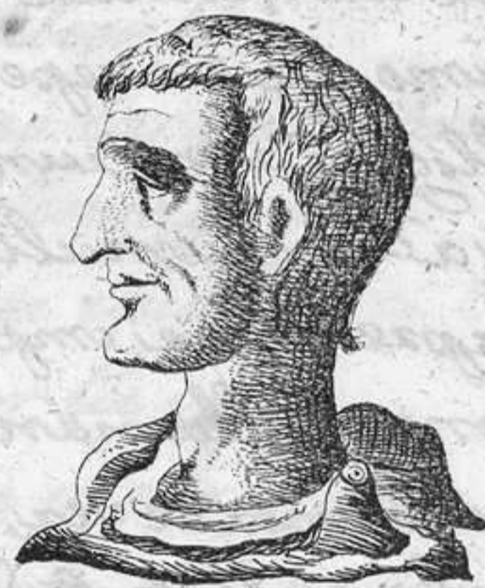
Lucio Tarquino. V. Rey de Roma.

hombre se da a si mismo, formando den- tro de si con largo uso una cualidad opera- triz, de acciones nobles y propias del hombre. Estas son las virtudes, que con nombre mas propio, y mas digno, se llaman Habitros virtuosos, o virtudes habituales, por ser ellas verdadera vestidura y adorno rico del alma: tanto mas honrosas que las natu- rales, cuanto estas son dadas de la natura- lezza; y aquellas adquiridas de la industria y de estas virtudes adquiridas, unas son in- telectuales, y otras morales. (Se concluirá)