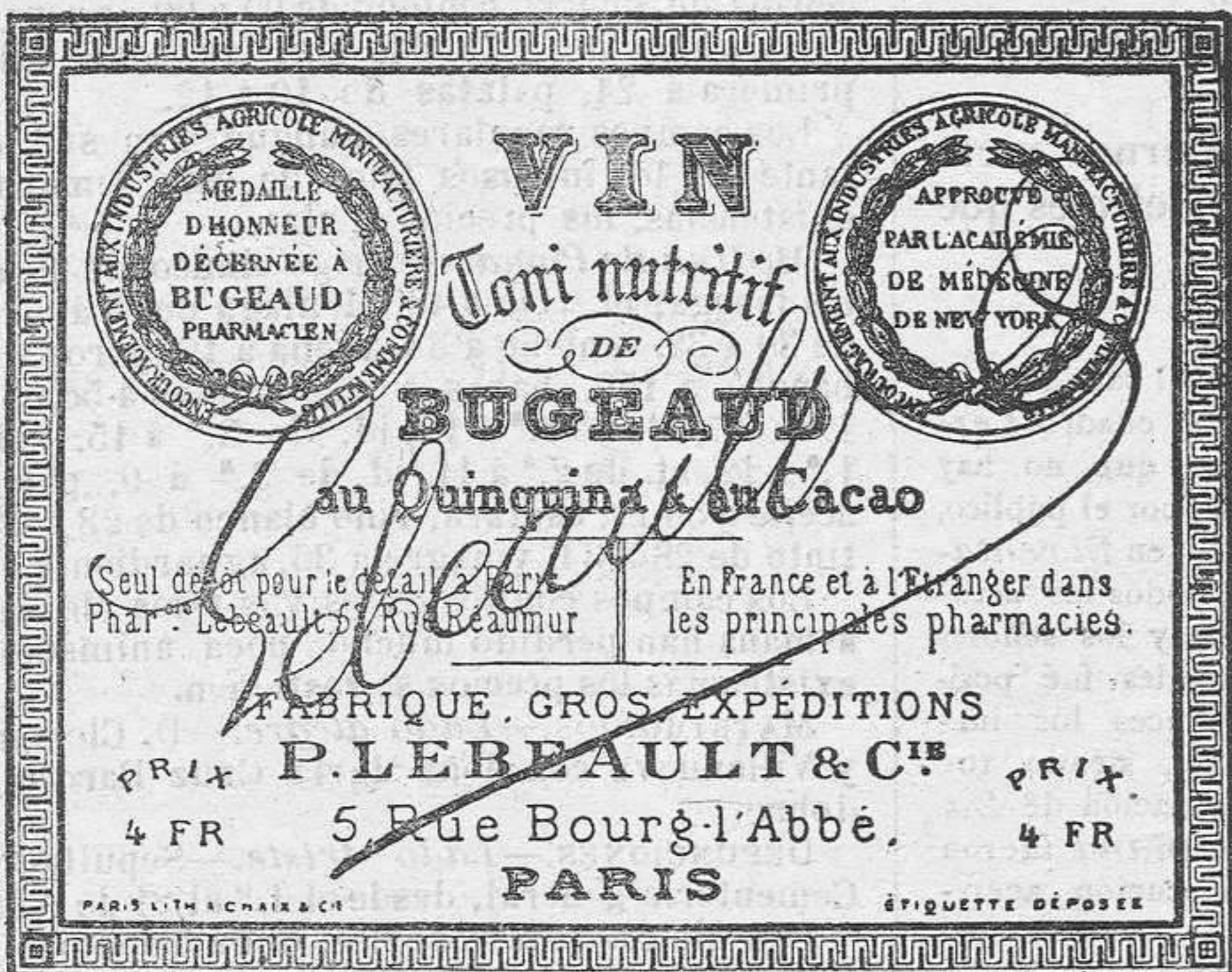
REPRODUCCIÓN DEL RÓTULO DEL VERDADERO VINO de BUGEAUD (impresión negra en fondo gamuza, firma encarnada).

P. LEBEAULT & C ia , 5, Rue Bourg-l'Abbé, PARIS