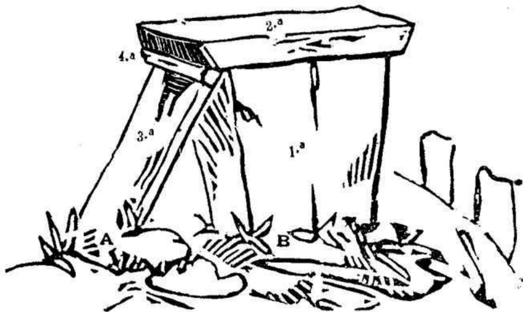
Altar de Talati de Dalt (término de Mahon; á unos cinco

Si se pudiese descubrir el uso á que estaba destinado el monolito que forma el plano inclinado, y el cual debia existir tambien en los otros altares de Trapucó, Torre d'en Gaumés, Trencada, etc., se obtendria la solucion del problema, y se diria la última palabra sobre el uso de estos altares; pues se ha necesitado muy poca cosa para hacer desaparecer esta piedra inclinada, tal como subsiste aun en el de Talatí; toda vez que la separacion de la cuña, producida por una casualidad cualquiera, ha sido suficiente para producir este efecto, segun puede juzgarse por los dibujos puestos á continuacion.