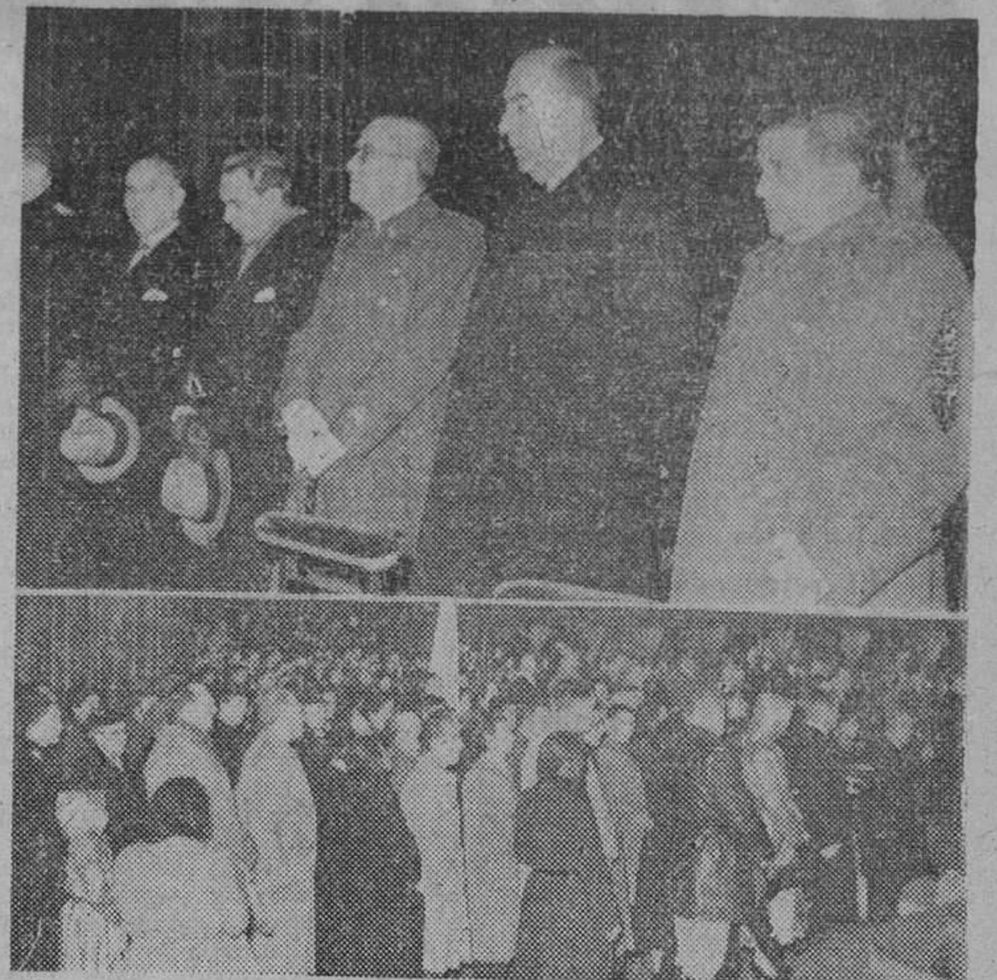
Presidencia de autoridades en los cultos celebrados en la Catedral, con ocasión del Día del Papa. — Debajo, un aspecto de la nave central de dicho Templo, durante la celebración de aquella fiesta. — (Fotos Pérez de Rozas.)