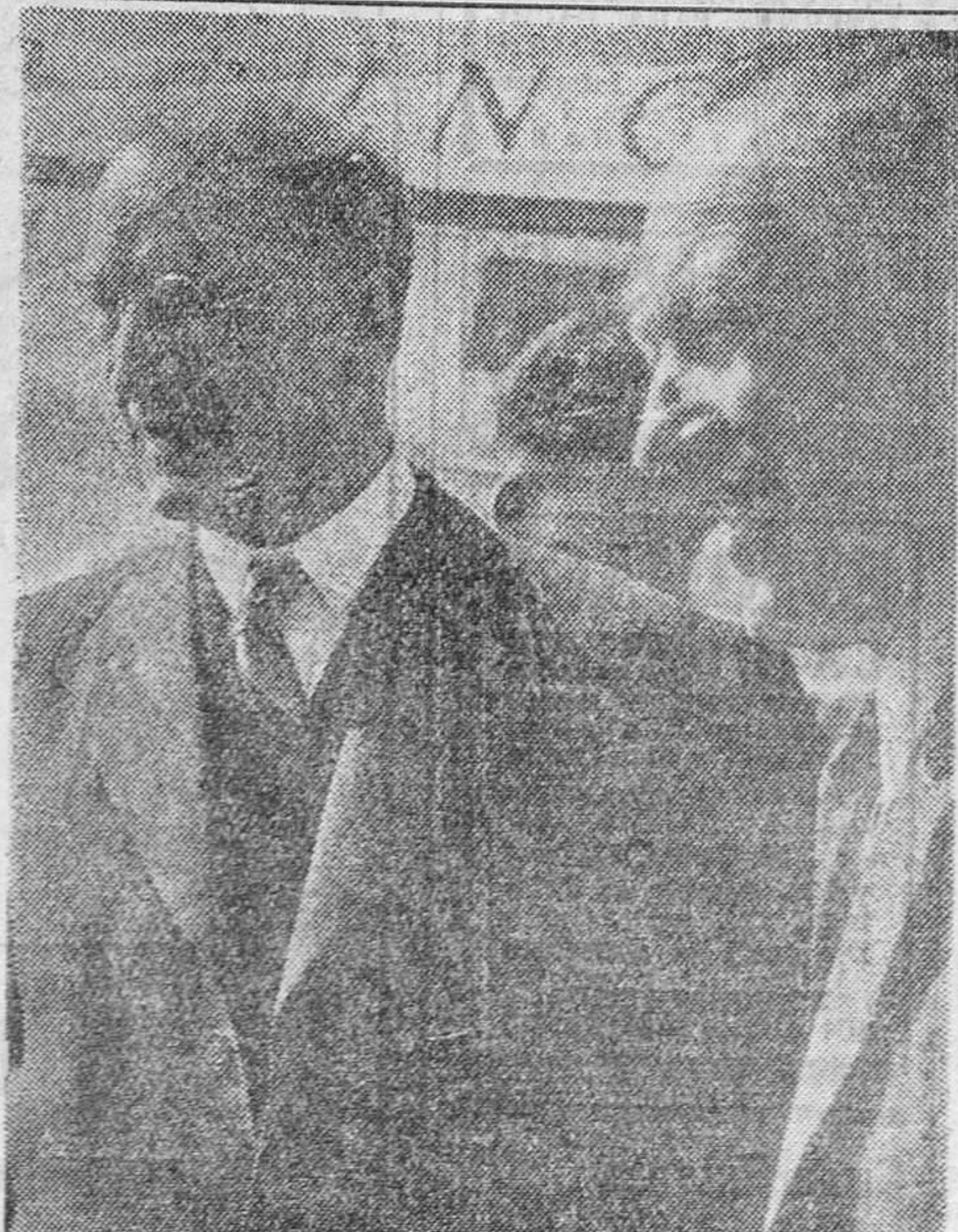
Paris. — El Primer Ministro irlandés, De Valera, ha llegado a París para dirigirse desde allí a Lourdes, San Sebastián y Portugal. — En la foto aparece en el aeropuerto de Bourget con el Embajador irlandés en la capital francesa. — (Foto Cifra.)

se vende a 75 céntimos. La cantidad que excede del precio habitual será destinada, por disposición superior, al sostenimiento de la Institución de San Isidoro para Huérfanos de Periodistas, Empleados y Obreros