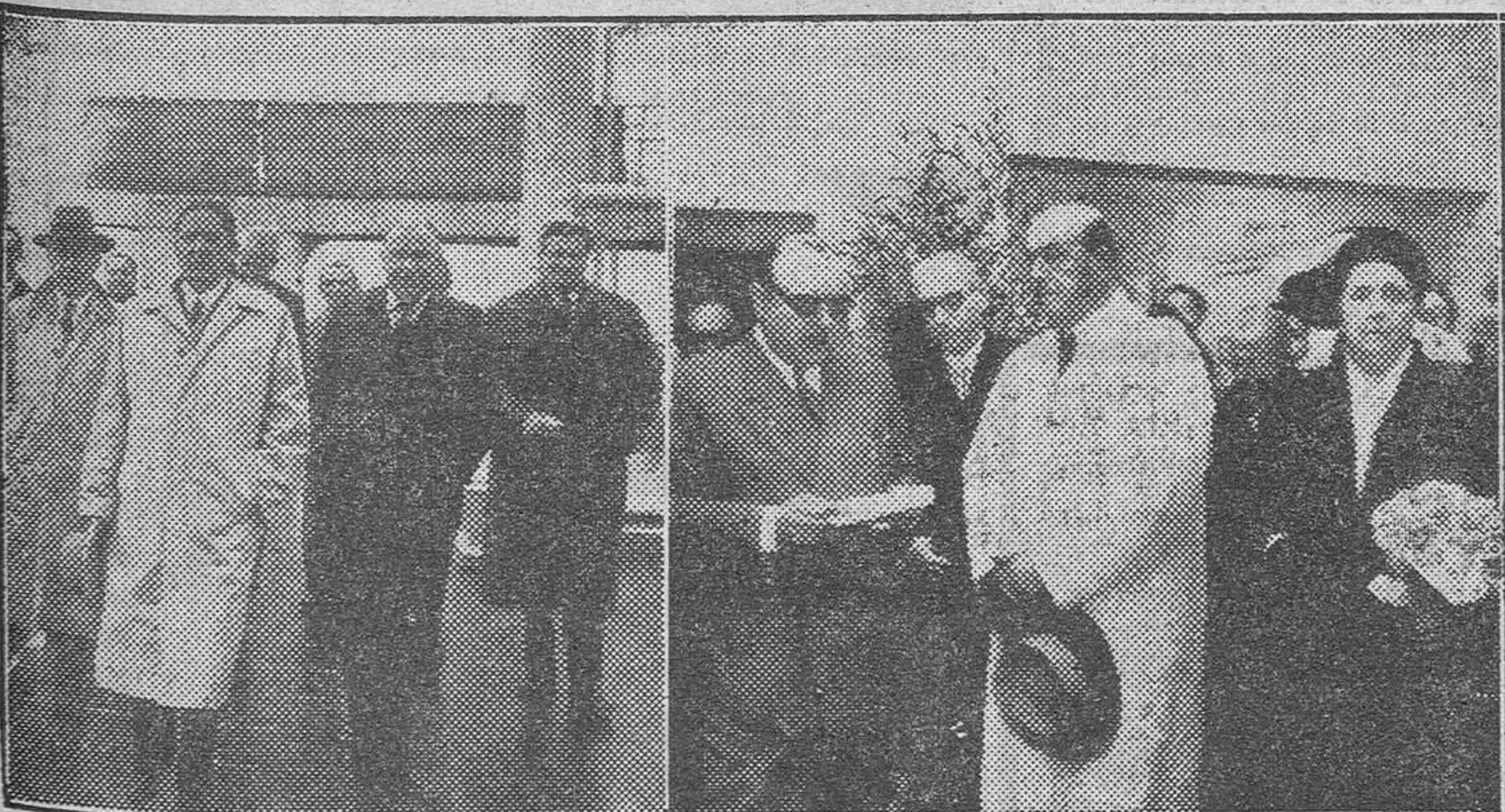
1. — El Gobernador civil, acompañado del jefe del Sector Naval y del Cónsul inglés, visita el «Caronias». 2. — Homenaje al Alcalde en el Hospital de Nuestra Señora del Mar.