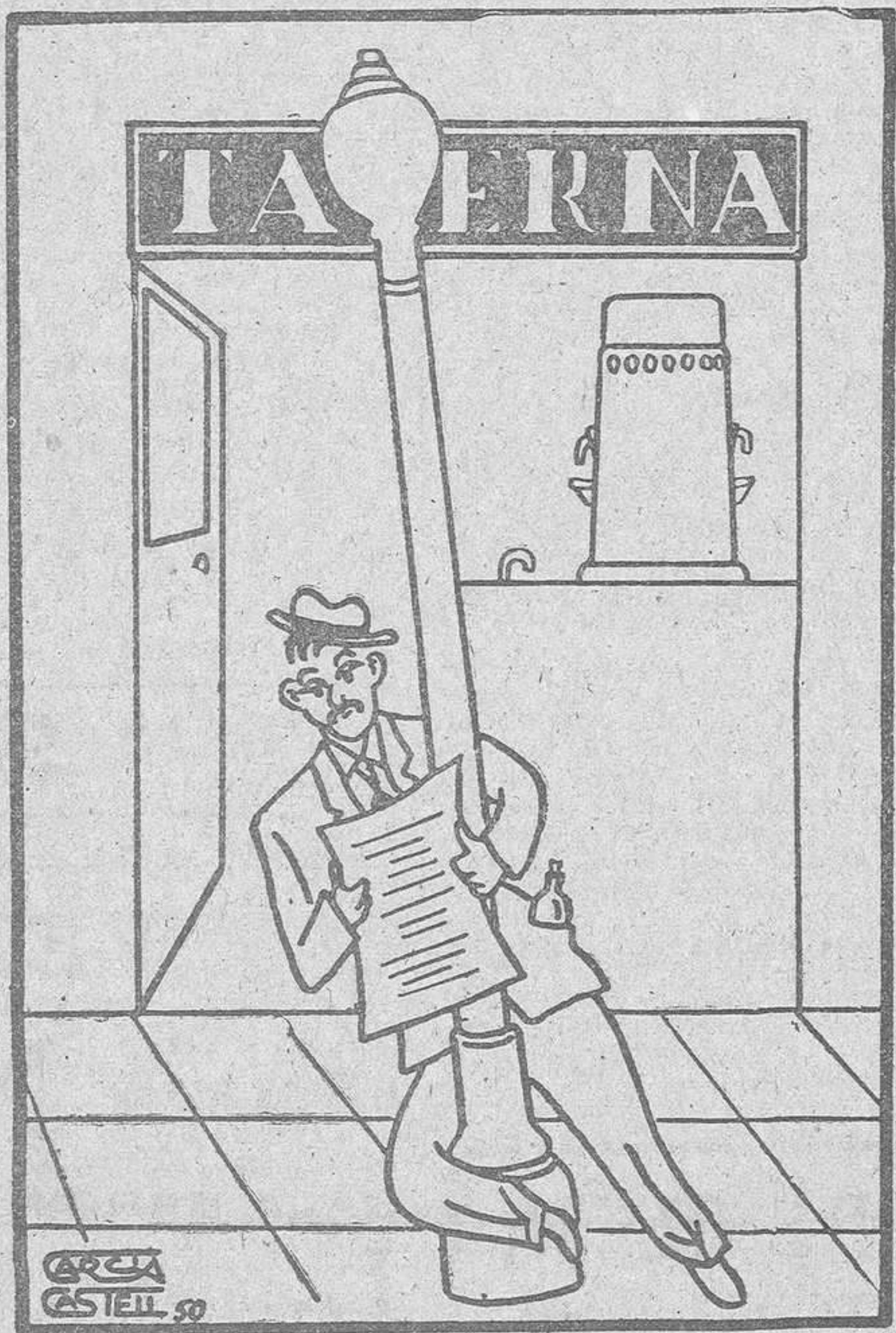
LA BOMBA DE HIDROGENO

ello implica que Francia podrá continuar sus negociaciones sobre arriendos a largo plazo de las minas de carbón de aquella región, con la reserva de que los acuerdos se someterán a revisión en el mencionado momento. Se hace observar también que, según parece, Francia no tiene gran prisa por negociar los arriendos a largo plazo de dichas explotaciones mineras. — Efe.