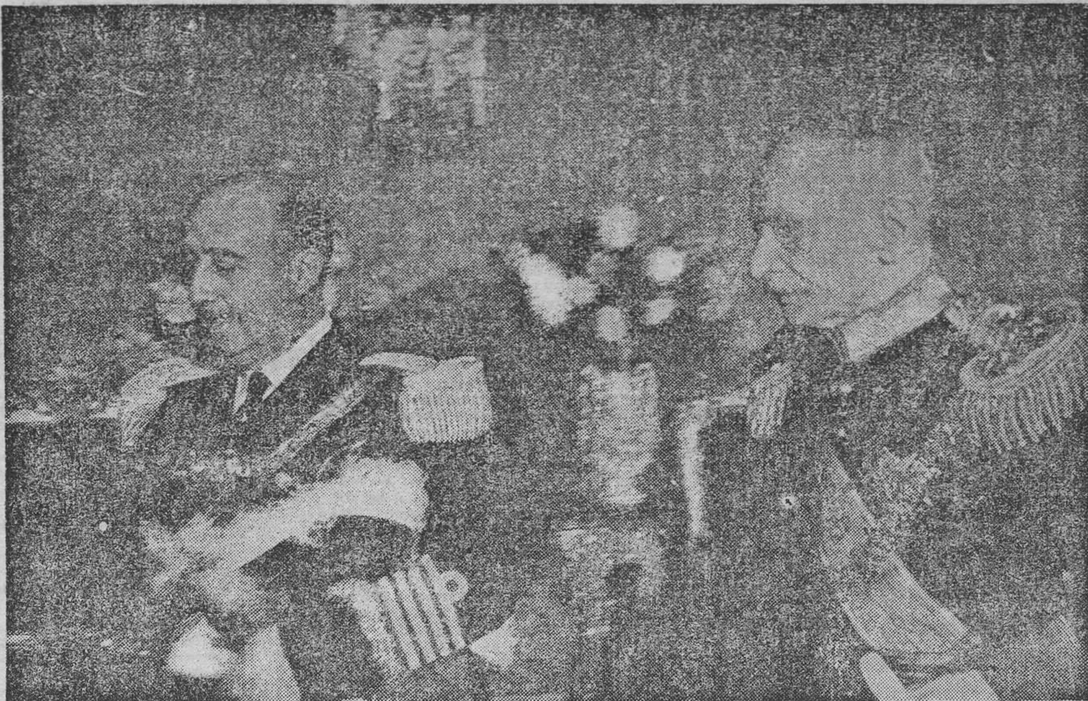
S. E. el Jefe del Estado español, Generalísimo Franco, con el Presidente Carmona, en la residencia oficial del Palacio de Belem.

trado a España con motivo de dicha alta ocasión. «España está en el pátique familiar y en las charlas del café, en las calles, en los balcones, en los escaparates, en las oficinas, en las tertulias literarias. Está, sobre todo, en los periódicos que aprovechan la