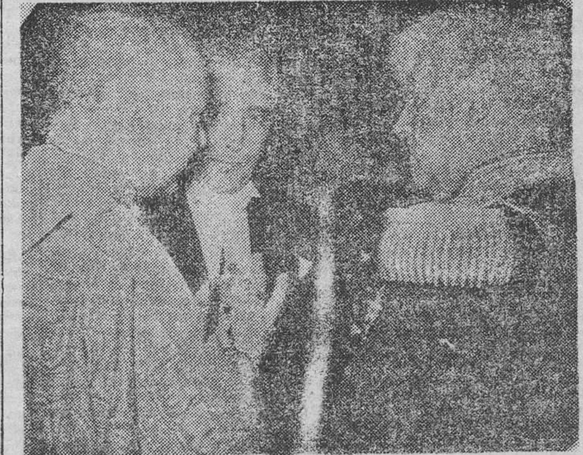
S. E. el Jefe del Estado español con el Cardenal Patriarca de Lisboa, el Presidente del Consejo, Oliveira Salazar, y el Ministro español de Asuntos Exteriores, en la recepción del Palacio de Ajuda.

De esta civilización occidental que exige un estilo moral de vida, del que cada vez aparecen más apartados ciertos pueblos y naciones.