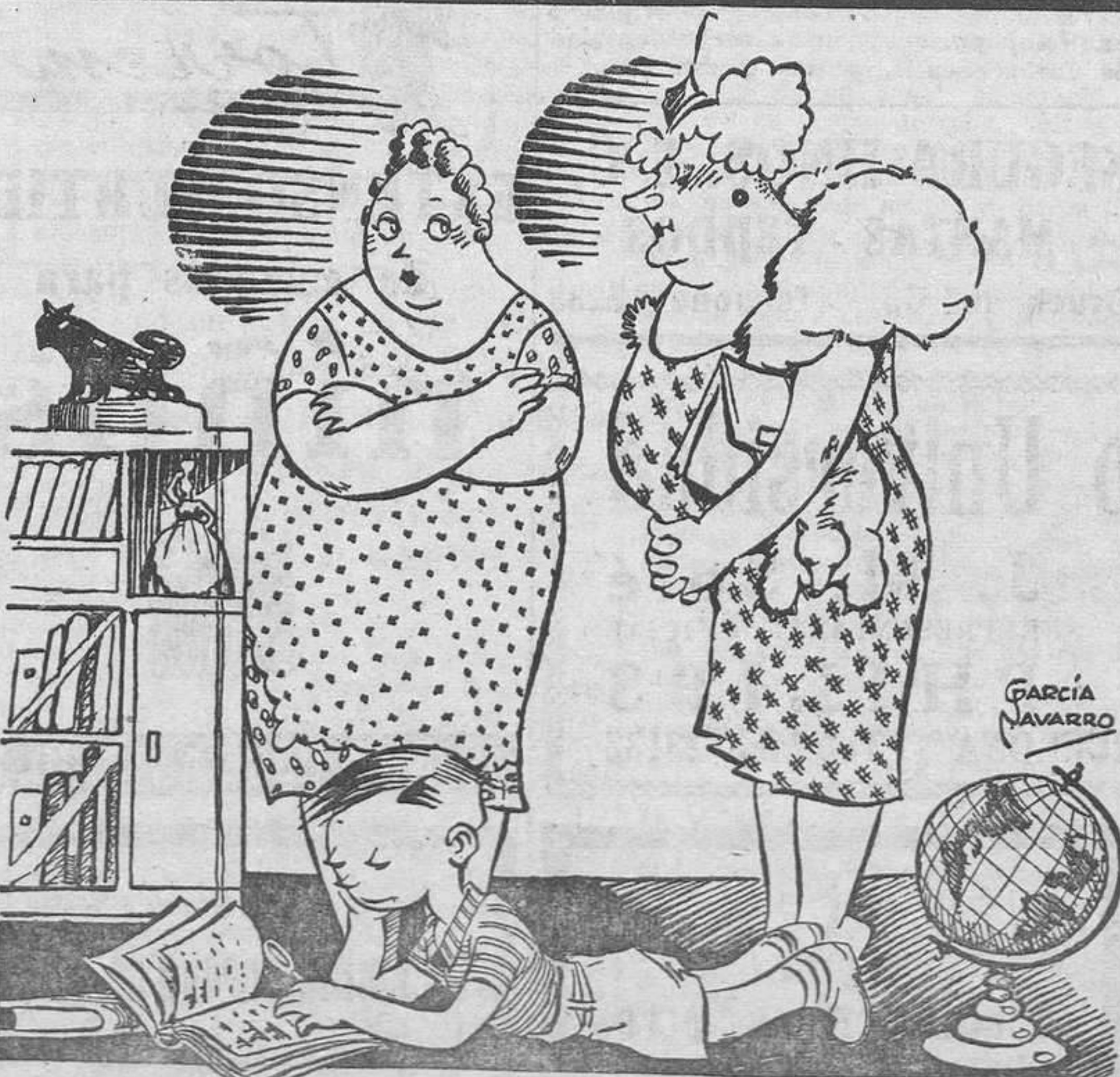
— Le digo a usted que es una eminencia. Se sabe de memoria todas las islas del Pacífico. — ¡Es la guerra! — Y además le ha dado ahora por la marina, y lleva dos semanas buscando la flota yanqui.