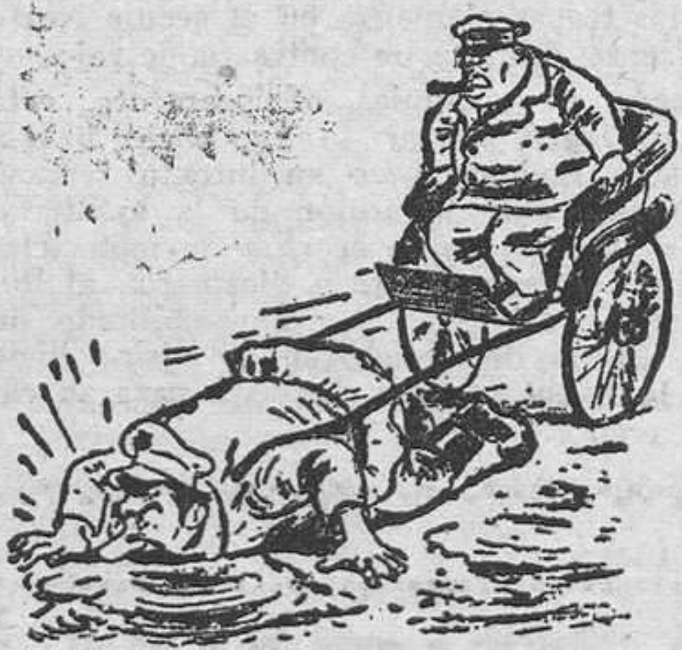
— ¿Y dónde encuentro yo ahora a otro batelero que me ayude a seguir tirando del carro? —