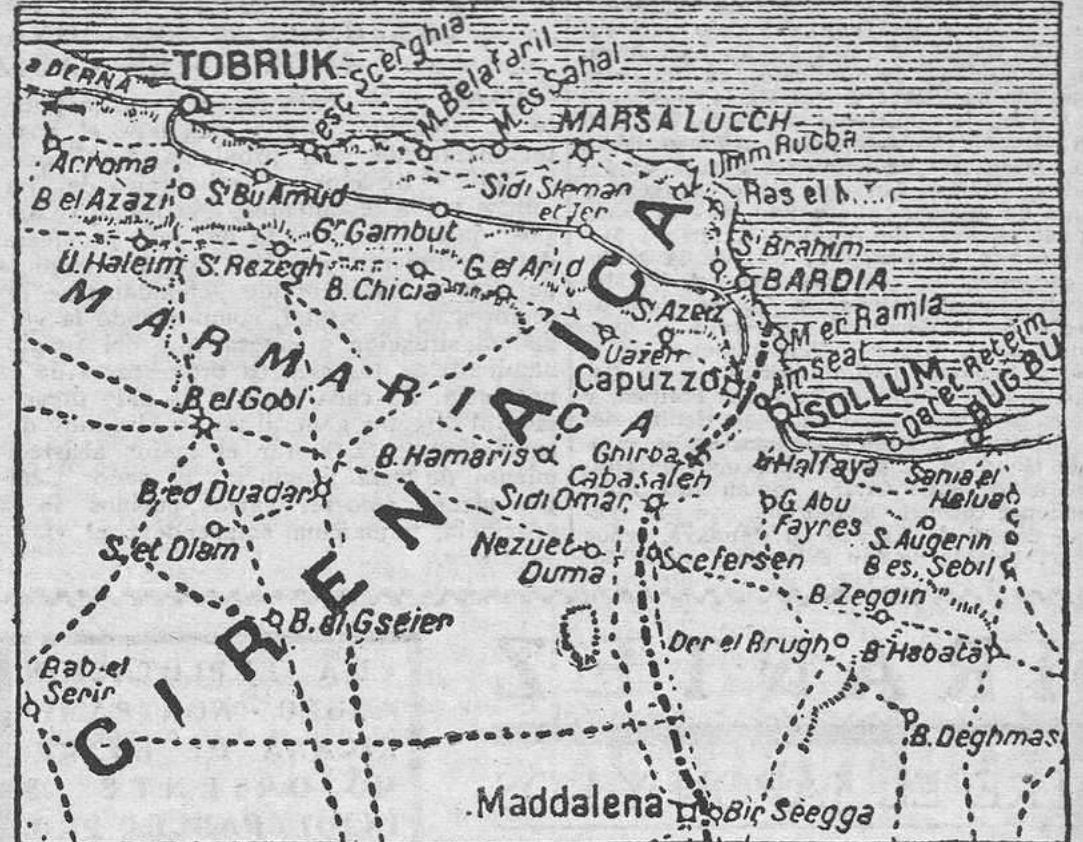
El frente de Marmárica, donde las líneas inglesas y las del Eje se entrecruzan en confuso laberinto, cuya solución se esfuerzan ambos contendientes en lograr a su favor, dando lugar a una empedatísima batalla que dura desde hace doce días.

Respecto del Extremo Oriente, la ruptura de las negociaciones entabladas en Washington aboca al borde de la guerra la tirantez existente entre Norteamérica y el Japón. Este quiere terminar la lucha que sostiene con la China comunista de Chank Kai Chek, y Norteamérica apoya a este último. El acuerdo entre dos actitudes tan dispares ha sido imposible. Cualquiera incidente, el ataque de los japoneses a la ruta de Birmania por la que el gobierno de Chungkin recibe el material inglés y norteamericano, o la ocupación de Thailandia,