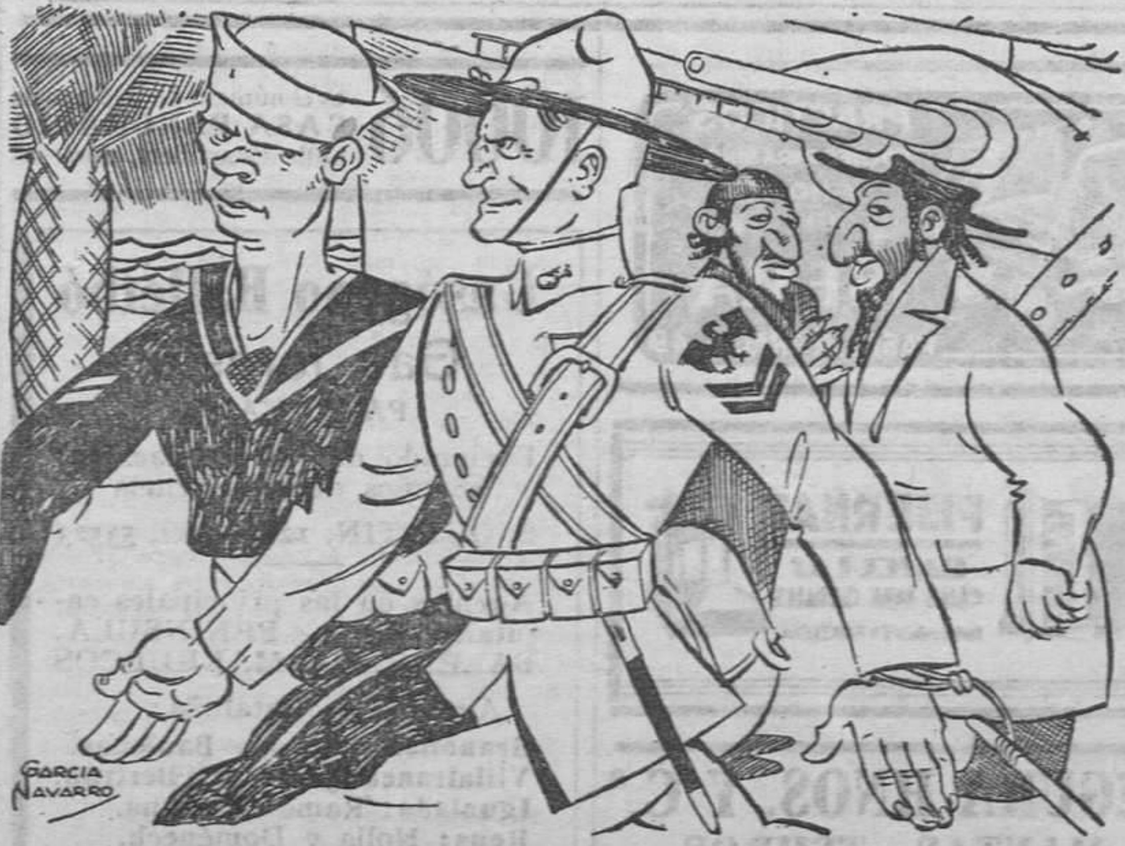
— ¡Estos son los amigos de Delano! — No; son los amigos de la Guerra. — ¡Ah! Es igual.