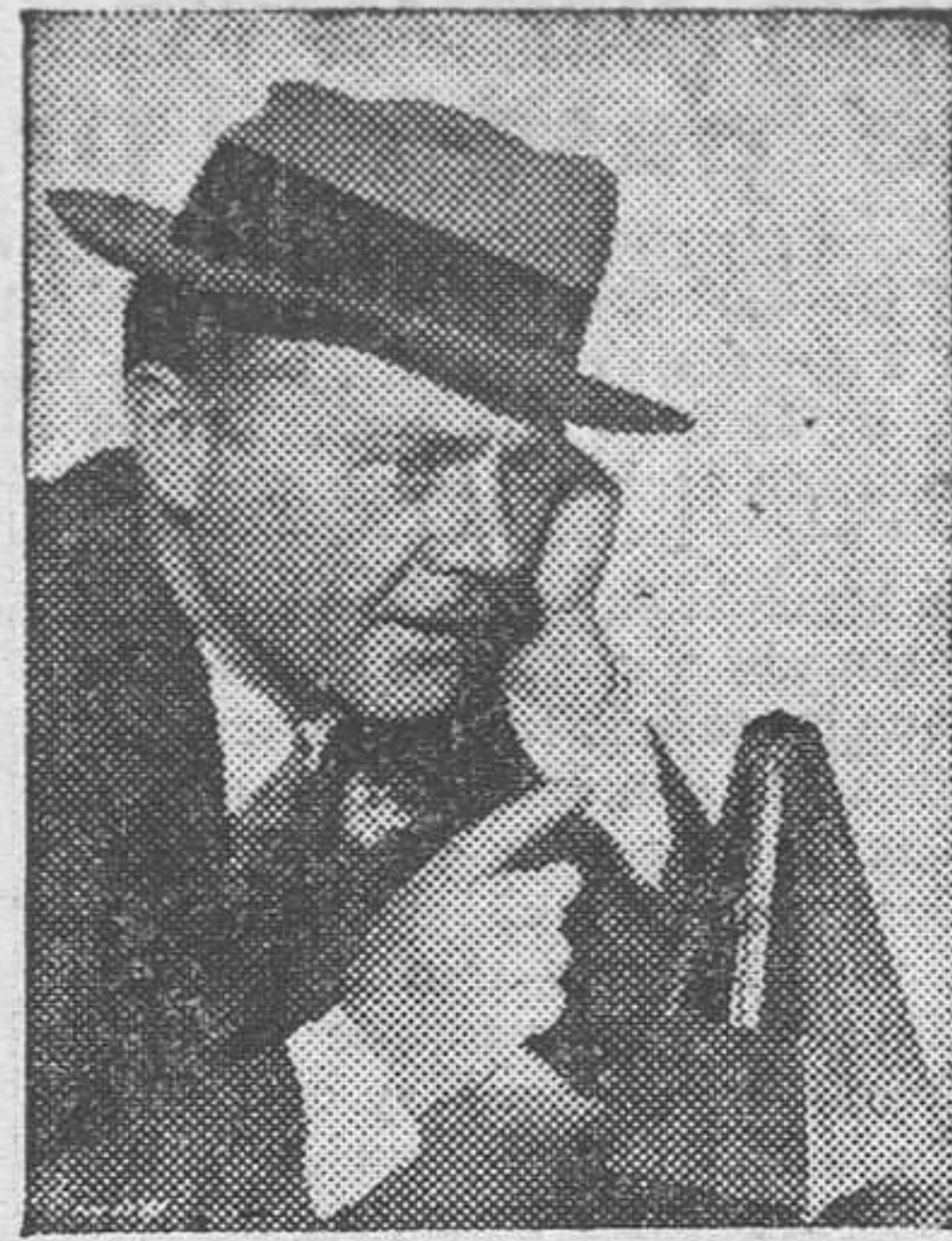
CHARLES RUGGLES en «Un marido en apuros»

Viernes próximo: El águila y el halcón - El Presidente fantasma