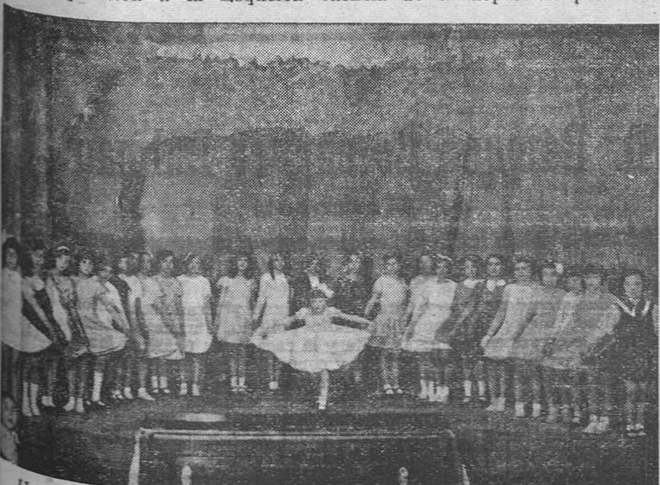
Una fiesta infantil organizada por el Grupo Femenino de la entidad