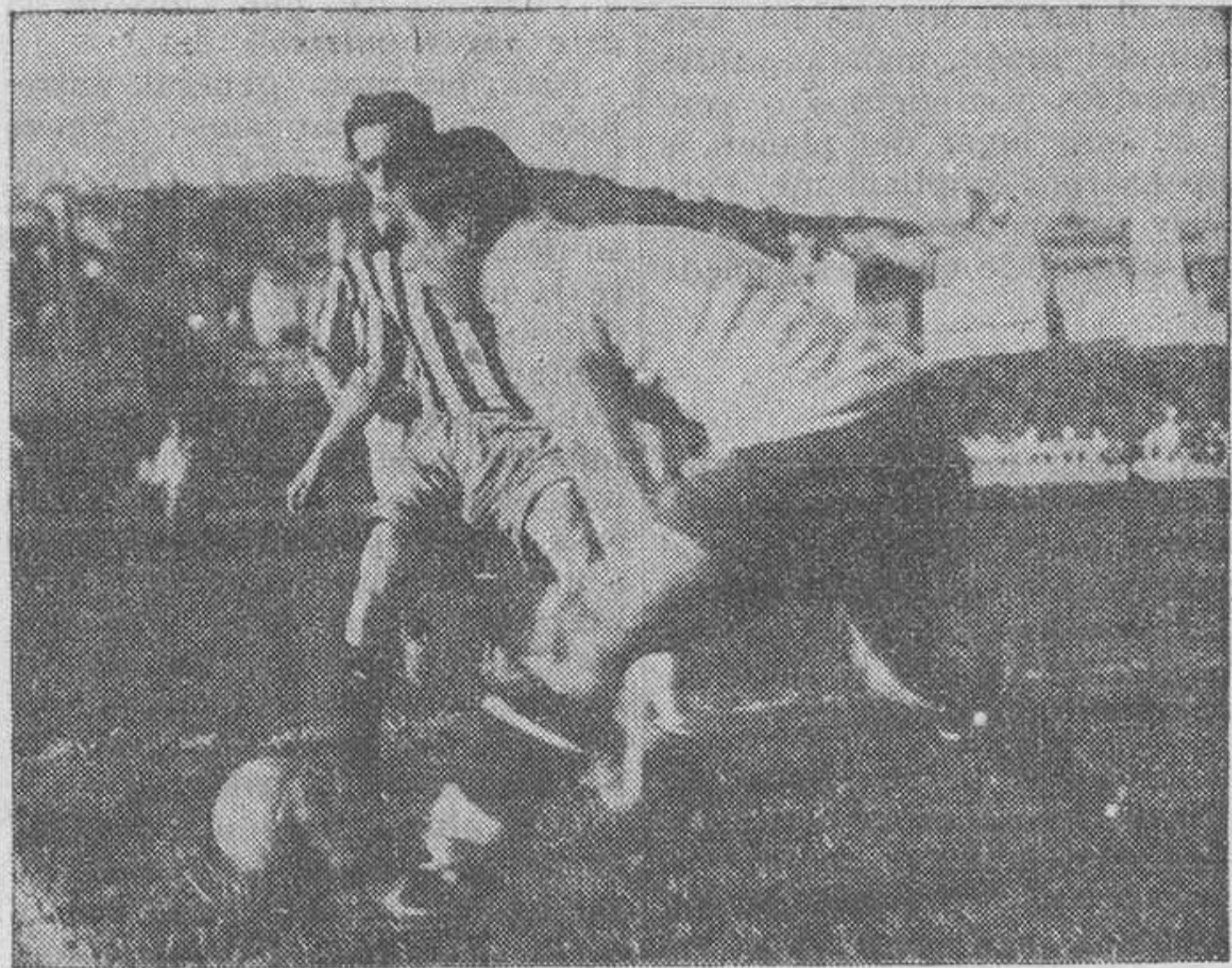
La defensa, floja, del Athletic a pesar de ser un peligro constante para su marco, realizó algunas buenas jugadas. (Fot. Sagarra)

El campo del Guinardó, sin llegar al lleno completo, ofrecía un buenísimo aspecto. — LOIX.