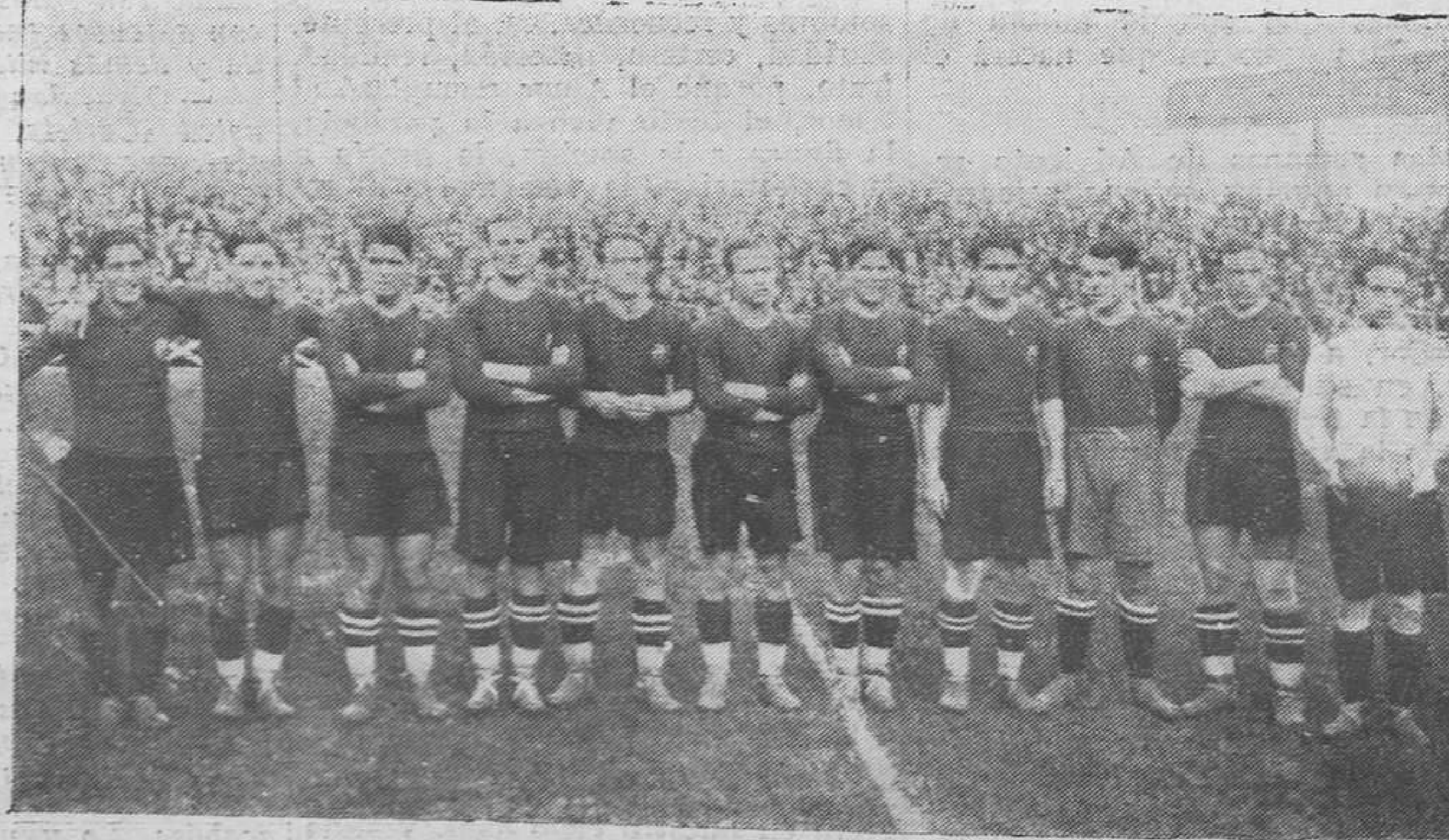
F. C. BARCELONA, CLASIFICADO EN TERCER LUGAR