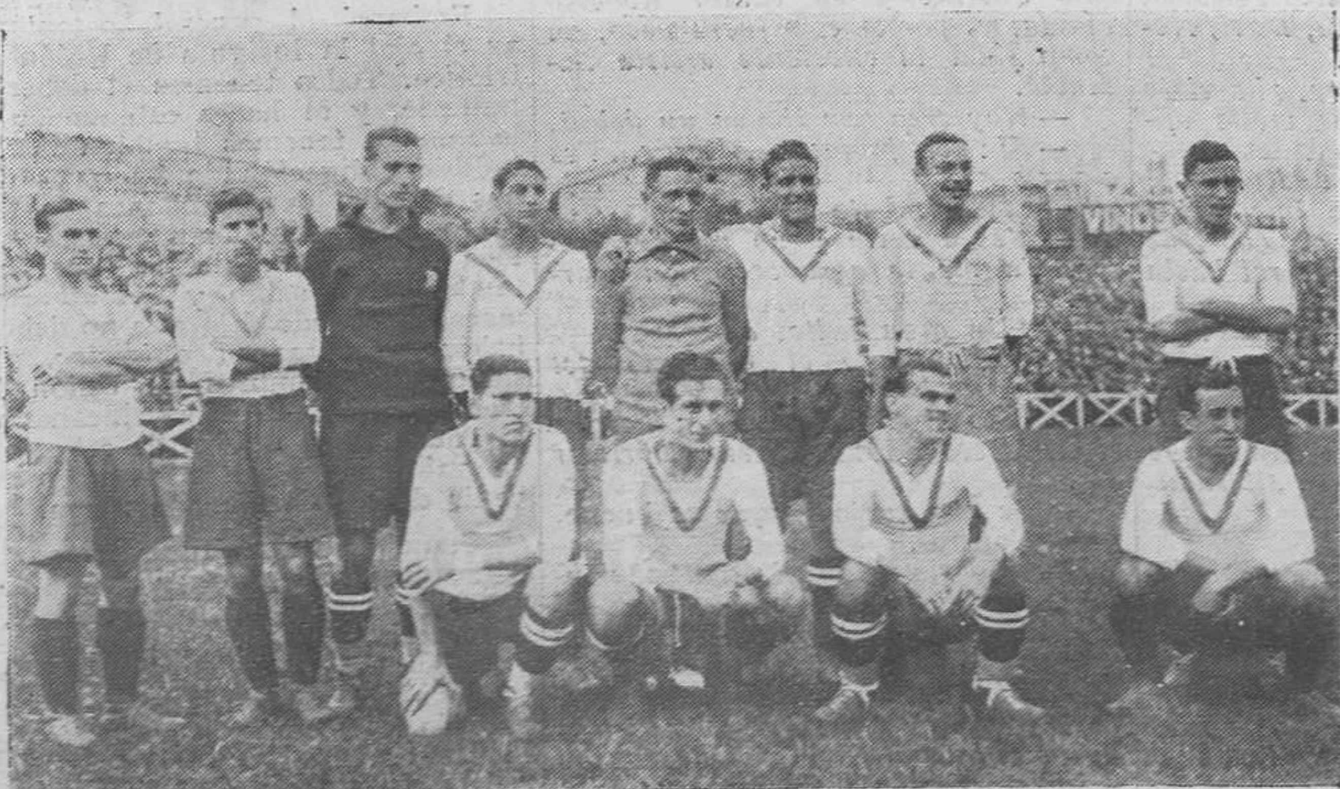
C. D. EUROPA, SUB-CAMPEON