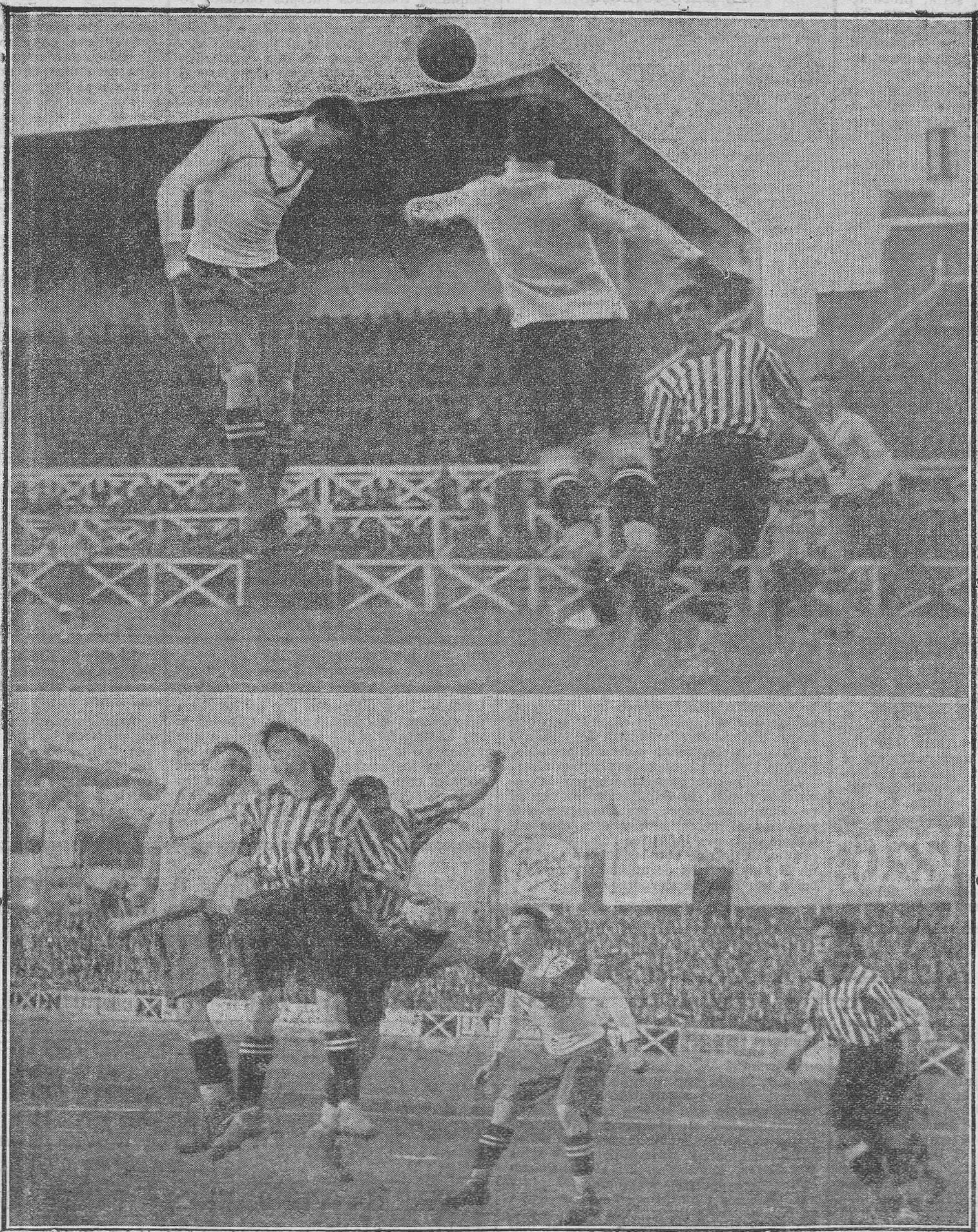
Dos momentos del encuentro Cartagena-Europa, celebrado ayer en el campo de este último

ADMINISTRACIÓN : Casa Provincial de Caridad : Montalegre, número 5 : BARCELONA : Teléfono 580 A