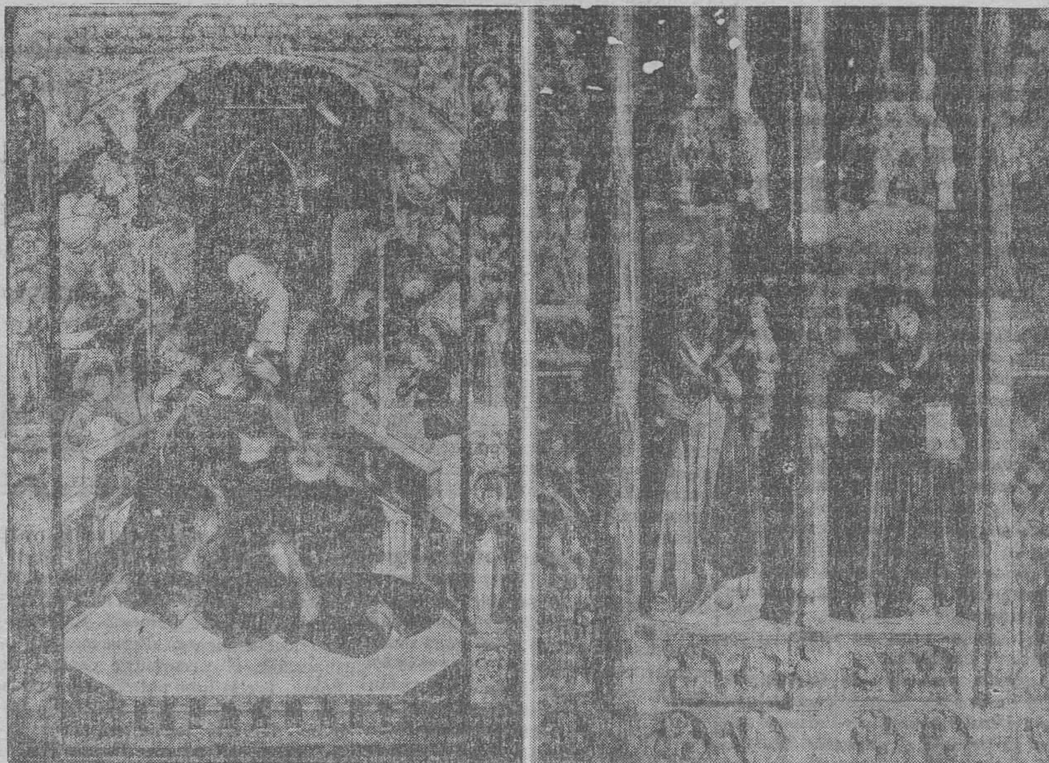
Taula de la Verge de Cervera (segle XV) i Retaule en pedra de Gerb (segle XIV)

Heus ací breument exposat el contingut del nou Museu d'Art de Catalunya. Amb ell vénen a coronar-se els esforços de trenta anys d'activitat de la Junta de Museus de Barcelona.