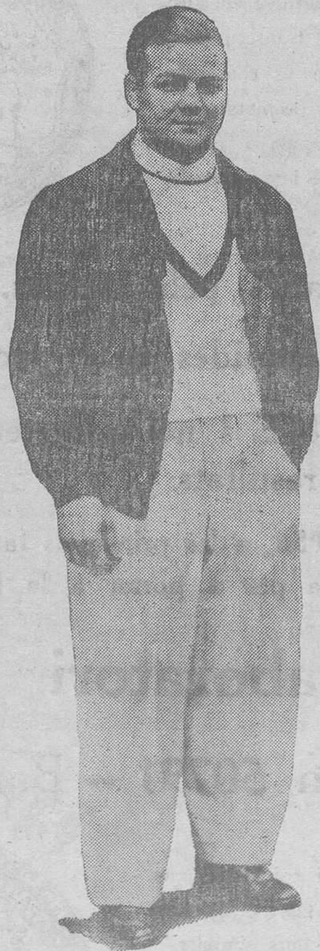
El directe de dreta, rematat, finalment, amb una forta esquerra, arma temible del campió del món Freddie Miller, aconseguiran trancar la sèrie de triomfs del nostre campeoníssim Gironès?

Cloure en un local de la capacitat de l'Olympia un espectacle el presupost del qual s'havia calculat per a