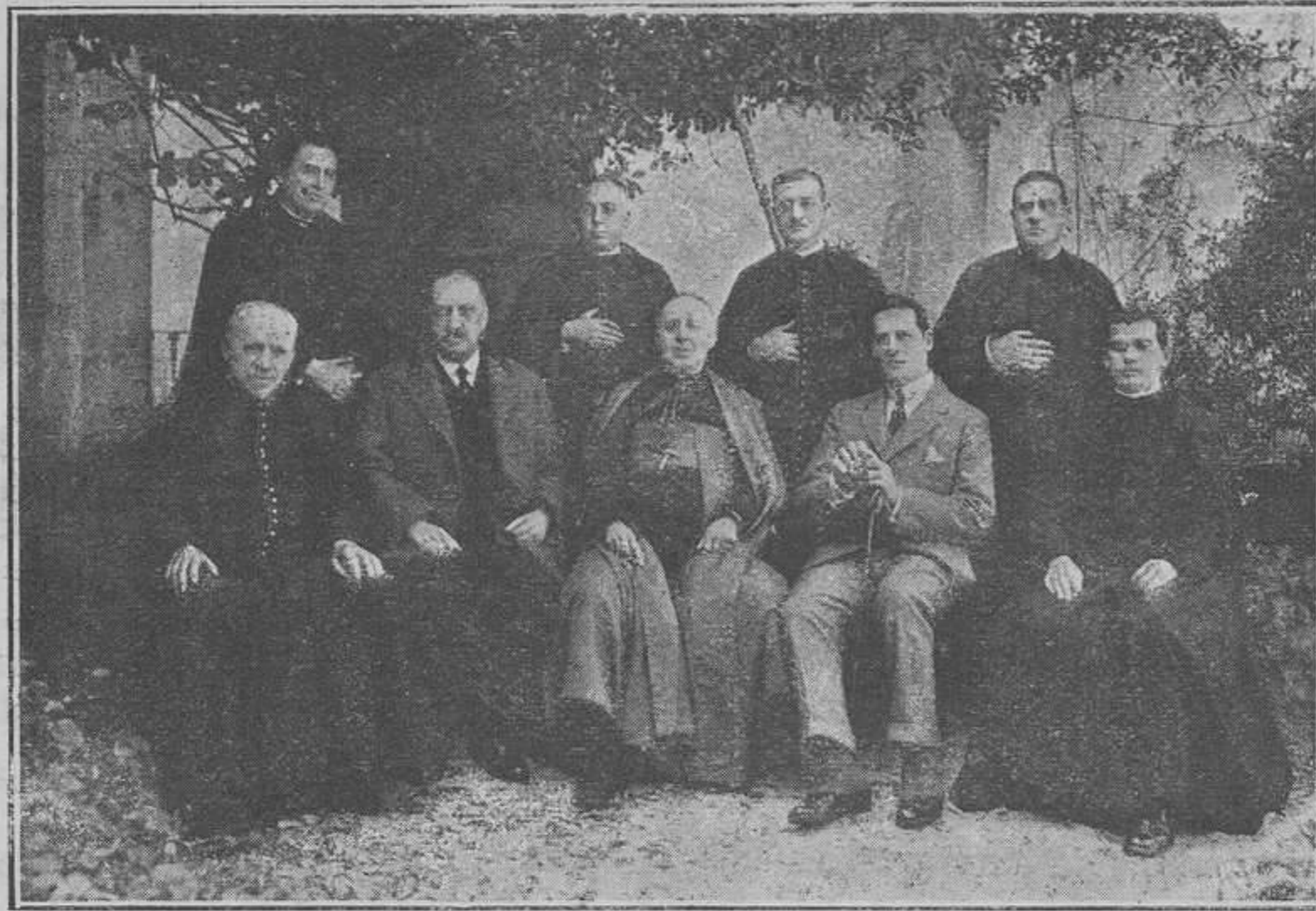
JUNTA ORGANIZADORA DE LAS FIESTAS

Inspector de los Salesianos de las Inspectorías Céltica y Tarraconense