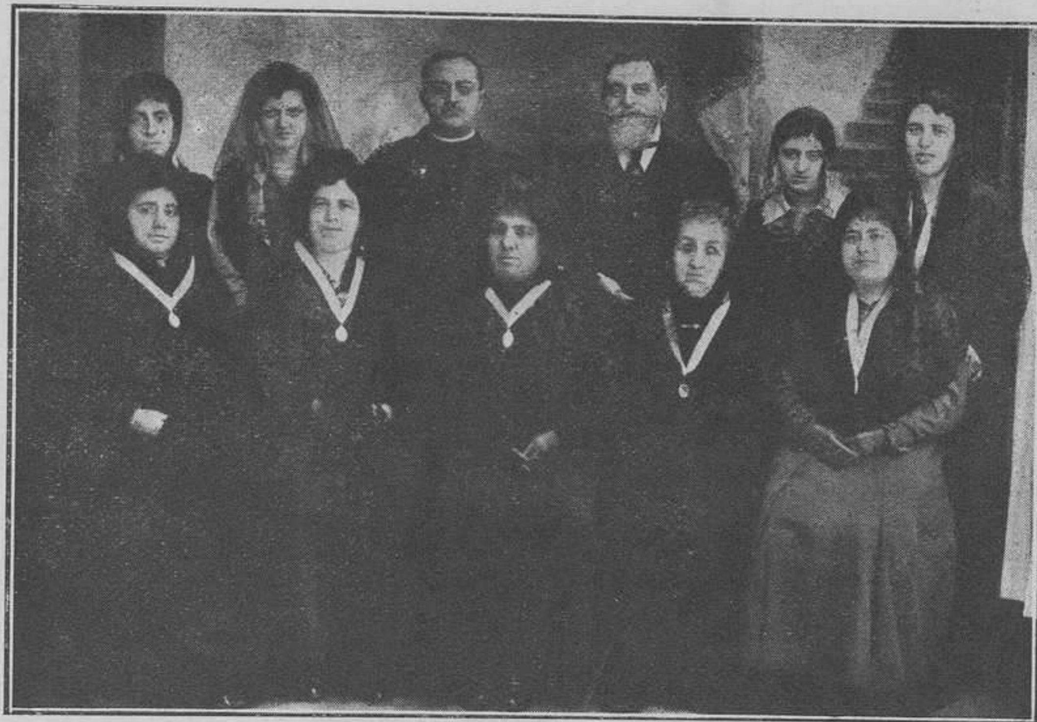
JUNTA DIRECTIVA DE LA ARCHICOFRA DIA DE MARIA AUXILIADORA DE MAHON

Formados nuestros corazones en la escuela del Amor de los Amores y alimentados con