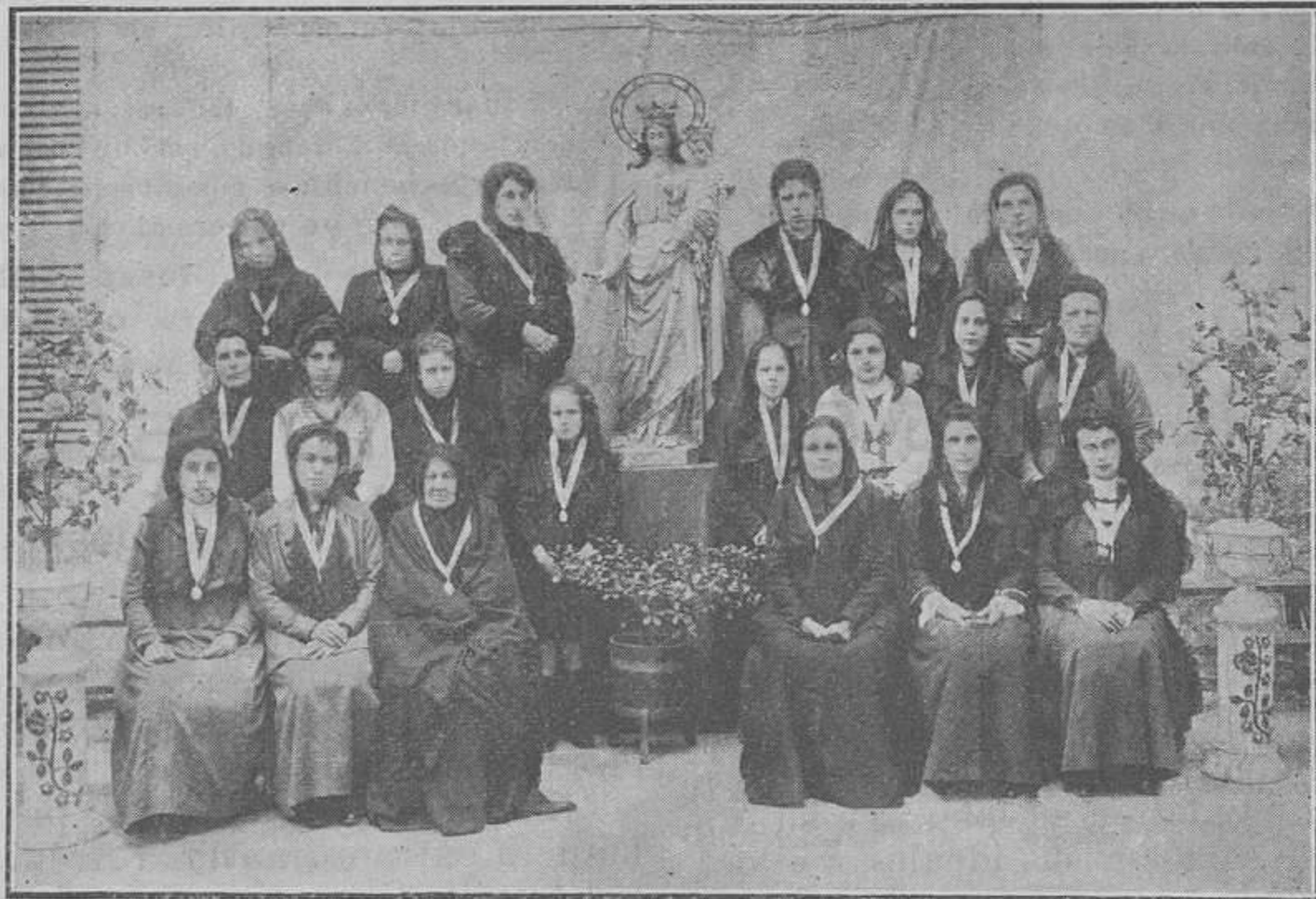
SEÑORAS CELADORAS DE LA ARCHICOFRADEIA DE MARIA AUXILIADORA DE CIUDADELA

ría Auxiliadora, al menos para la celebración de sus Bodas de Oro , tengan los devotos de la excelsa Virgen la dicha de ver elevado al honor de los altares, al perínclito Fundador de los Religiosos Salesianos, al Príncipe de los propagadores de la devoción a María Auxiliadora, al gigante de la Obra Salesiana