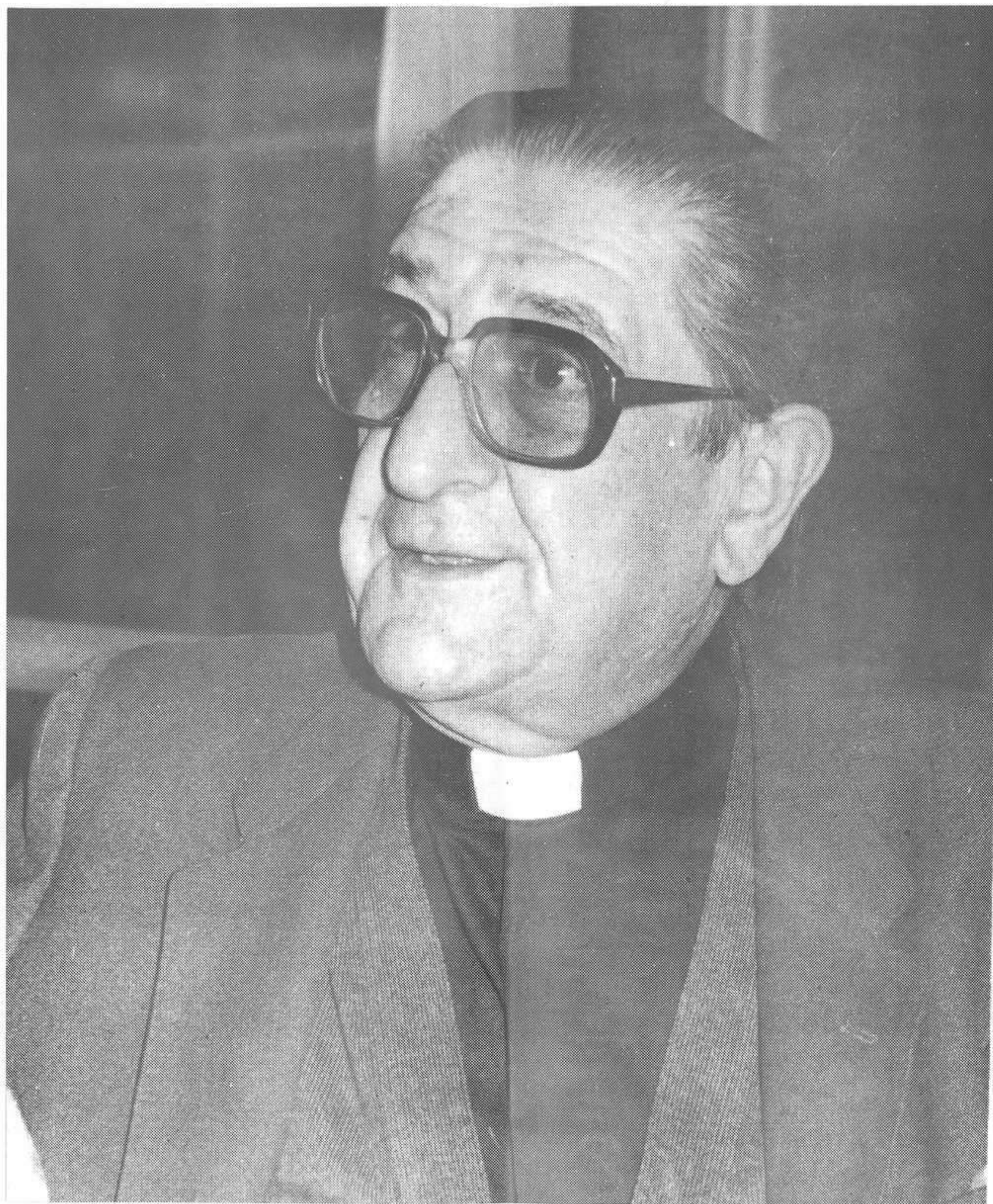
MONS. ANTONI DEIG I CLOTET, BISBE DE MENORCA.

Des del 5 de novembre del 1977 fins al 7 de març del 1990