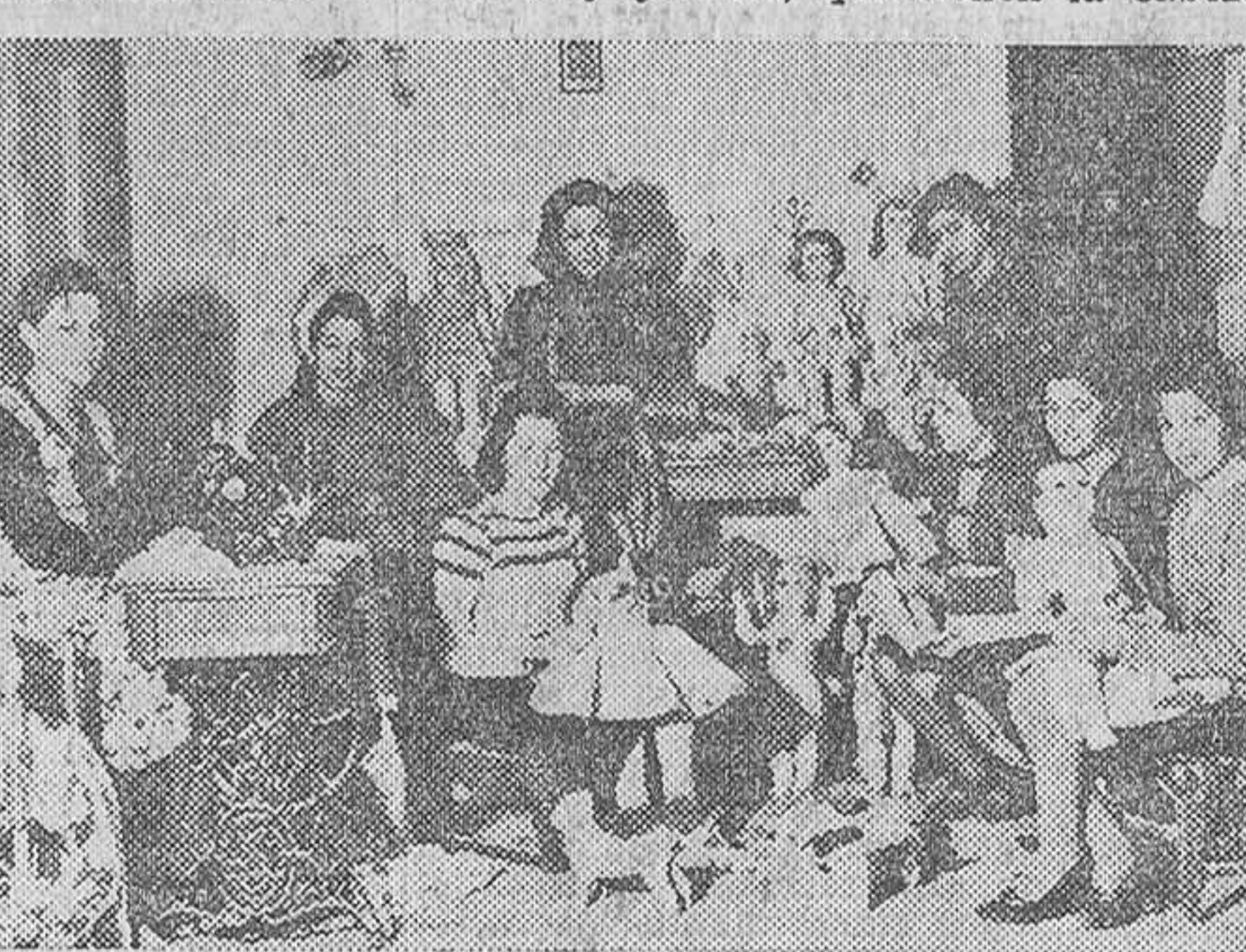
Fábrica de muñecas "CARMEN". Como periodista, agradezco de todo corazón sus constantes atenciones para con nuestras huérfanas.