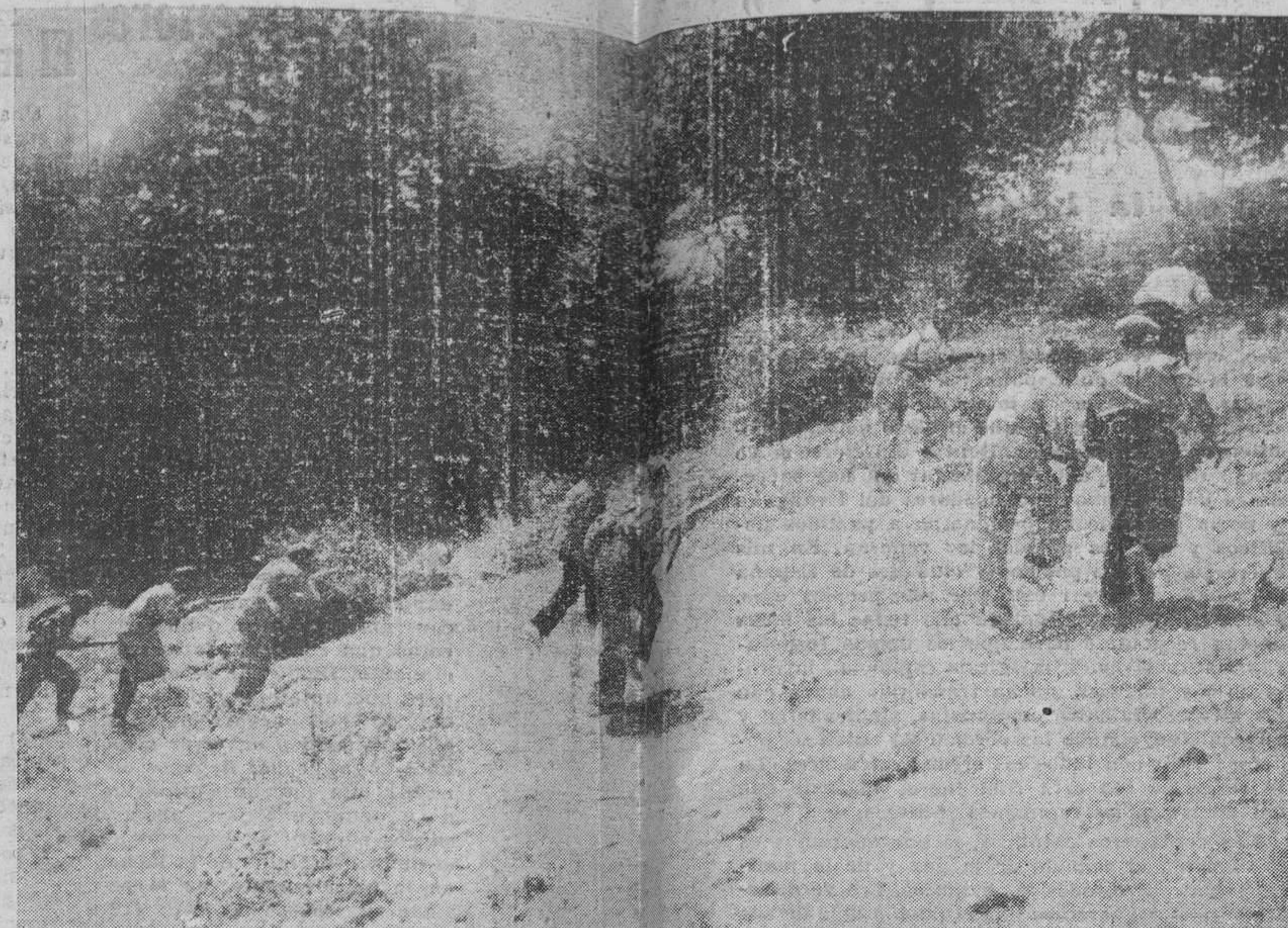
EN LOS FRENTE DE LA SIERRA.—Una avamadilla persiguiendo a los rebeldes en las vertientes del Reventón.