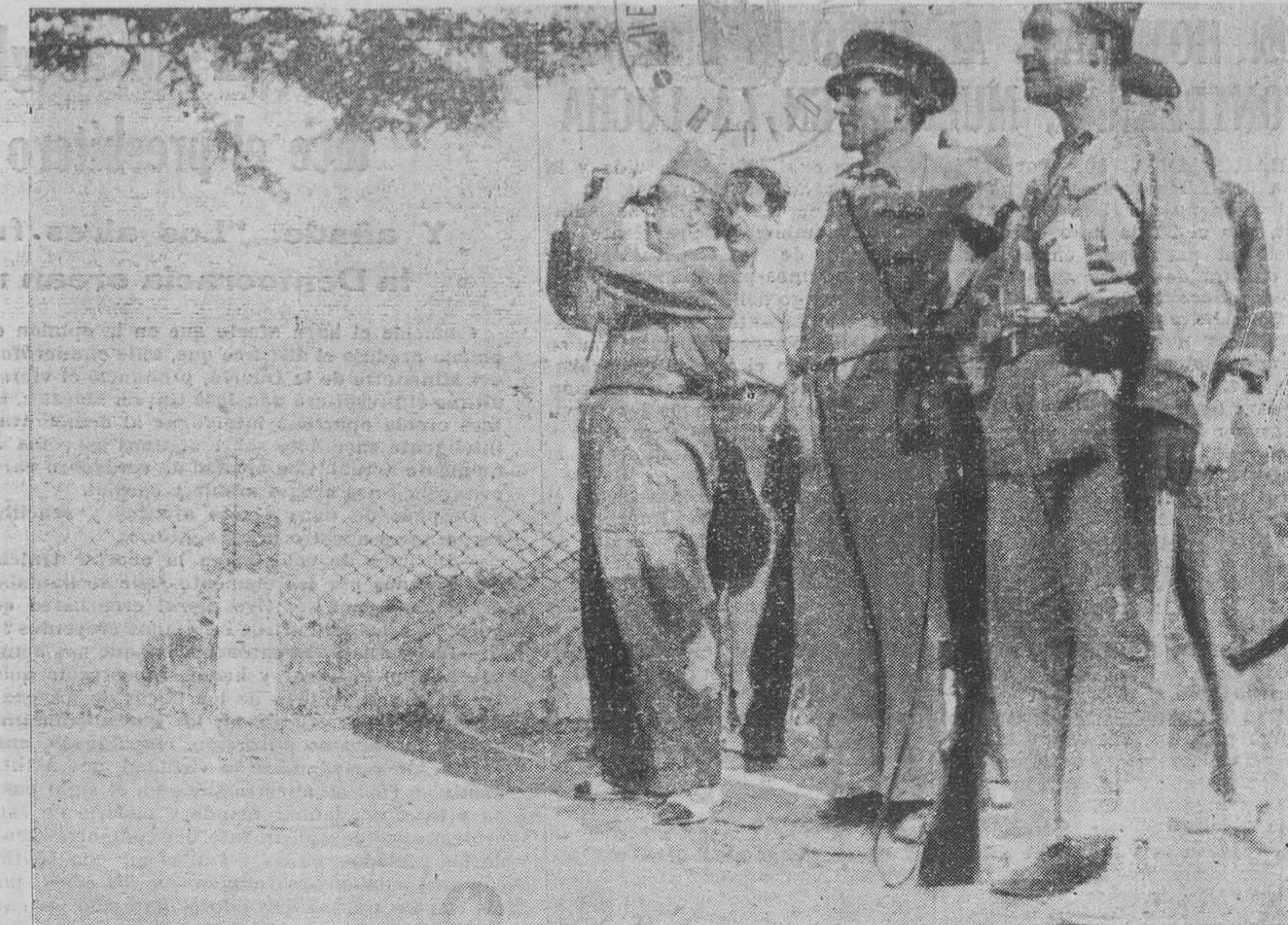
DEL FRENTE EXTREMEÑO.—El general Riquelme durante su visita al frente de Extremadura observa las operaciones de nuestras fuerzas.

Recogemos en esta doble plana gráfica algunos momentos interesantes que con su expresión revelan la actividad progresiva de las tropas que en defensa de la República dan cuanto puede darse, así como la respetuosa consideración de que es objeto España ante el mundo que mira a un porvenir más justo de la Humanidad