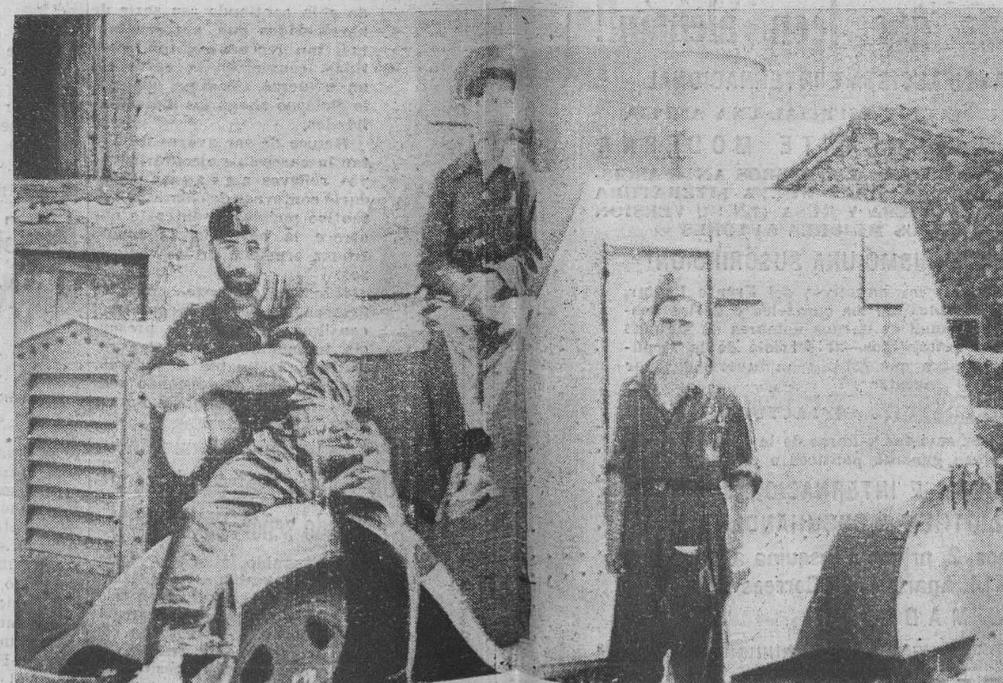
EN SOMOSIERRA.—El tanque blindado de la División General de Seguridad que primero entró en el pueblo de Gascones.