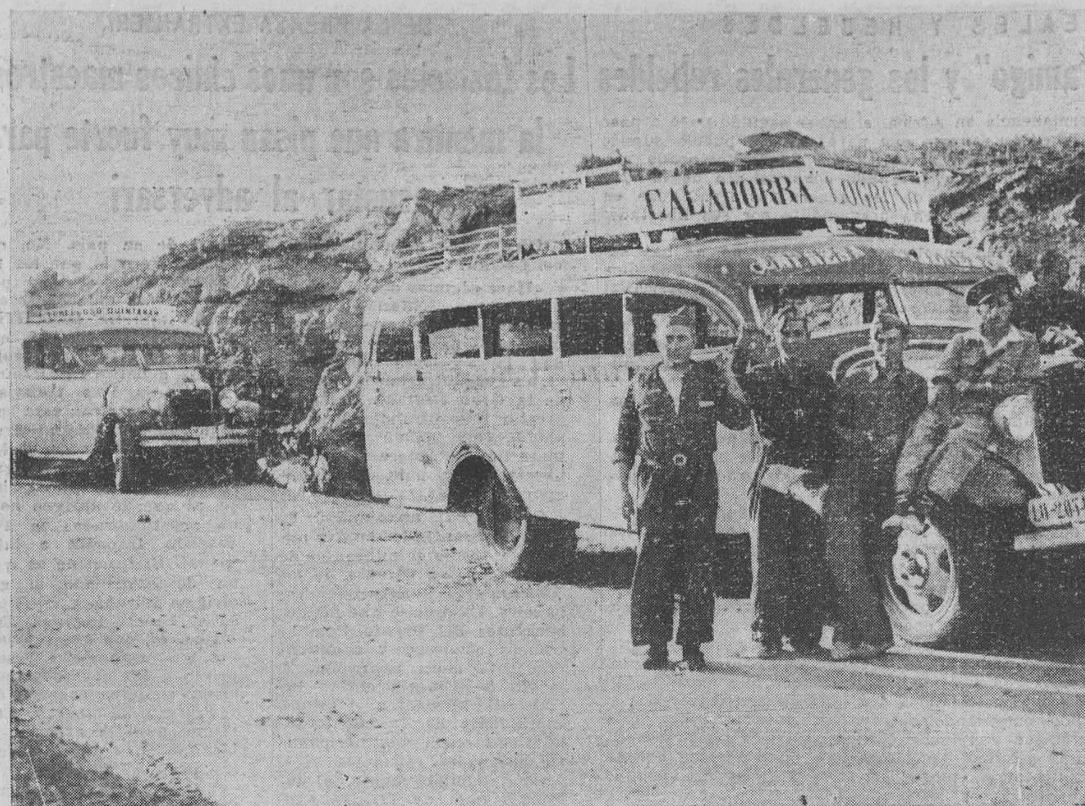
EN EL FRENTE DE SOMOSIERRA.—Auto de línea que fué cogido a los sublevados.