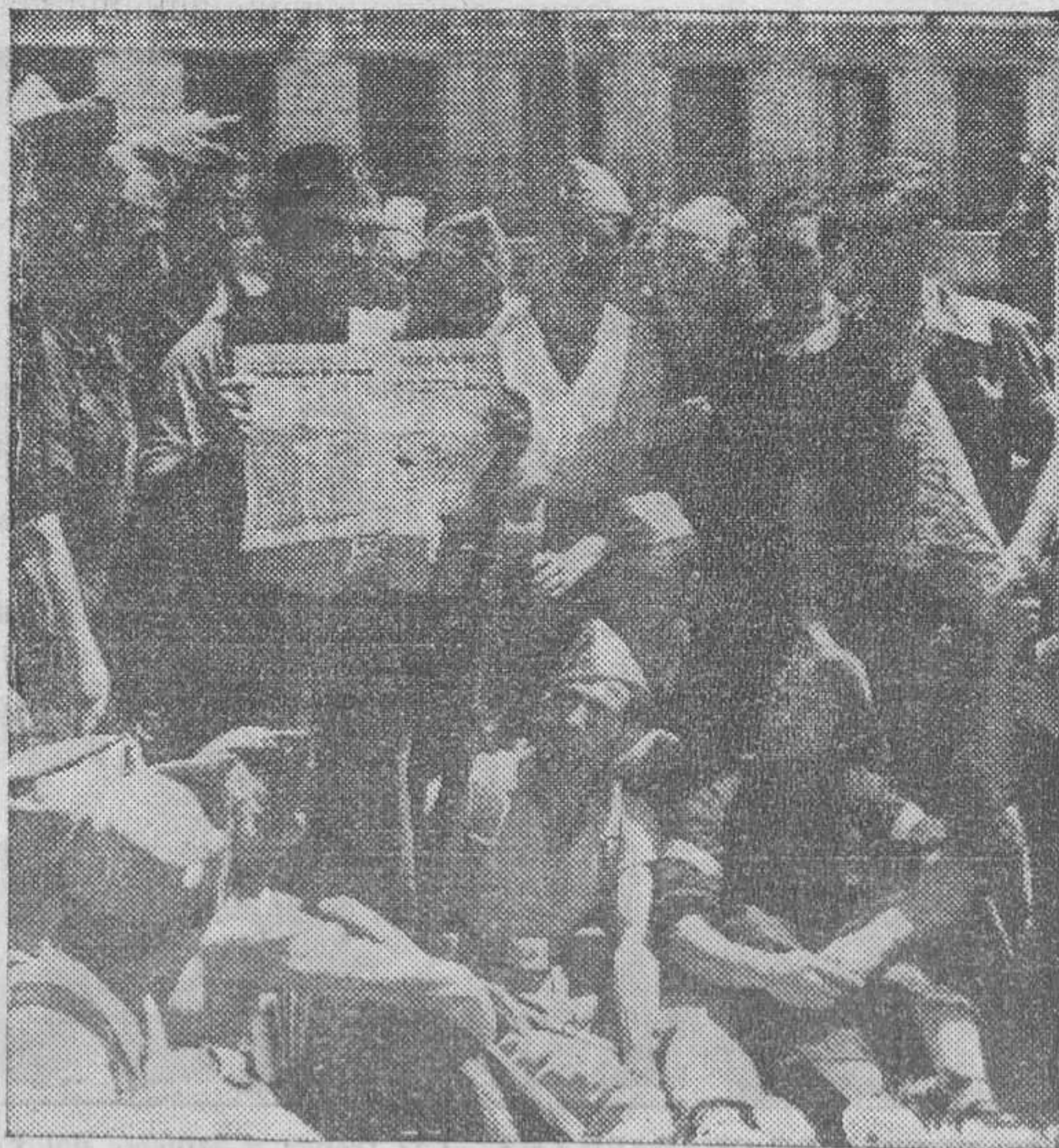
Los bravos milicianos que luchan en los distintos frentes editan sus periódicos. He aquí el momento en que un camarada lee para que le oigan los demás el titulado «Milicia Popular».