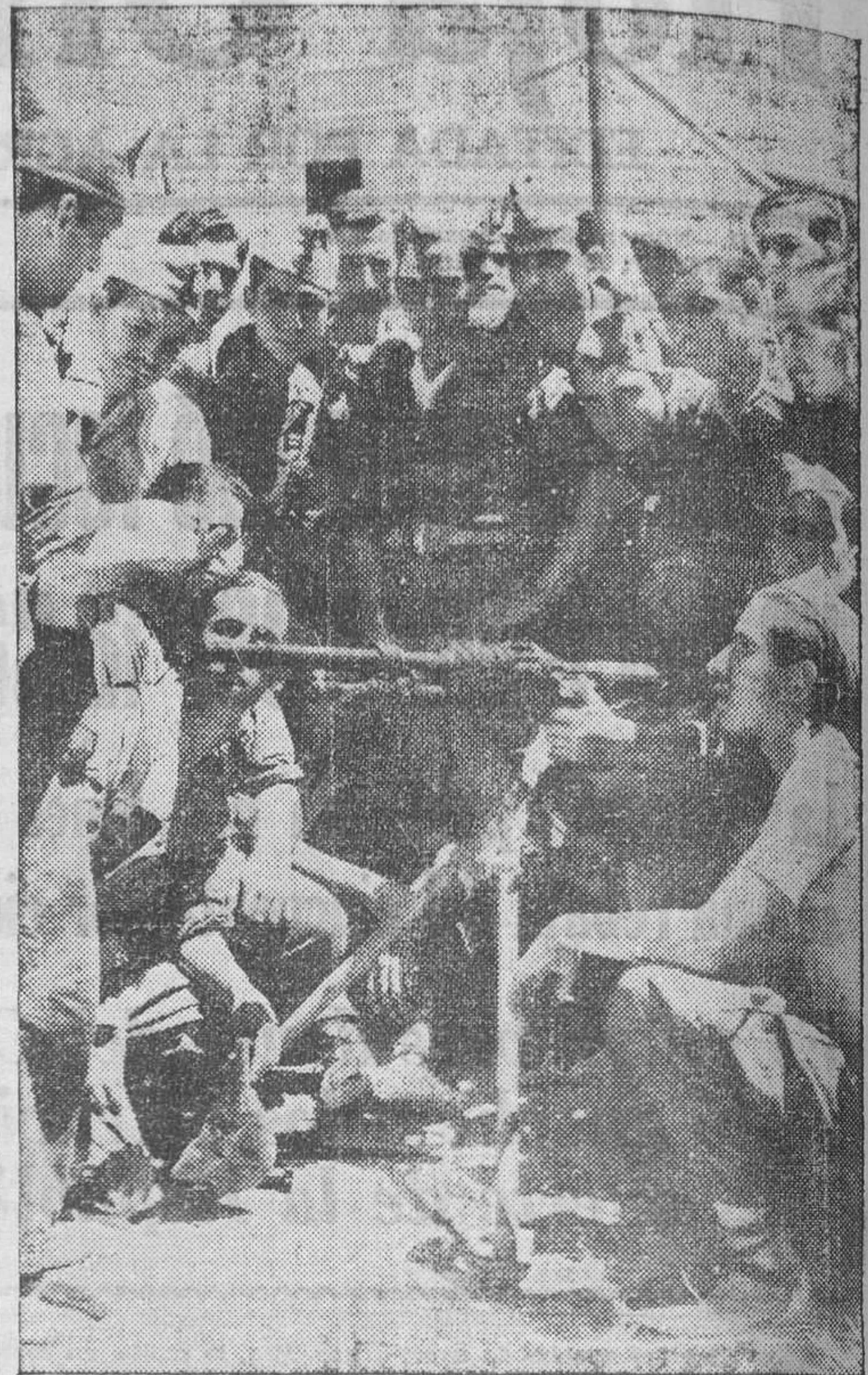
Los bravos milicianos se adiestran en el manejo de las ametralladoras.

Se recuerda por la presente nota a los almacenistas de artículos alimenticios de primera necesidad y de consumo indispensable la obligación de presentar diariamente, antes de las doce de la mañana, en el Negociado de Abastos del excelentísimo Ayuntamiento, las relaciones juradas de existencias, advirtiendo a los infractores de esta disposición que por la Alcaldía Presidencia se aplicarán las máximas sanciones,