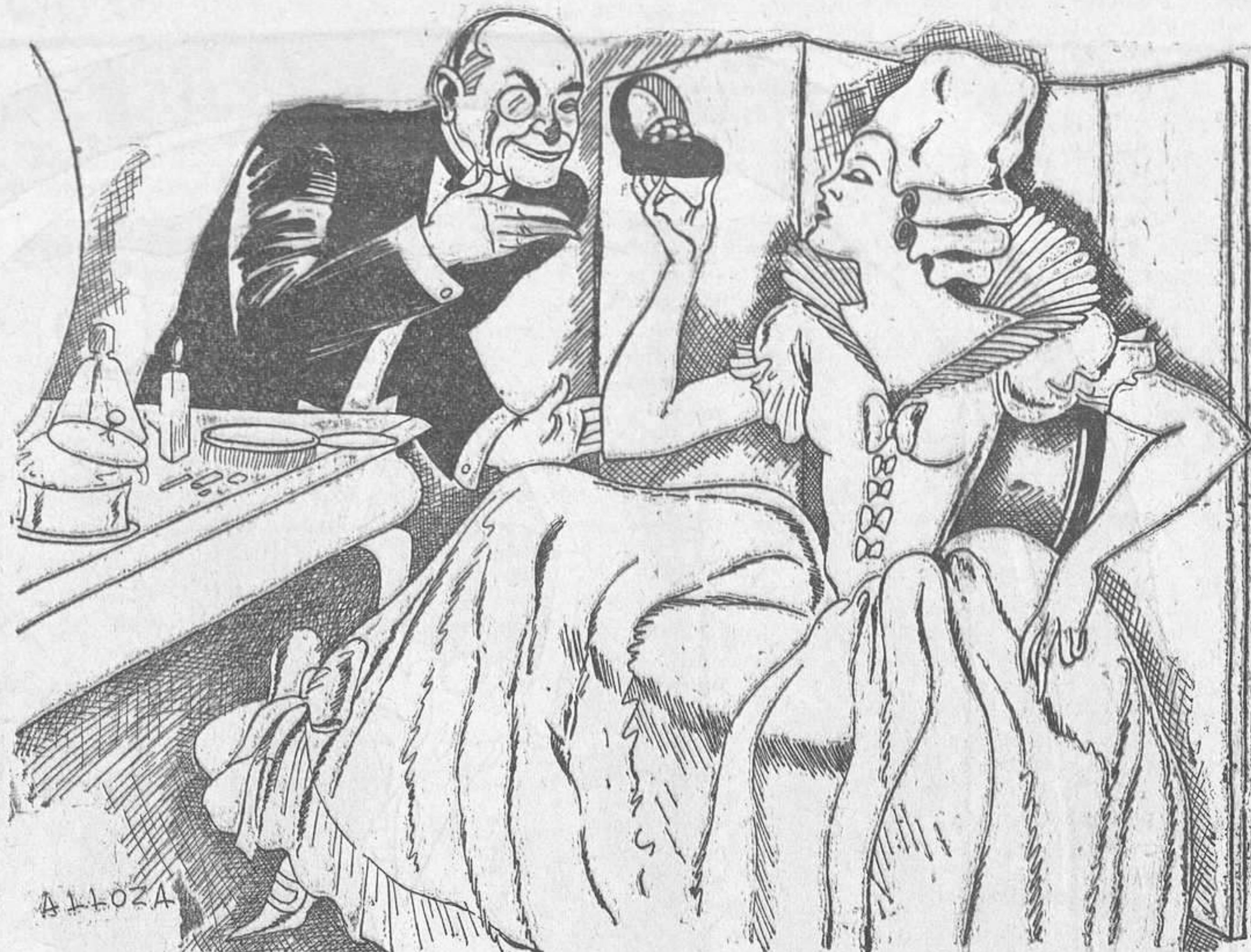
—Mira, noia: pren la bona voluntat. Jo volia comprar-te uns brillants grossos, però he hagut d'augmentar dos rals diaris els obrers de la fàbrica, que no es cansen de demanar!

Trist és confessar-ho, però mentre aquesta massa de cervell tancat i barrat domini a Castella, i a altres terres ibèriques, la pau serà impossible. La submissió que ells volen no l'aconseguiran ni a les bones ni per la força. Catalunya seguirà el seu camí, pesi a qui pesi i per damunt de tot. Els insults i les grolleries, les calúmnies i les injúries, les malifetes dels governs centrals, els moviments anti-republicans, provocats amb el mirallet anticatalà, són debades. Catalunya no retrocedirà un sol pas i anirà avançant. Però ens dol, com a homes nobles i de cor, que perduri en aquelles terres el poder borbònic que embena els ulls del poble. Cal destruir-lo, aquest malefici. I encara que sembli paradoxal, Catalunya, seguint el seu camí, escombra ensems els eternals prejudicis de Castella. Serveix d'exemple. Assenyala la ruta salvadora qu molts es disposen ja a seguir. Davant d'això, poden anar lladrant els gossos famolencs del borbònicisme.