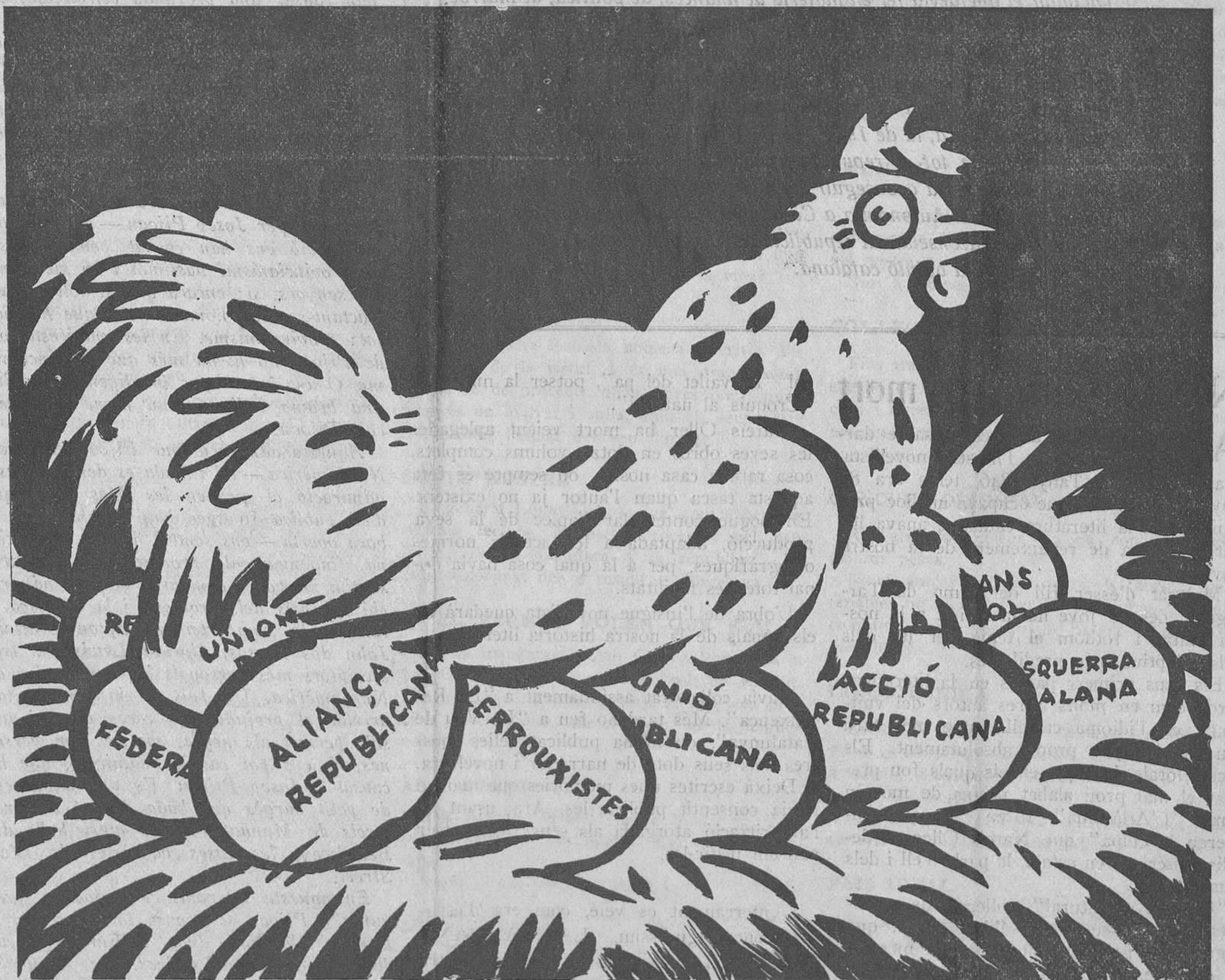
La llocada d'enguany

Mes el passat ja no té remei. Els fets són consumats. Els morts són ben morts. Cal només treballar per tal que semblants infàmies no tornin. És a la cosa única que podem aspirar. ANGEL PESTAÑA