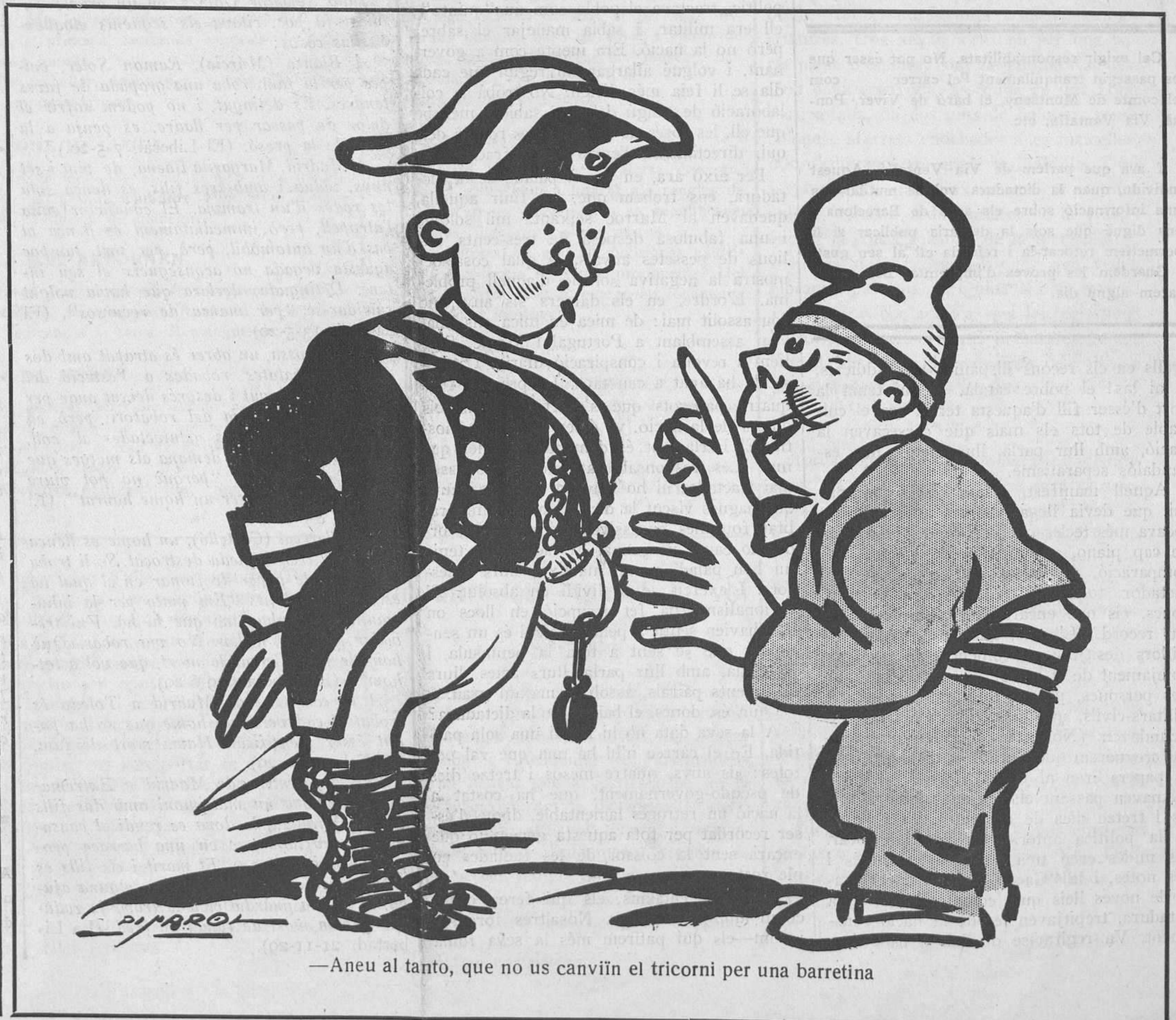
—Aneu al tanto, que no us canviïn el tricorni per una barretina