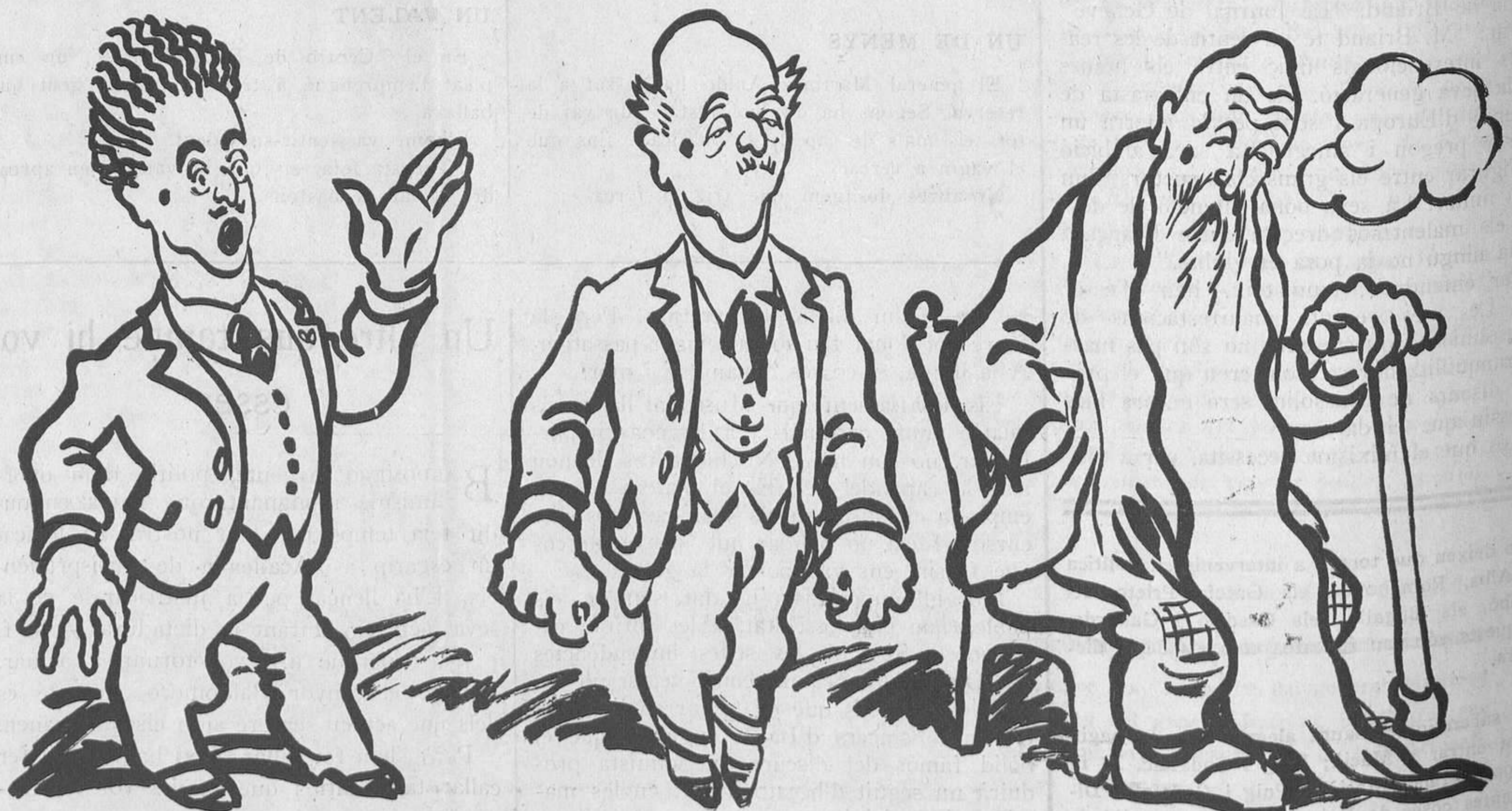
Les energies polítiques

Molts crits al començament, per acabar, quan s'és vell, no sentint-se'l ni del coll de la camisa