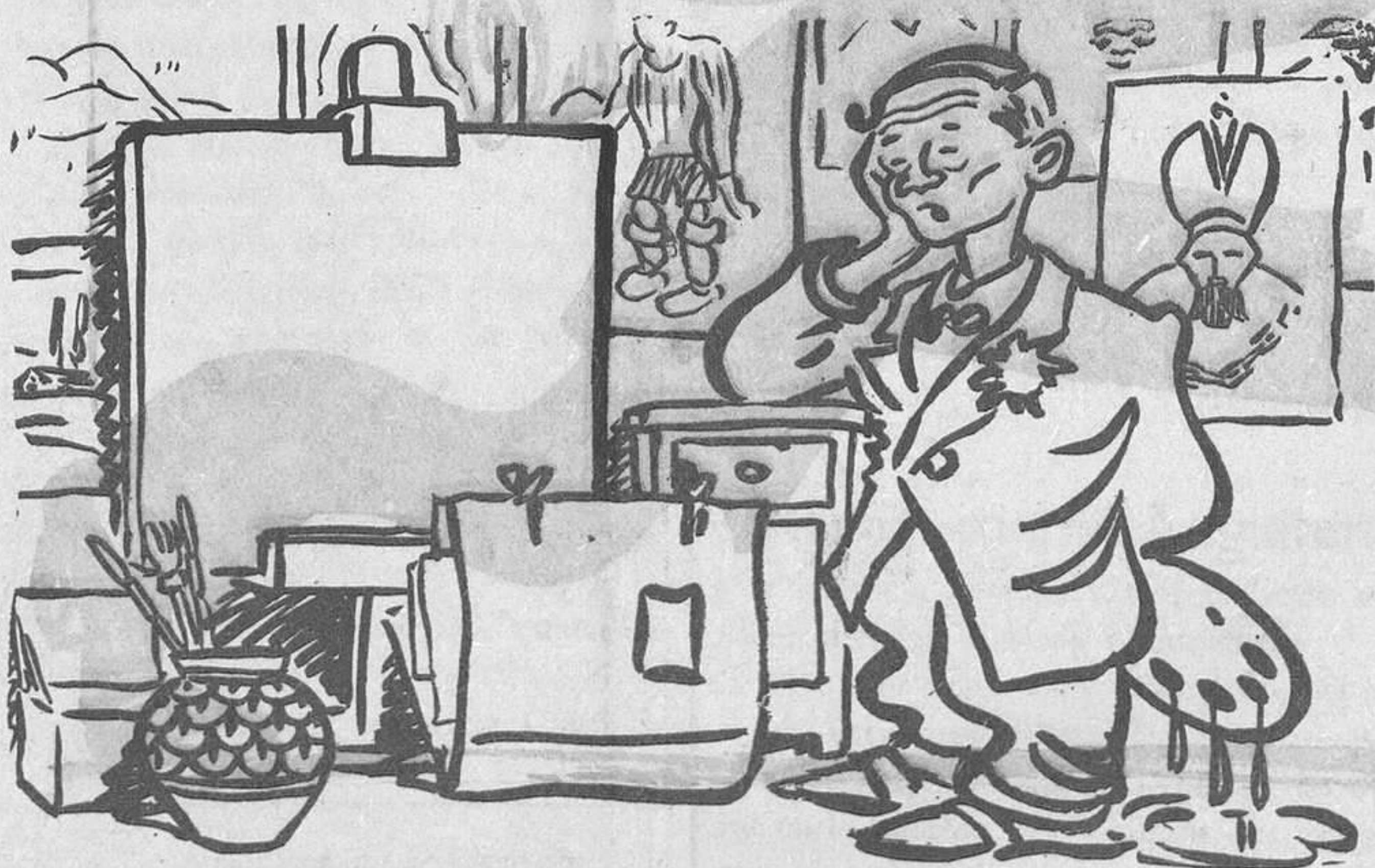
EL TURMENT DEL CARICATURISTA

La premsa de París dedica grans elogis a la nostra jove artista—no per jove menys gran—i fa remarcar molt especialment les seves brillants facultats creadores.