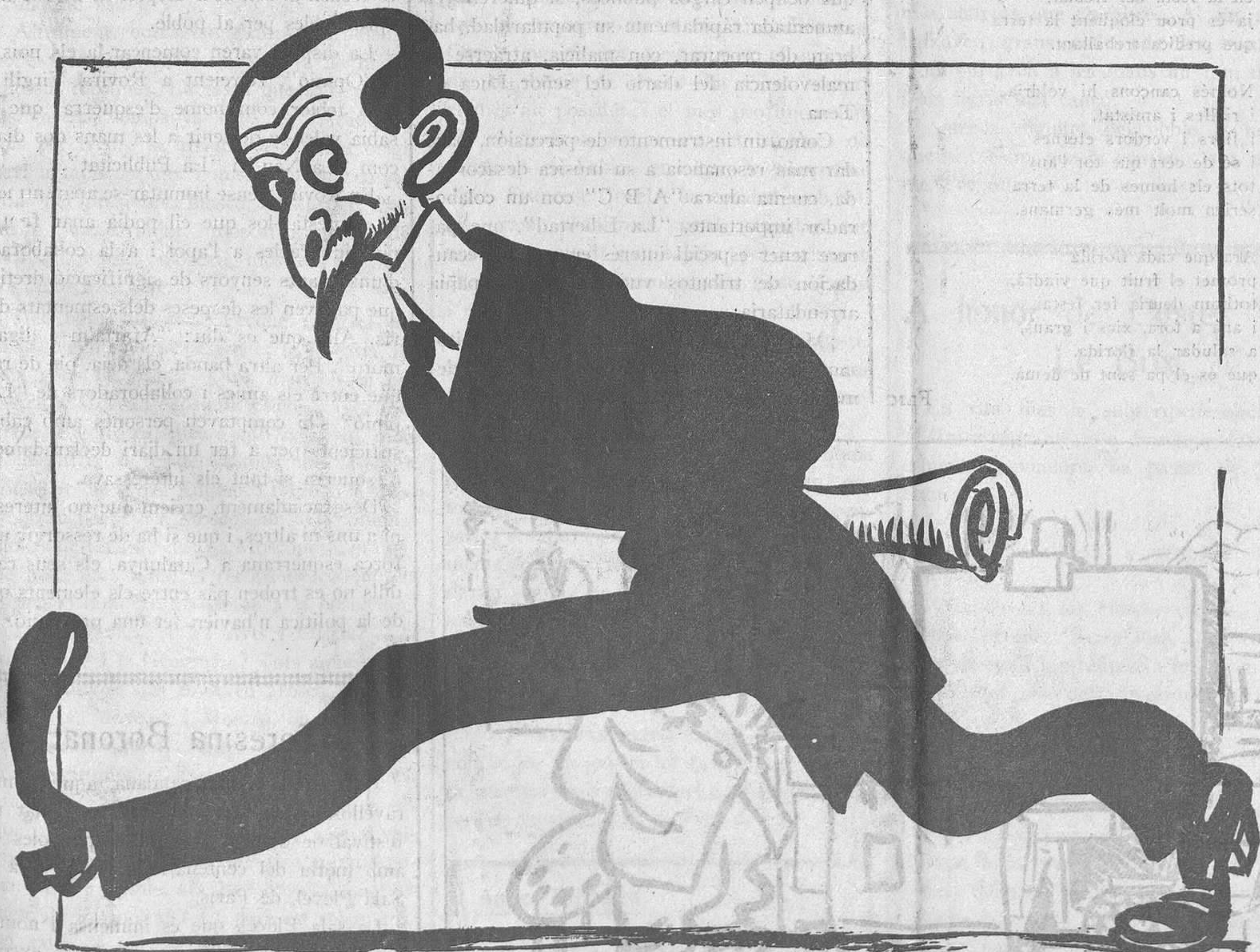
EL VIATJANT DE CASA

Londres,... Paris,... Reus,... Madrid,... — Això, no és un home, això és un vagó.