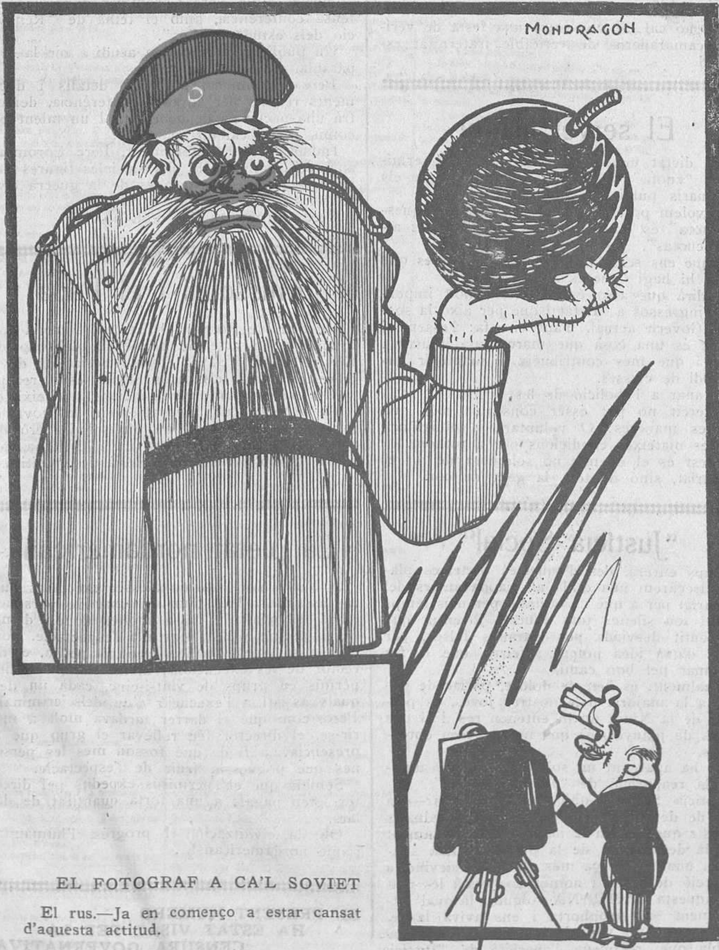
EL FOTOGRAF A CA'L SOVIET

El rus.—Ja en començo a estar cansat d'aquesta actitud.