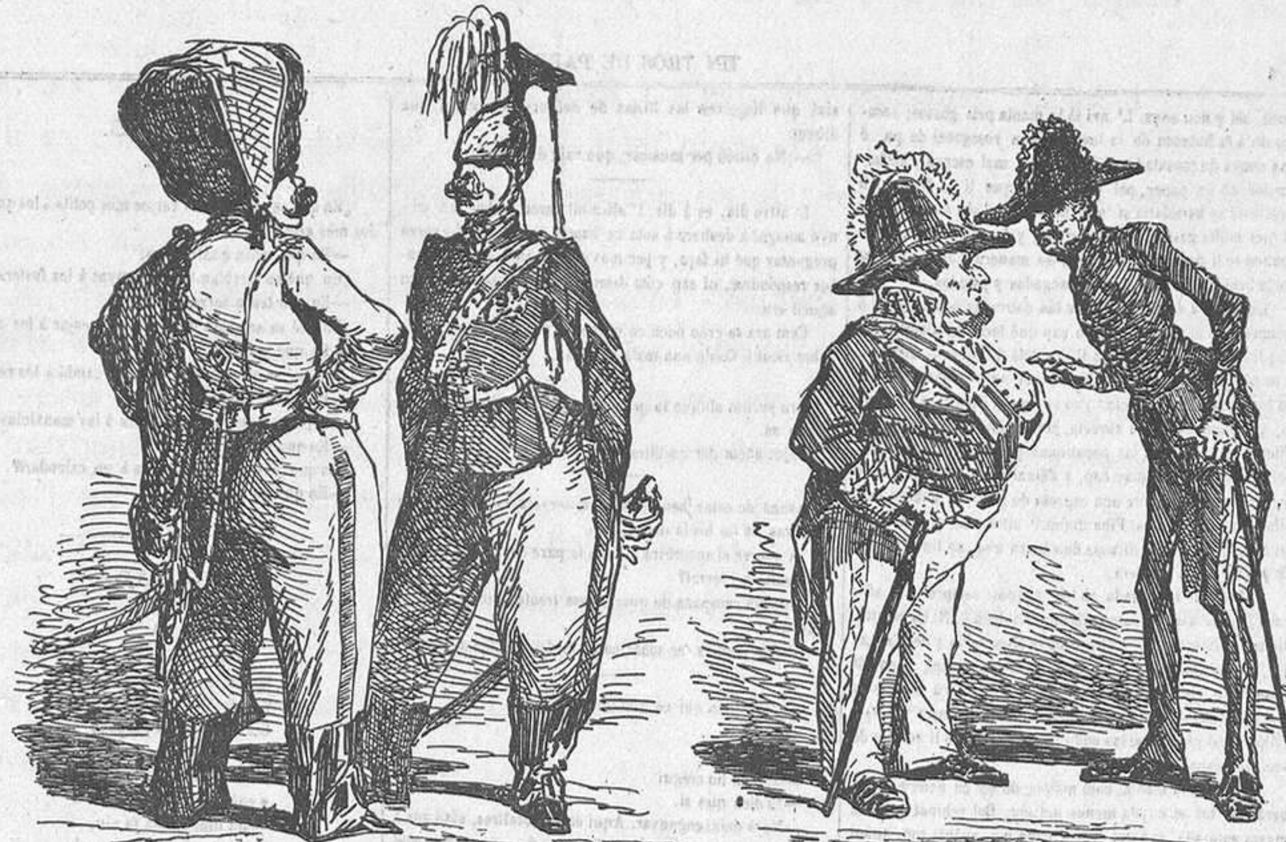
— Amigo Guevara, contempla la forma de mi chapeau. — Y la del mio Lopez. Uno por carta de mas, otro por carta de menos.