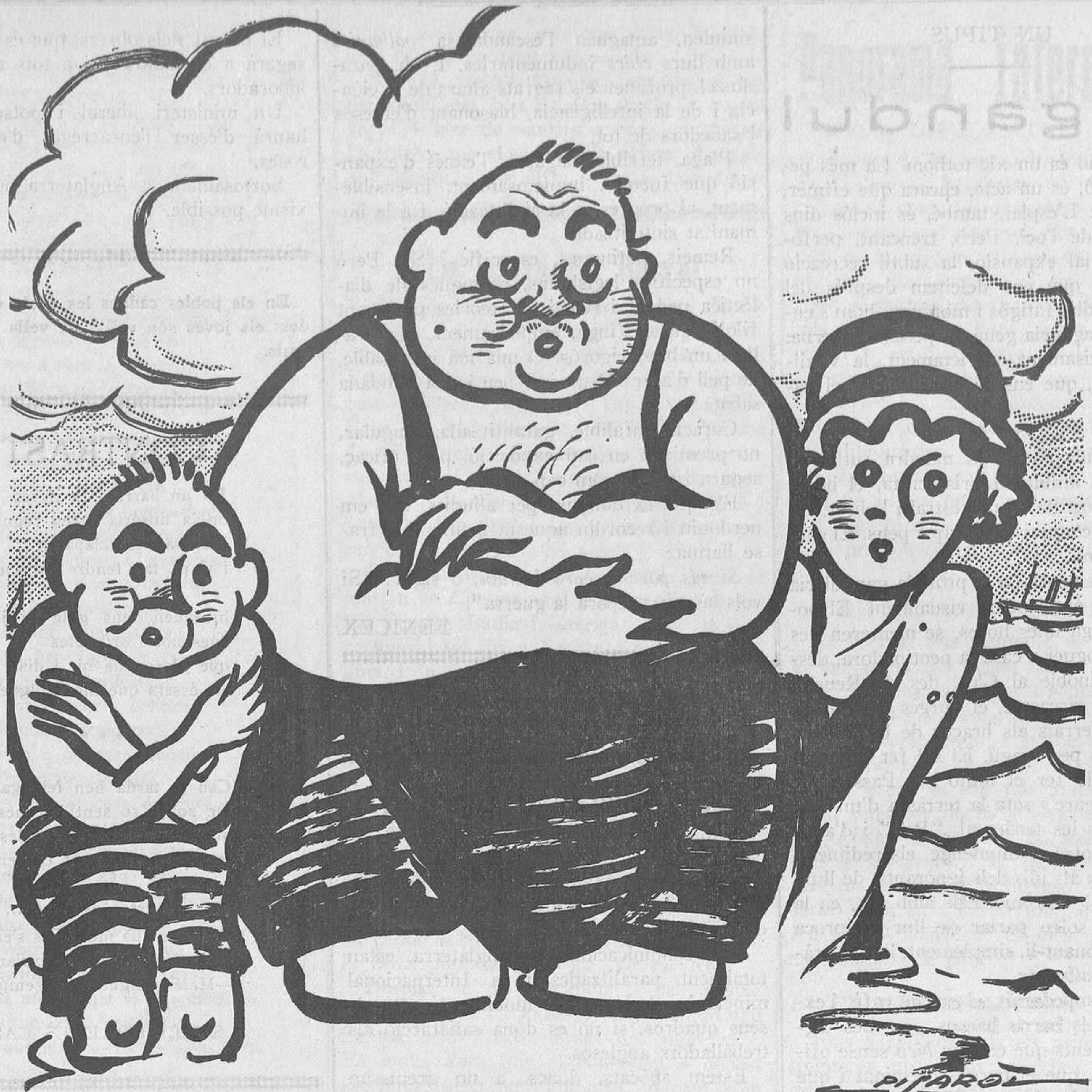
BANYISTES DE TOT L'ANY

Impremta LA CAMPANA i L'ESQUELLA Olm, 8 :: Ciutat