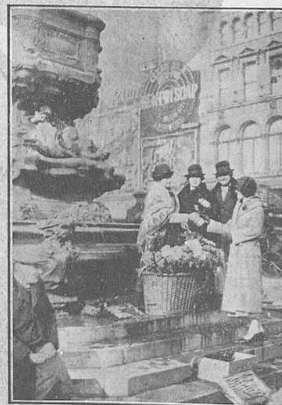
El mercat de flors a Picadilly

per a freqüentar el Covent Garden, ni l'Alambra, ni els Tea Room de Picadilly. En canvi teníem una diversió barata: sortir a veure el mercat de flors, sortir a prendre el sol... Perquè a Londres—com poden veure per l'adjunta fotografia—també hi ha sol, també hi han flors.