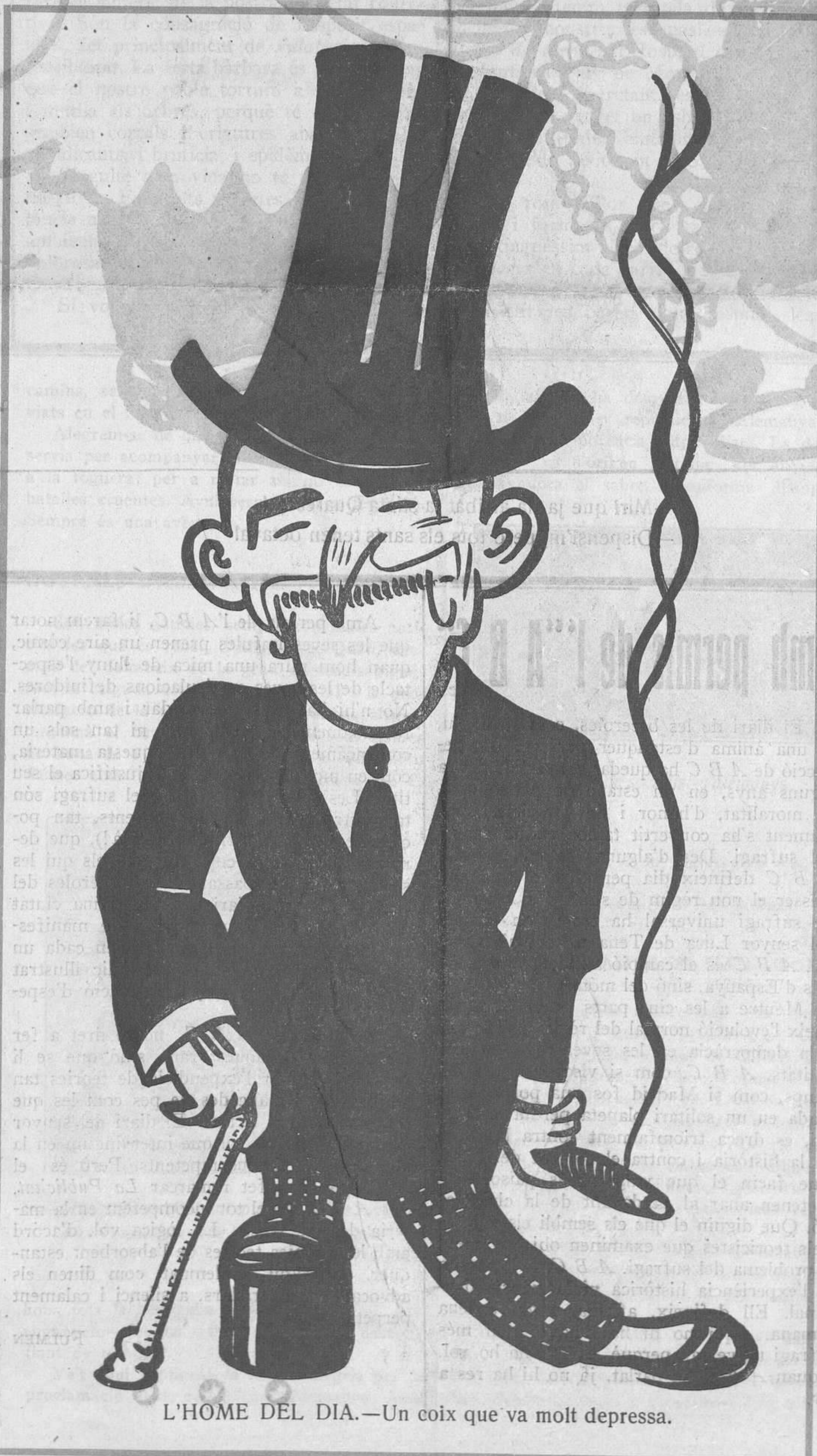
L'HOME DEL DIA.—Un coix que va molt depressa.

Entenem que davant de la dictadura poden parlar els ideals. La cosa difícil és que puguin parlar amb èxit els polítics que, ni en el Govern ni en l'oposició, han tingut mai cap ideal, com no sigui el de la simple