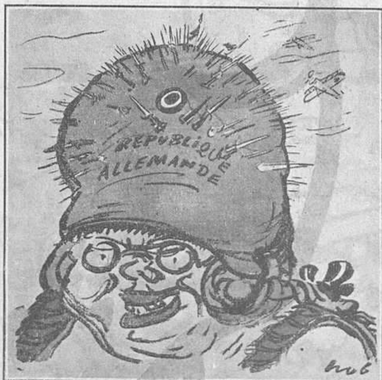
Això fa pena! Pobra república boche, aviat no en quedarà res de la teua gorra frígia!

Són males notícies, sempre són males notícies les que es reben d'Alemanya. Quan, després del daltabaix de la gran guerra, sapiguérem la caiguda del funest Guillem II i la proclamació de la república, una profunda alegria omplènà el cor nostre. Nosaltres som homes de bona fe i bona voluntat i ens enorgullim d'ésser així. Val més ésser bo i creure que és