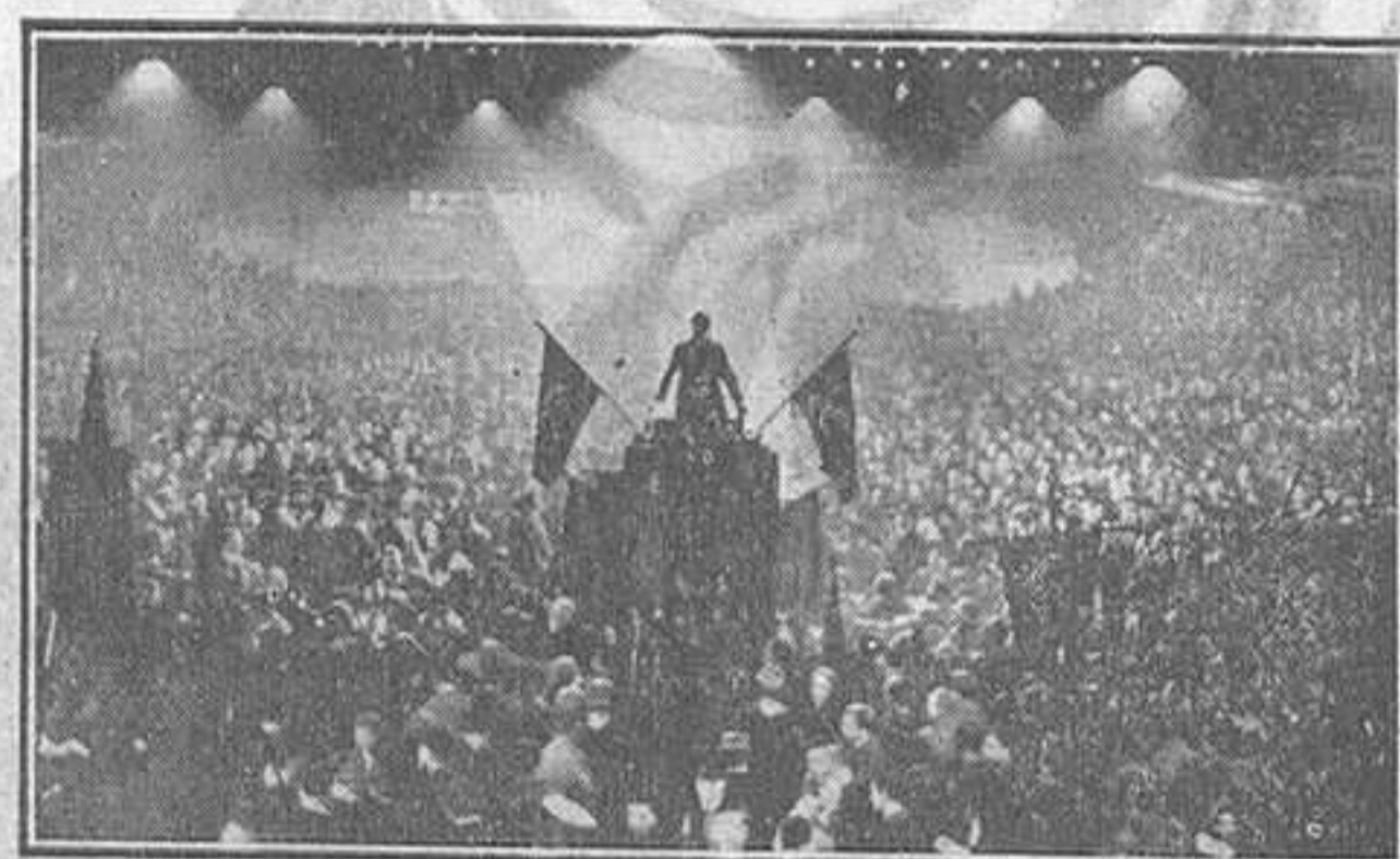
Un miting de socialistes alemanys

aquesta alegria ha desaparegut. Alemanya no sap, no pot ésser republicana. Alemanya és, per essència i potència, imperialista. La democràcia no és d'origen teutònic. Per això Alemanya adora el sabre, l'uniforme llampant,