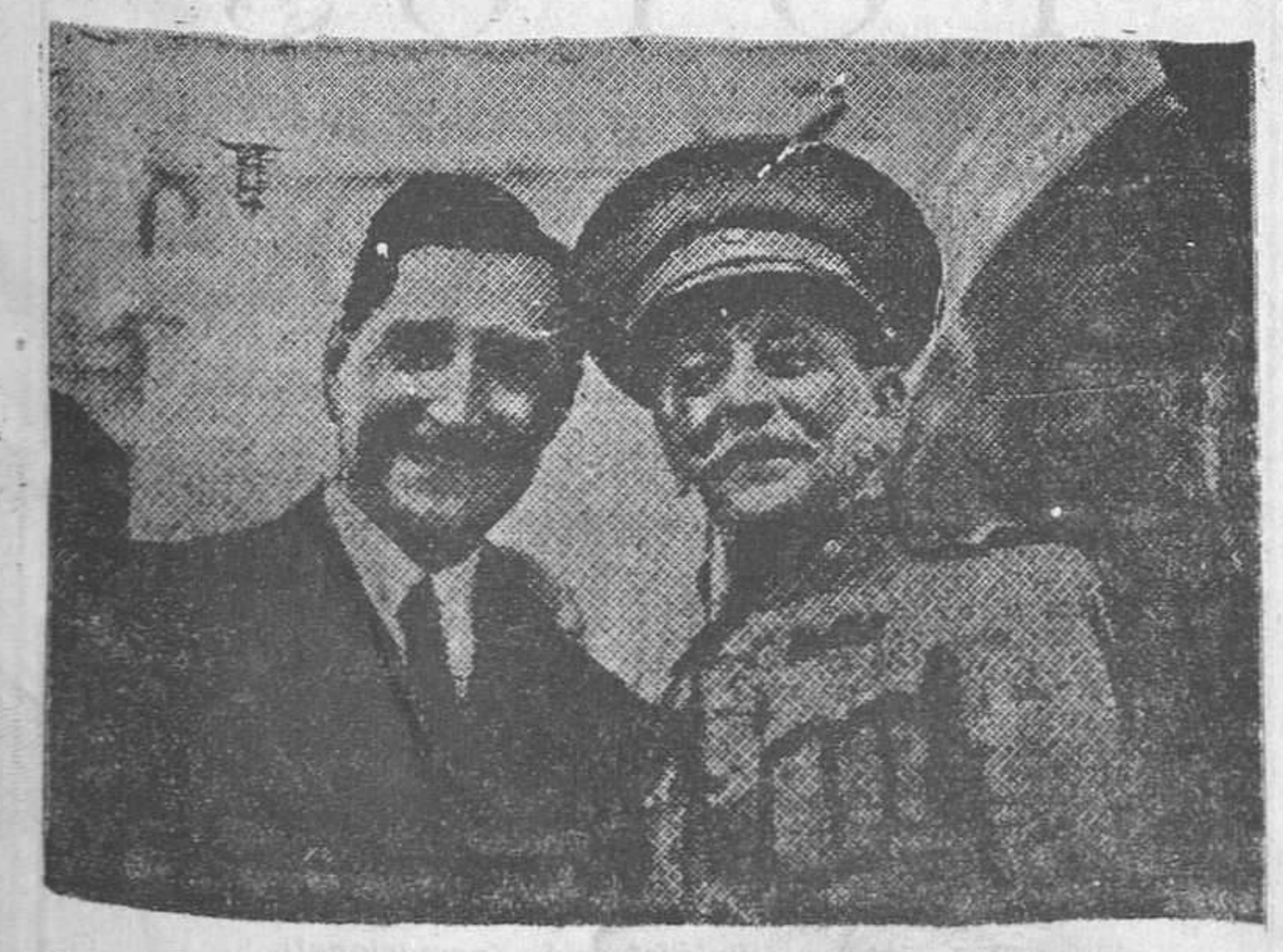
Carmona y Oliveira Salazar sonríen satisfechos contemplando el desfile de la «Mocidade portuguesa»

Portugal celebra el XI aniversario de su revolución nacional