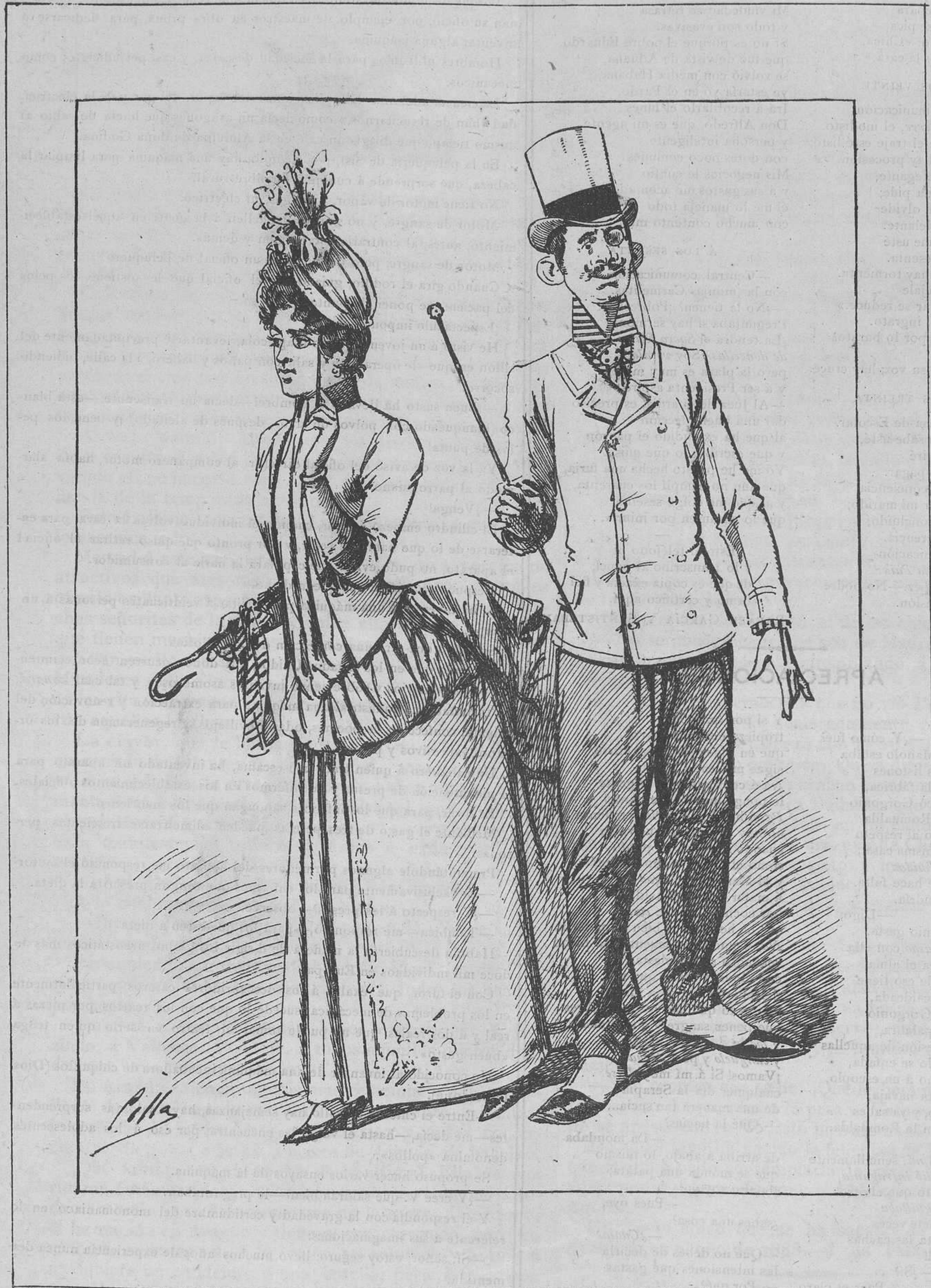
¡Y luego hablamos de los cursis!