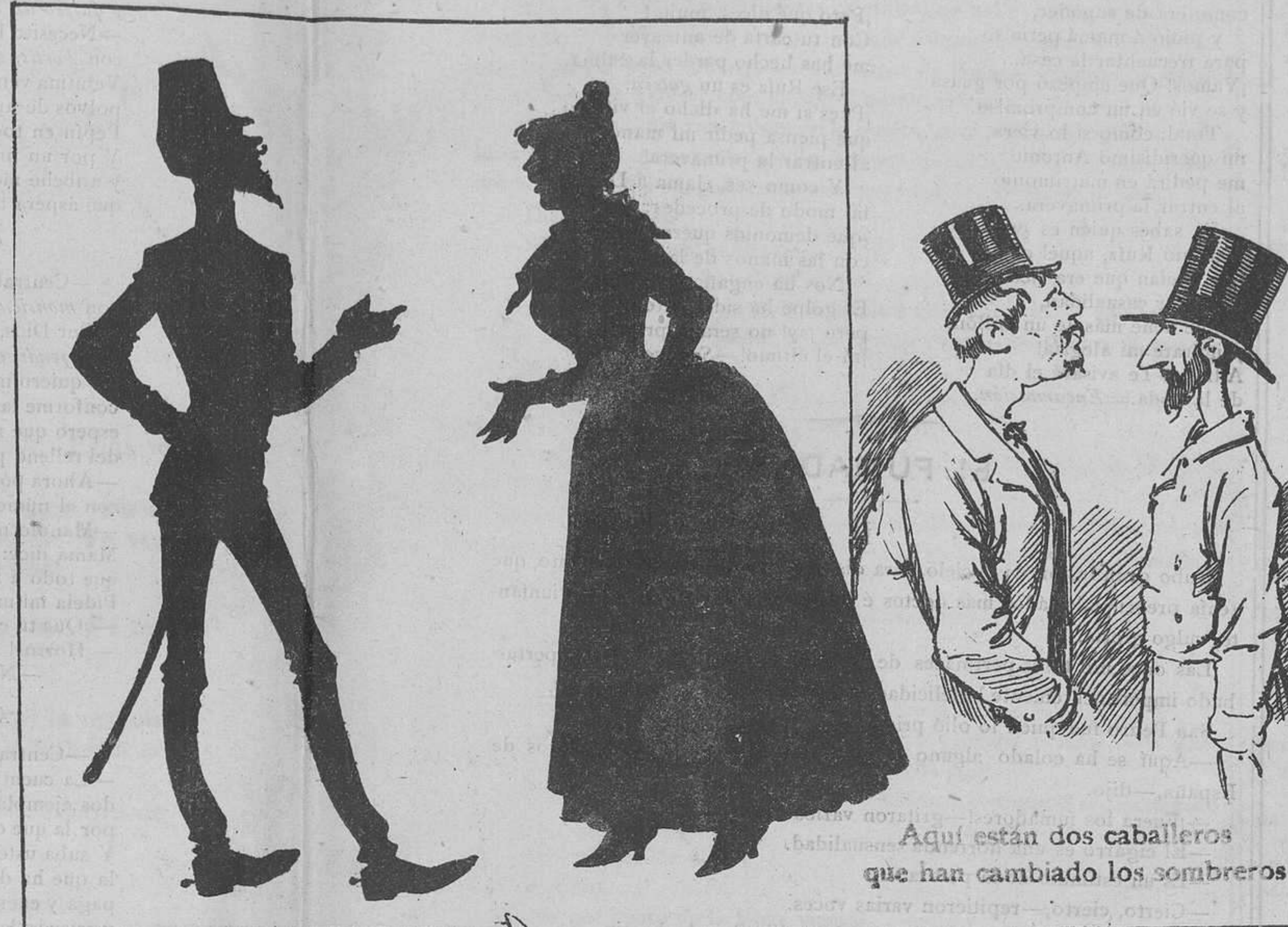
Aquí están dos caballeros que han cambiado los sombreros.

—La señorita dice que no puede recibirle esta noche. —¿Y tú? ¿Puedes?