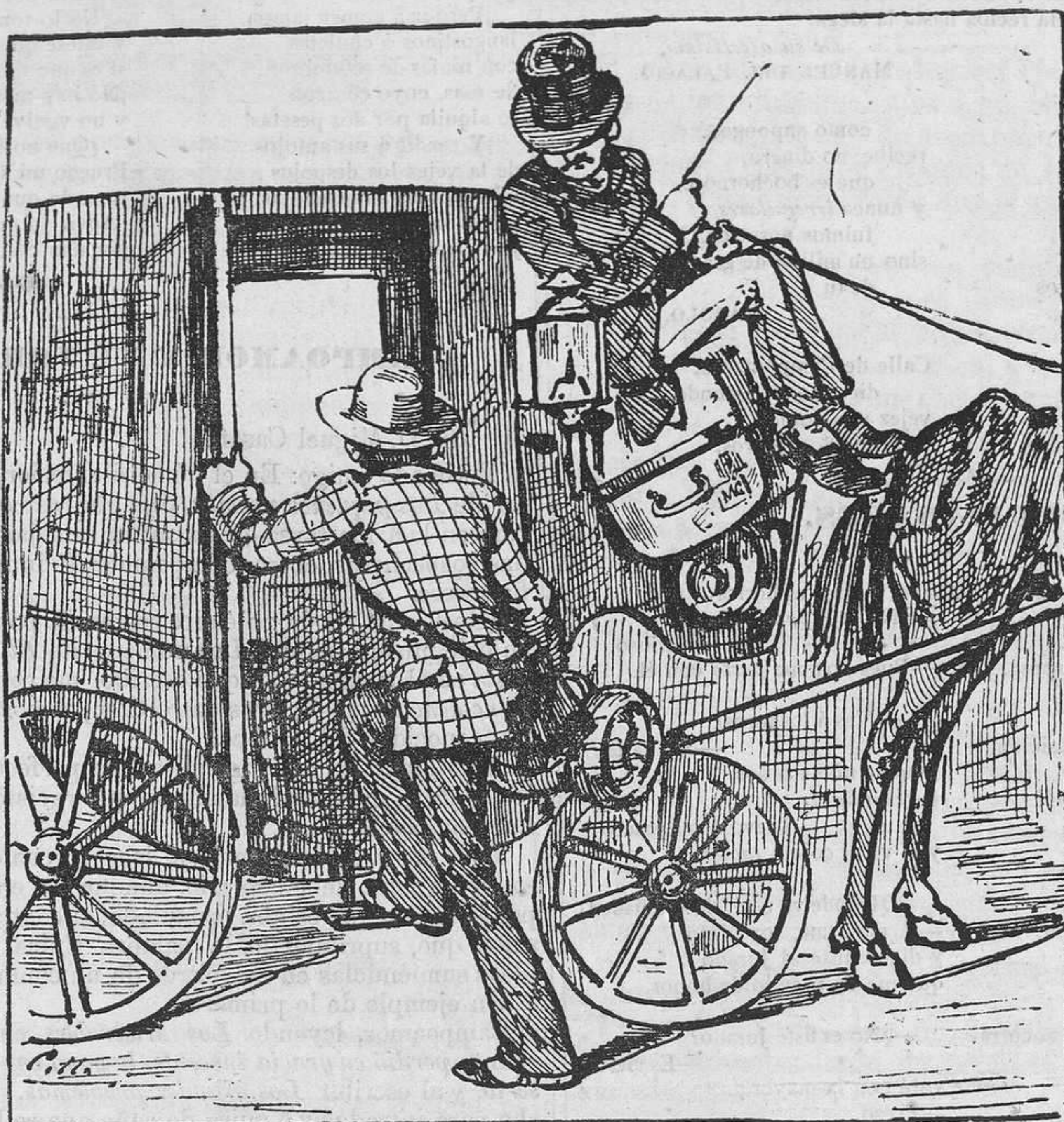
¡Cocherol! A escape á la estacion del Norte.

con el buril del ritmo le dá la forma conveniente, resultando de esta faena, que parece mecánica, pero que no lo es, una verdadera obra de arte. Héla aquí: