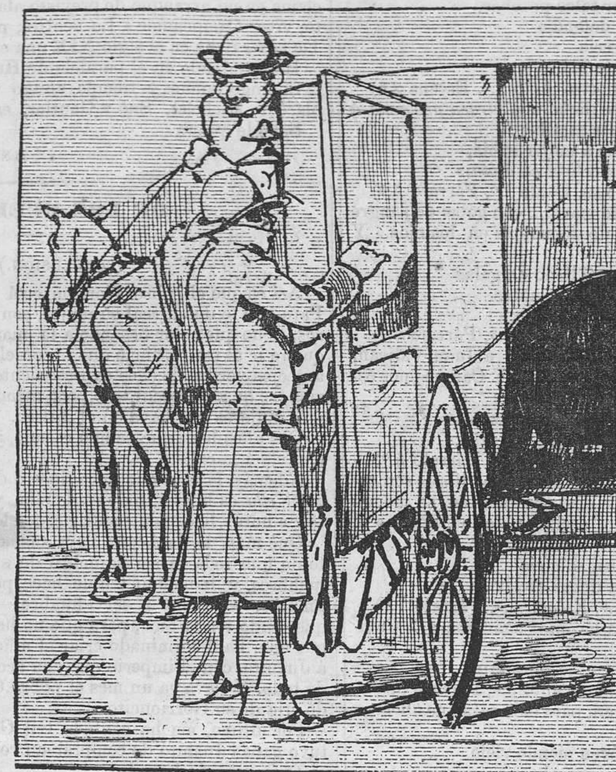
¡Cocherol! Por donde tú quieras, pero despacito.

«... que es el cansancio material un hilo que tira de nosotros hácia el sueño.»