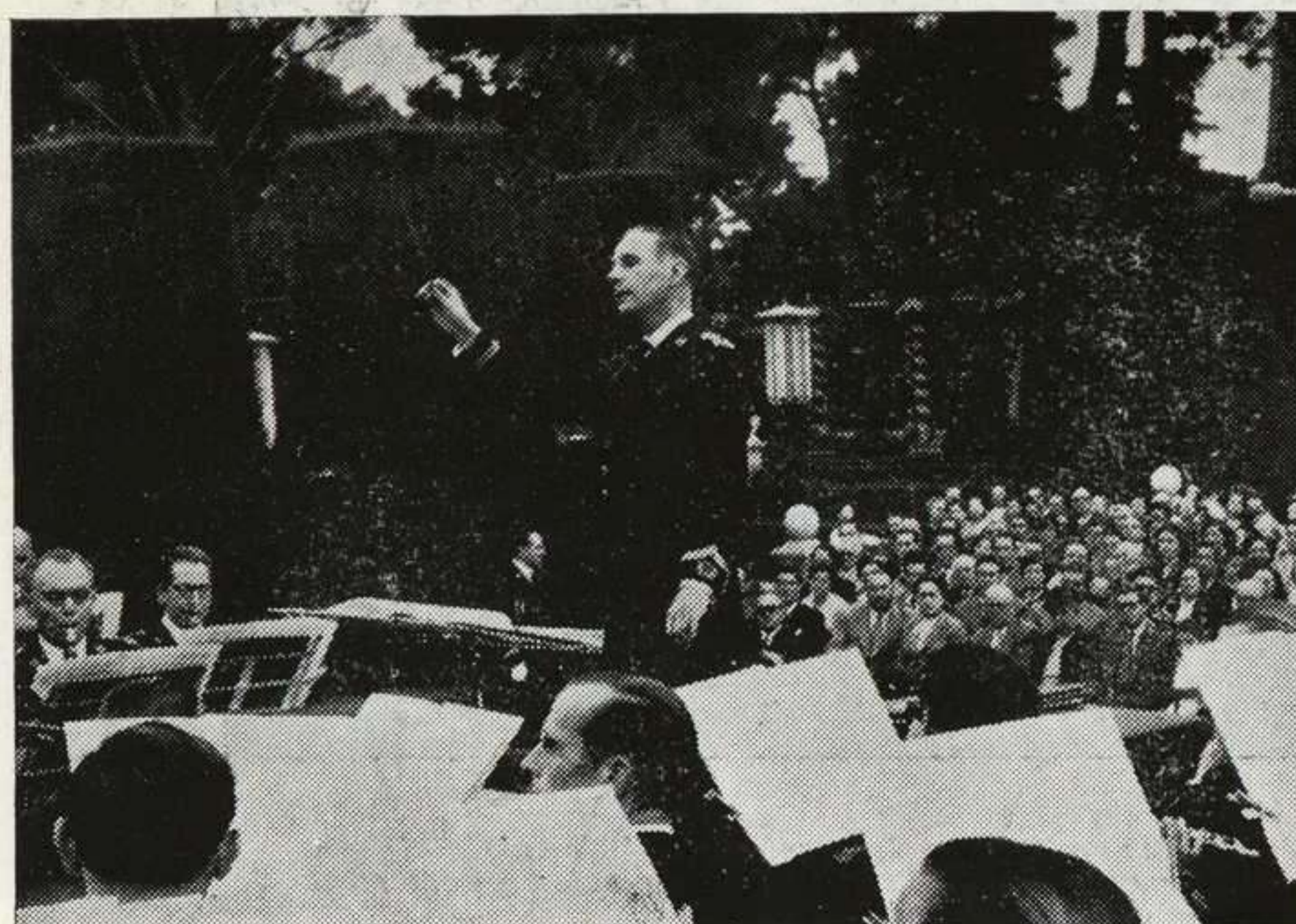
Un instante del concierto de presentación.