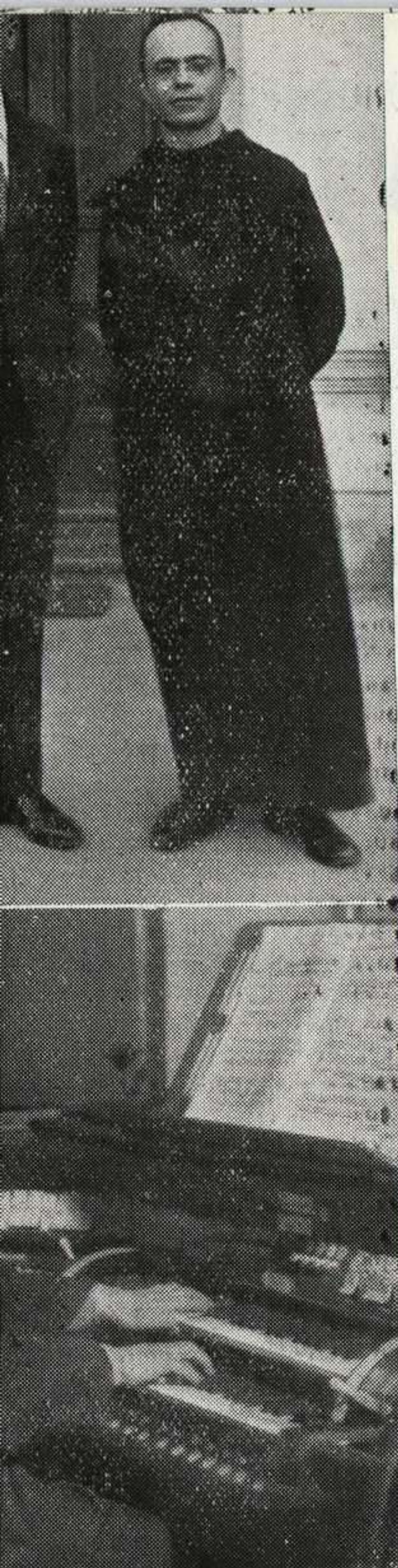
Tomada con ocasión de la visita de este al New Norcia, en el año 1928, en que hizo «tournées» de conciertos por Australia.

Abajo.—El célebre compositor español ante el órgano que él mismo instaló en la iglesia abacial de New Norcia.