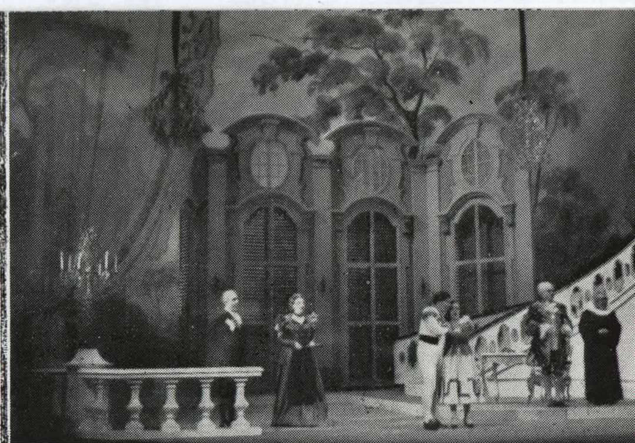
Una escena de Las bodas de Figaro, a cargo asimismo de la Opera de Stuttgart durante su actuación en París.

que también poseen sus principales colaboradores.