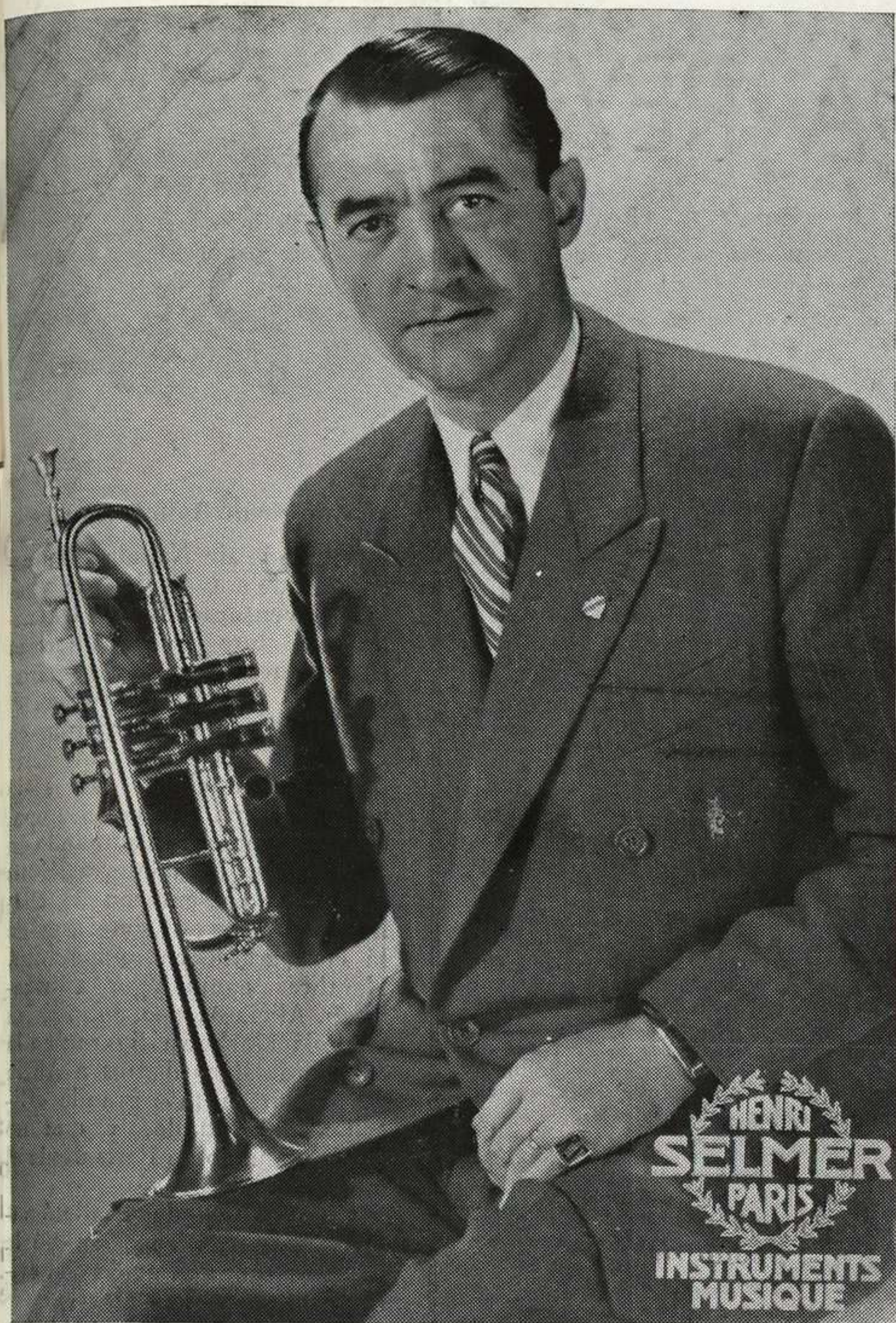
El autor del presente artículo, Profesor de Trompeta del Conservatorio Nacional de Música, de París.

Instrumentación muchísimo más cargada de dificultades para todos los afiles, y no se pueden comparar las obras modernas con las del siglo anterior.