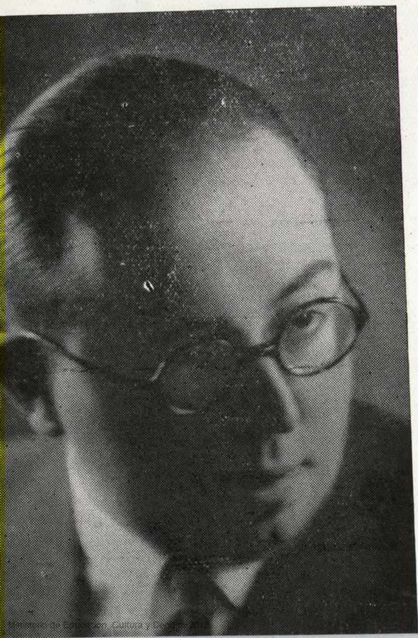
El maestro Santiago Baranda Reyes, concertista, compositor y pedagogo uruguayo.