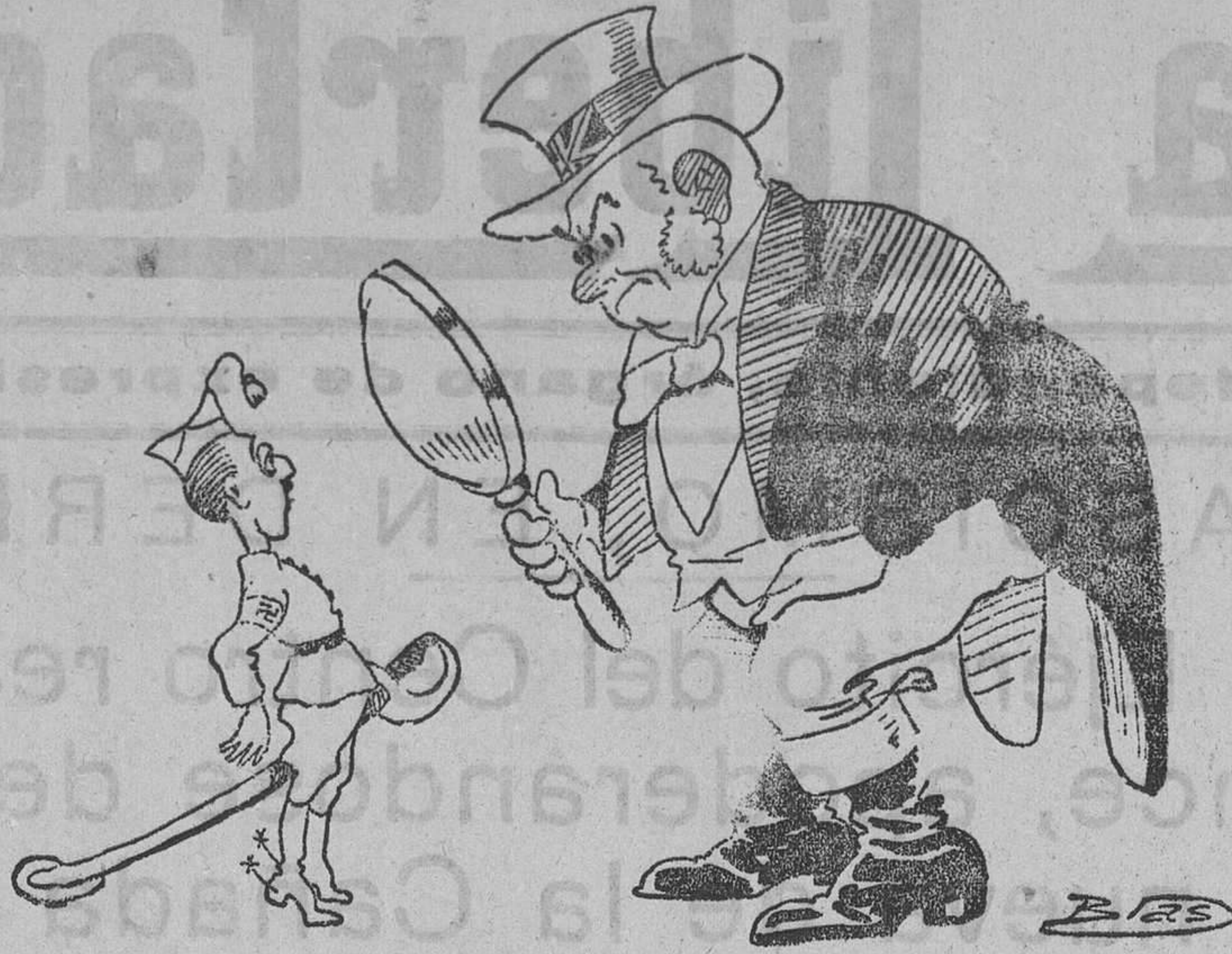
¡AUN HAY CLASES!, por Blas Franco.—Pero, ¿no me reconoce? John Bull. —¡Cal Tú no eres español.

La lectura de estas cuartillas fue acogida con una clamorosa ovación y estruendos vivas.