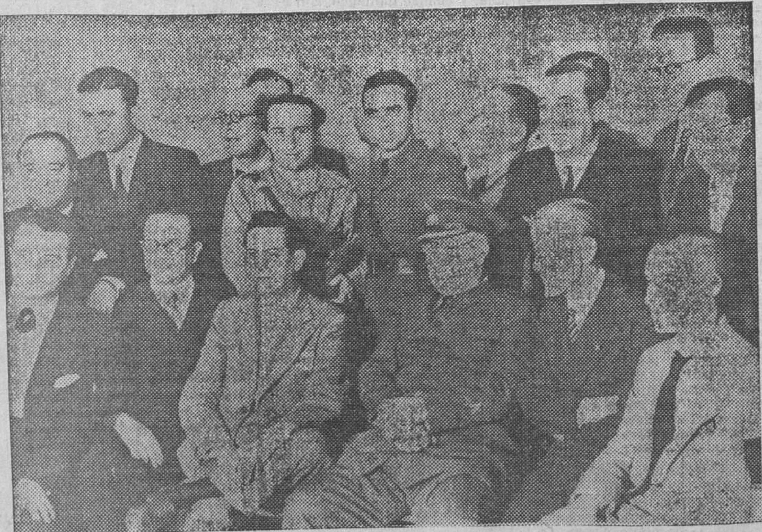
El heroico defensor de Madrid, general Miaja, rodeado de los periodistas a quienes obsequió con una comida con motivo de la concesión de la laureada al ilustre caudillo

El alcalde justifica la medida en una contravención de las disposiciones sanitarias, y su decisión ha causado gran satisfacción entre los metalúrgicos huelguistas.