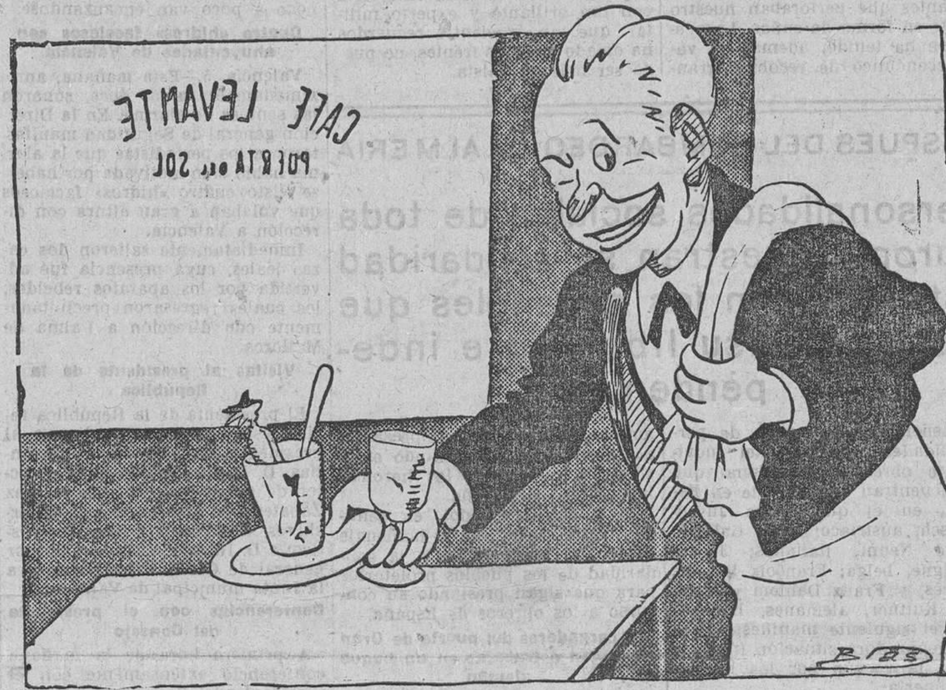
RETIRANDO EL SERVICIO, por Blas —Se marchó sin tomar el café...

A primeras horas de esta madrugada se presentaron en el puerto los seis tripulantes de un pailebote rápido de la matrícula de Valencia, quienes comunicaron que a la altura de Calpe, y cuando iban camino de Villajoyosa, les dió el alto un submarino de nacionalidad desconocida, que les obligó a abandonar el barco, y siguieron la marcha en un bote. Una vez que se elejaron un poco en su pequeña embarcación, vieron cómo el submarino disparaba varios cañonazos sobre el pailebote hasta que le dejaron envuelto en llamas.