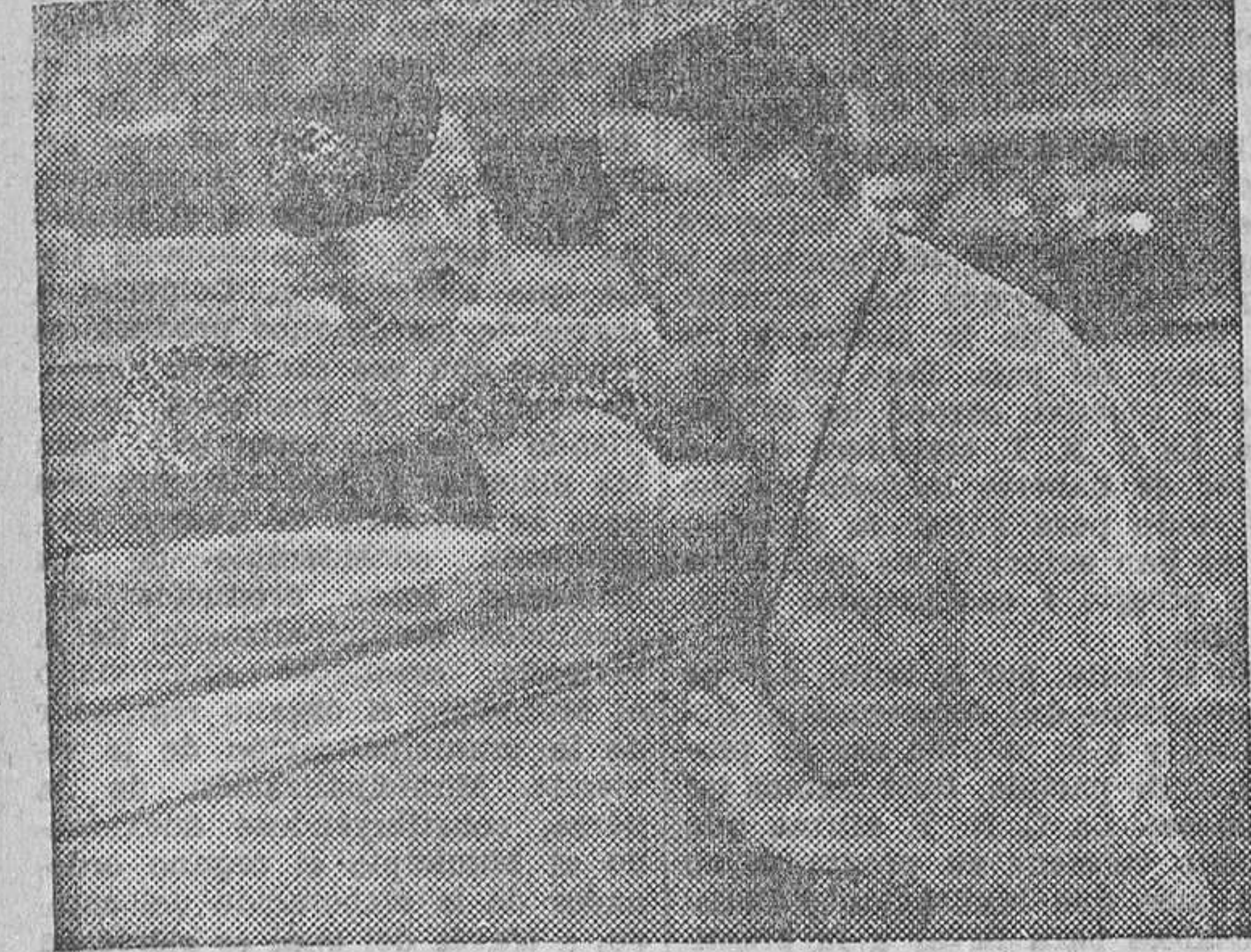
Una escena de la película «Al compás del corazón», que mañana se estrenará en el cine Avenida

Tanto uno como otro caso no representan peligro serio todavía; el momento álgido pasó; aquel instante heridos que nos devolvían los frentes de lucha.