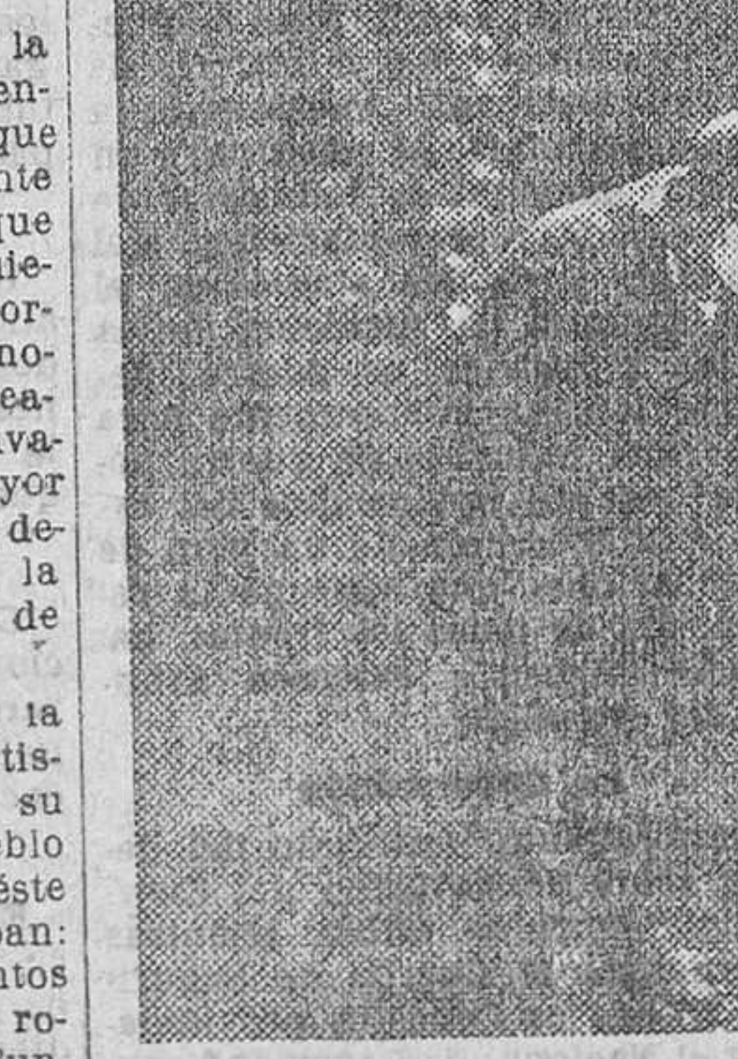
Una escena de «Inferno negro», film de gran éxito que mañana se reestrenará en el Progreso

Todo ello sin contar con que la mayor parte de los asistentes a estos festivales no lo hacen guiados por el noble impulso de alle-