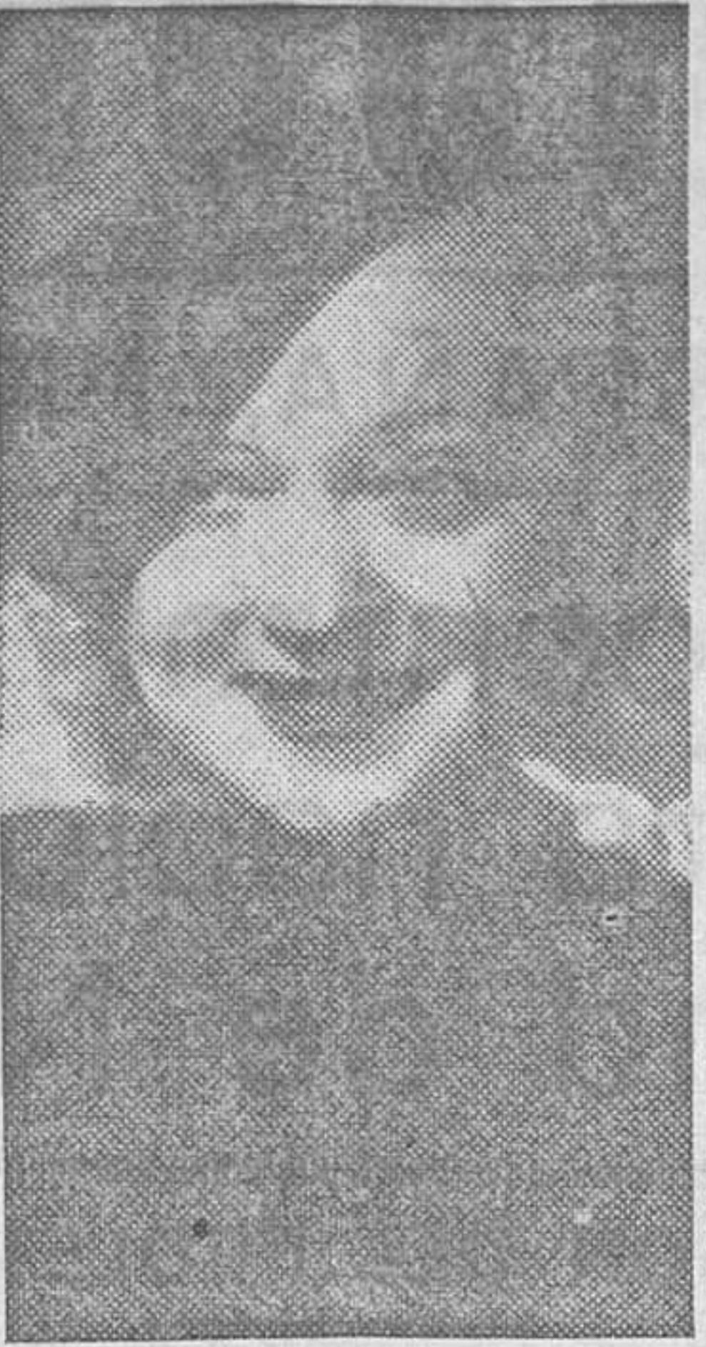
La famosa cantante Maria Eggerth, que reaparecerá el lunes próximo en el film 'Una Carmen rubia', que se estrenará en el Avenida